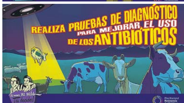
Imágenes de la campaña sobre el uso adecuado de los antibióticos dirigida a médicos y veterinarios. MINISTERIO DE SANIDAD