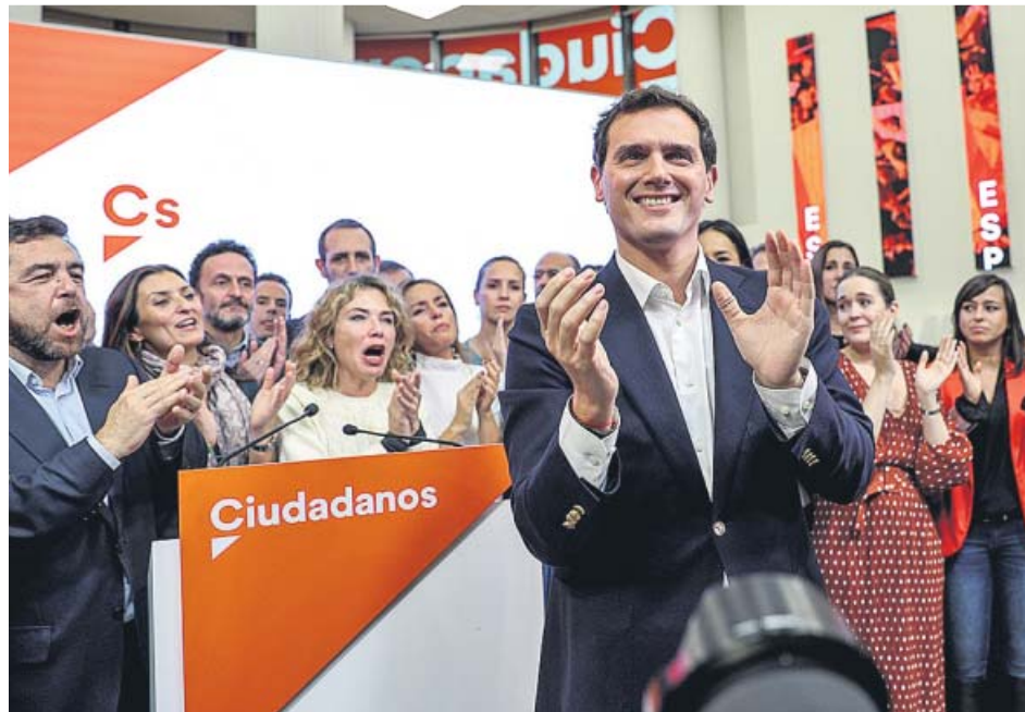
Rivera, ovacionado por miembros de Ciudadanos tras anunciar su dimisión ayer.

Inés Arrimadas, la que fue sucesora de Rivera al frente de Cs en Cataluña cuando este dio el salto a Madrid, encabeza todas las apuestas para tomar ahora el relevo al frente de la presidencia nacional, aunque otros candidatos podrían tratar de disputarle el puesto. Entre las posibles alternativas a Arrimadas desta-