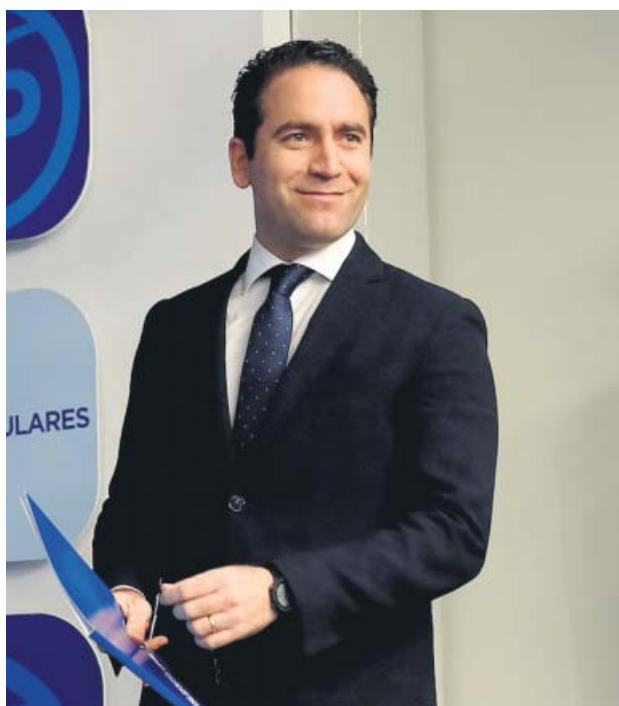
El secretario general del PP, Teodoro García Egea.

«Si el PSOE quiere la abstención del PP, no se lo he oído, pero no se la vamos a dar porque no nos fiáramos de él», aseguró García Egea en una entrevista en Onda Cero , en la que calificó el objetivo de evitar que gobierne Sánchez de «labor patriótica». «En este momento es