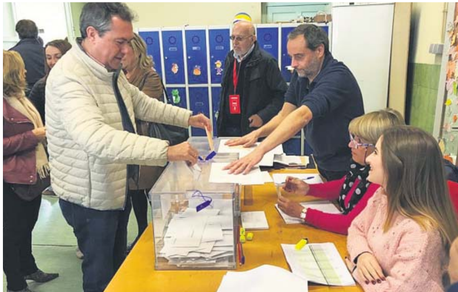
El alcalde de Sevilla, Juan Espadas, depositando su voto el pasado domingo. J.E.

El ascenso de Vox en la capital hispalense se ha registrado en todos los distritos, llegando a ocupar la segunda posición en tres de ellos, Este, Nervión y Los Remedios. En este último es en el que los de Santiago Abascal han obtenido su mejor porcentaje de votos, con un 26,8% de los sufragios.