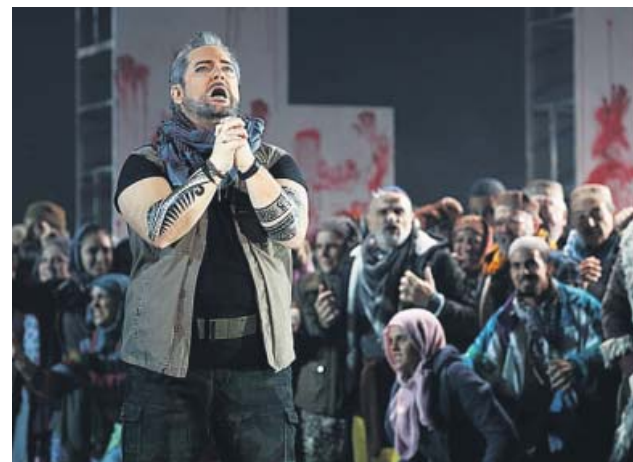
El tenor Gregory Kunde en el papel de Samson. TEATRO DE LA MAESTRANZA

La joven artista Billie Eilish, fenómeno musical de este 2019, ha anunciado en sus redes sociales el lanzamiento global el 13 de noviembre (1 de la madrugada del 14 de noviembre en España) de un nuevo tema titulado Everything I Wanted .