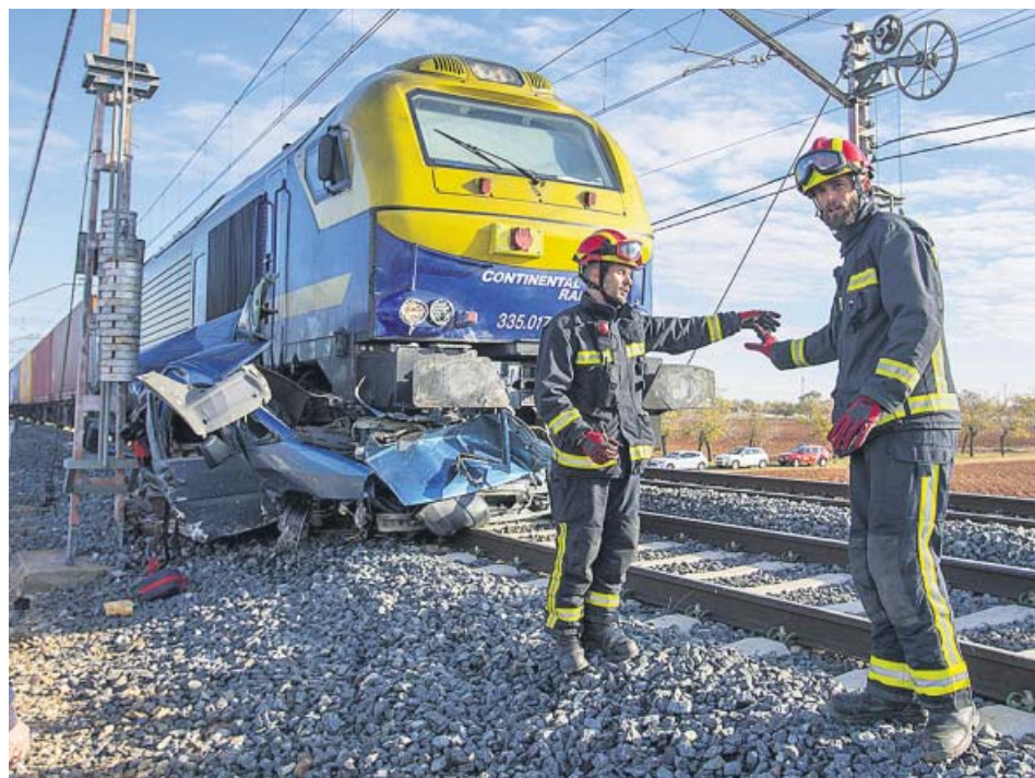
Vista de la furgoneta tras la colisión contra el tren de mercancías.

Dos hombres fallecieron ayer tras ser arrollados por un tren de mercancías mientras cruzaban la vía en furgoneta, por una zona no habilitada para automóviles, en Manzanares (Ciudad Real). La Guardia Civil explicó que la zona de la colisión no era un paso a nivel, por lo que la furgoneta no podía cruzar la vía por ese punto. El tren de mercancías no descarriló y las personas que iban en él no sufrieron daños. Todavía se desconoce el motivo de la maniobra del conductor de la furgoneta. ●