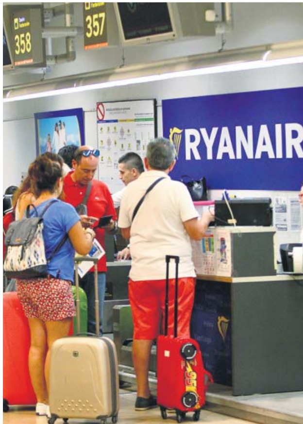
Pasajeros en un mostrador de facturación de Ryanair.

Eso es lo que le ocurrió a una pasajera de un vuelo Madrid-Bruselas el pasado 25 de enero, pues al intentar acceder al avión con una maleta de mano incluida en su tarifa no prioritaria, la tripulación le obligó a abonar en la puerta de embarque un suplemento de 20 euros por llevar también su bolso personal. No conforme con ese recargo extraordinario, la pasajera decidió denunciar y ahora la Justicia le ha dado la