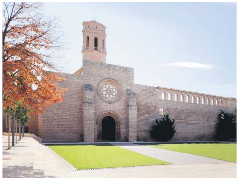
El monasterio de Rueda, en Sástago (Zaragoza), está considerado una joya del arte cisterciense.

El dato de 16,8 millones de usuarios únicos corresponde a los visitantes que ha tenido la edición digital de 20minutos en octubre, a través de sus versiones para móvil, para PC y para Tablet. En cuanto a la edición impresa, es el tercer periódico más leído en España, según confirma el Estudio General de Medios. Mientras los visitantes que reciben los medios de comunicación por internet se miden en España a través de Comscore y de forma mensual, en el caso de la audiencia de los periódicos impresos el dato lo ofrece el EGM, con tres mediciones al año. ●