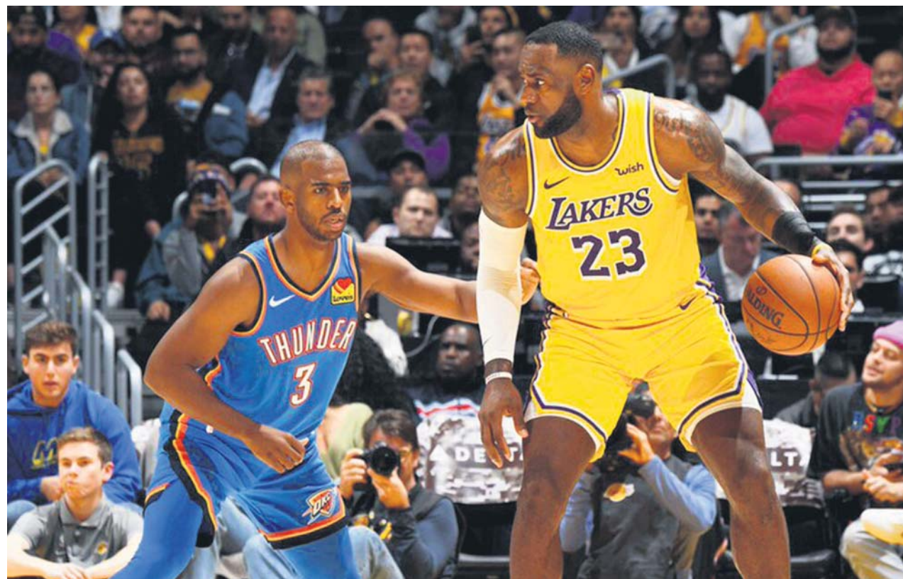
LeBron James, defendido por Chris Paul. LOS ANGELES LAKERS