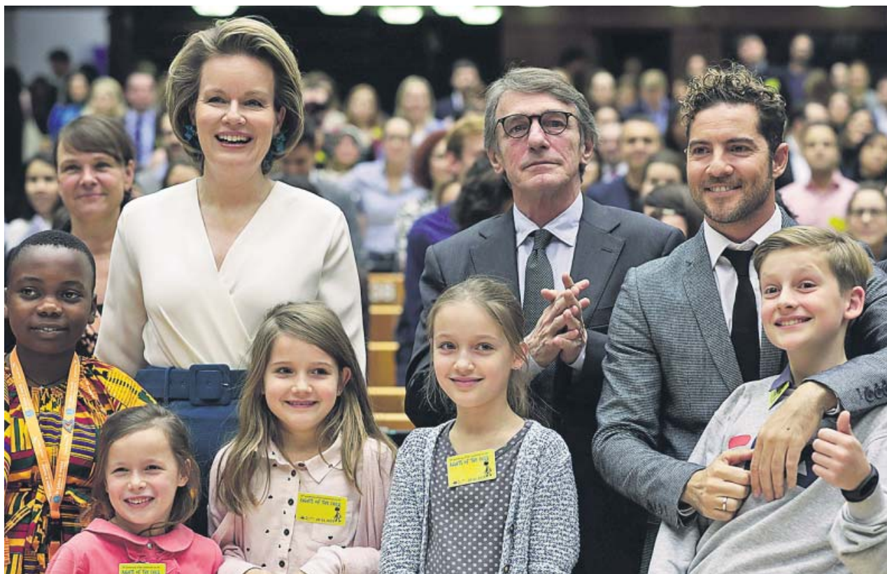
La reina Matilde de Bélgica (i), el presidente del Parlamento Europeo, David Sassoli (C), y David Bisbal, en Bruselas.

La modelo, famosa en la década de los noventa, busca ahora trabajo de forma desesperada aunque los que podrían contratarla huyen despavoridos al oír su nombre. ●