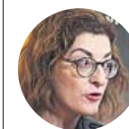
MAITE PAGAZAURTUNDUA Eurodiputada de UPyD

«Las jugadoras de fútbol y las árbitras sufren discriminación, amenazas, insultos o acoso en los campos»