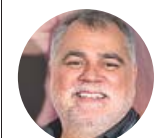
BENITO ZAMBRANO Director de cine

«Una sociedad que no sabe enterrar a sus muertos, del signo que sean, está lejos de ser digna»