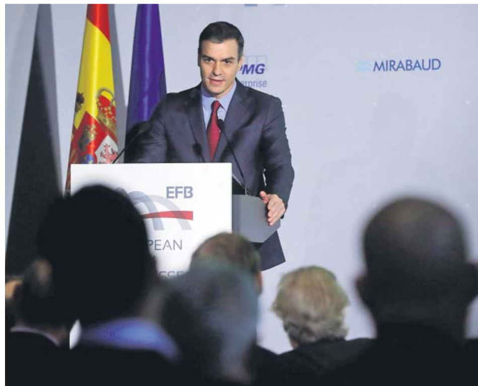
El presidente del Gobierno, Pedro Sánchez, ayer en el Congreso Europeo de Empresa Familiar.