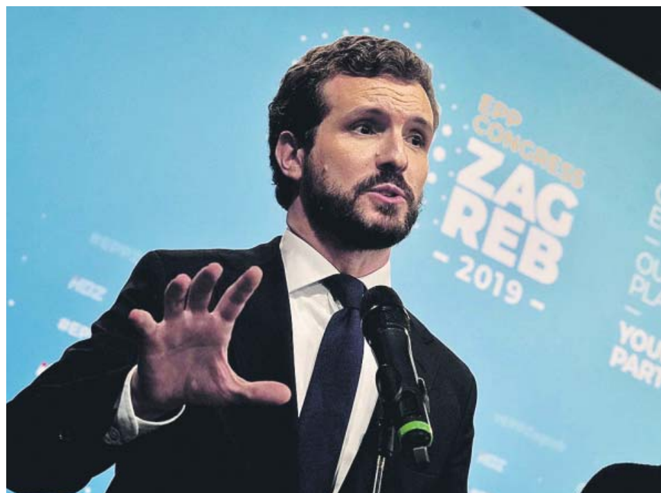
Pablo Casado, ayer, atendiendo a los medios en el Congreso del PP en Zagreb (Croacia). PP

●●● Una opción que ha ocurrido en investiduras anteriores, pero no en las últimas, es la de las ausencias en las votaciones. Podría darse el caso de que haya grupos que decidan no ir (especialmente Bildu), con lo que la investidura saldría adelante en caso de abstención solo de Cs. Cabe recordar que Herri Batasuna, en su momento, no votaba en las investiduras. Es, eso sí, una posibilidad muy complicada de plantear en este caso, y ni siquiera se ha analizado en las filas de los partidos cuyo voto es decisivo para que la legislatura eche a andar.