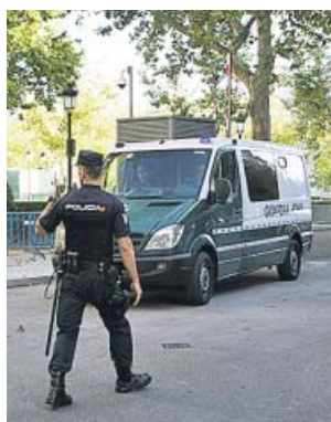
Furgón de la Guardia Civil con los CDR detenidos.

El magistrado ha reiterado el orden de prisión provisional tras verse obligado por la Sala de lo Penal a repetir las co-