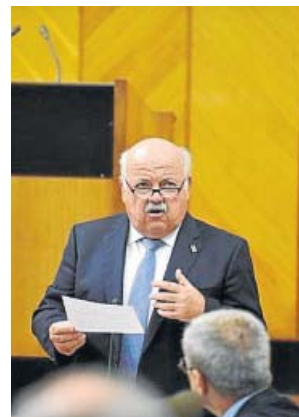
El consejero de Salud y Familia, Jesús Aguirre.

que el plan de choque ha logrado reducir en 2.777 el número de pacientes que esperan una intervención quirúrgica y que eran preferentes en el plan, esto es, los enfermos que estaban pendientes de una intervención y que se encontraban fuera de plazo de un procedimiento sujeto a garantía del tiempo de respuesta, así como aquellos sujetos procedimientos no garantizados con demoras superiores a 365 días. La reducción de la lista de espera en este grupo de pacientes es del 8,8%. ●