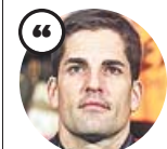
ROBERT MORENO Exseleccionador español

«Para ambas partes es mejor que todo quede entre nosotros. No tengo nada que decir, no creo que sea bueno para nadie»