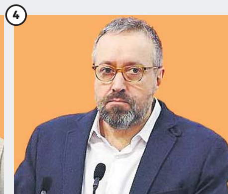
Juan Carlos Girauta Exportavoz de Ciudadanos en el Congreso

Ejerció de secretario de Comunicación del partido y fue diputado en el Parlament y en el Congreso. Importante en las campañas electorales.