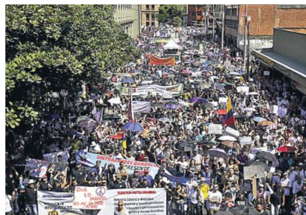
Miles de personas protestan en Medellín.

Las centrales obreras aseguran que el Gobierno prepara un «paquetazo» de medidas que tendrán un fuerte impacto económico y social en los trabajadores, como eliminar el fondo estatal de pensiones, aumentar la edad de jubilación y contratar