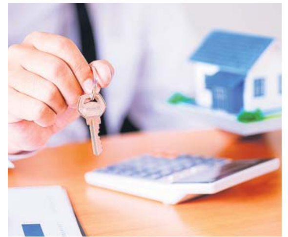
La hipoteca media en España es de 126.250 euros.

Bilbao (156,46 euros) y Sevilla (112,78 euros) forman parte por primera vez de este listado, cuya baja más destacada es la del Ayuntamiento de Zaragoza, que sale por primera vez del ranking. ●