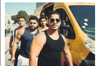
El barrio de Montfermeil y sus vecinos.

No hay malas hierbas, ni malos hombres. No hay más que malos cultivadores». Es la frase de Victor Hugo con la que Ladj Ly cierra Los miserables . Coge prestado el título de la gran obra del escritor porque su historia también tiene como escenario el barrio de Montfermeil, donde Ly creció y donde vivían los Thenardier, y porque, casi 150 años después, las condiciones de miseria siguen haciendo de esta banlieue de París un polvorín constante que solo se sal-