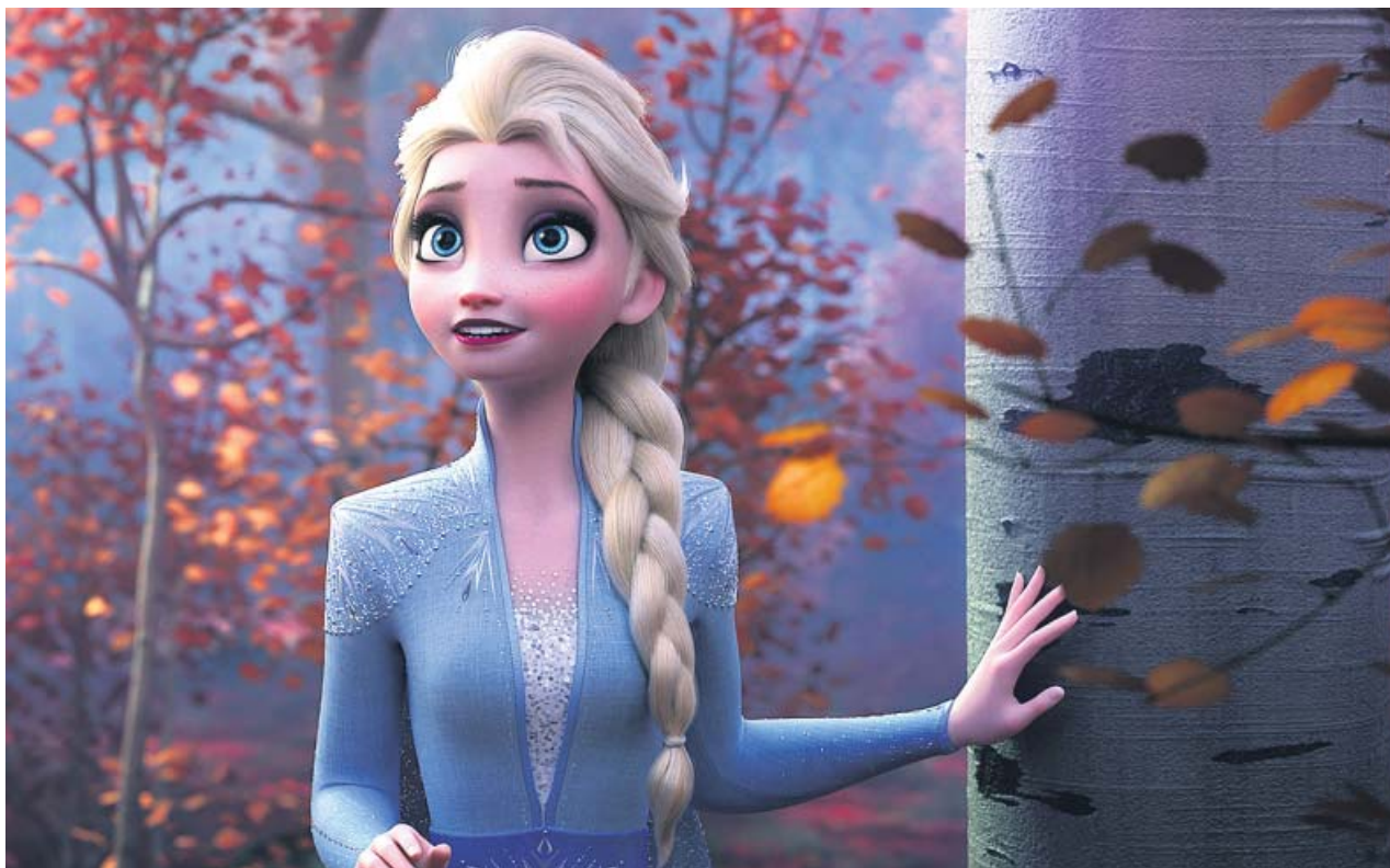
En Frozen II , la reina Elsa busca sus raíces en un bosque otoñal. DISNEY