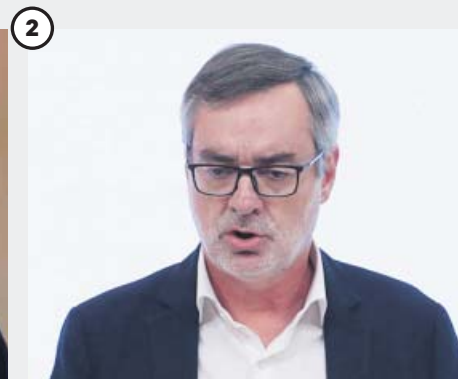
José Manuel Villegas Ex secretario general de Ciudadanos

Presidente de Ciudadanos desde 2006 hasta el 11 de noviembre de este año, justo después de perder 47 escaños en las elecciones generales.