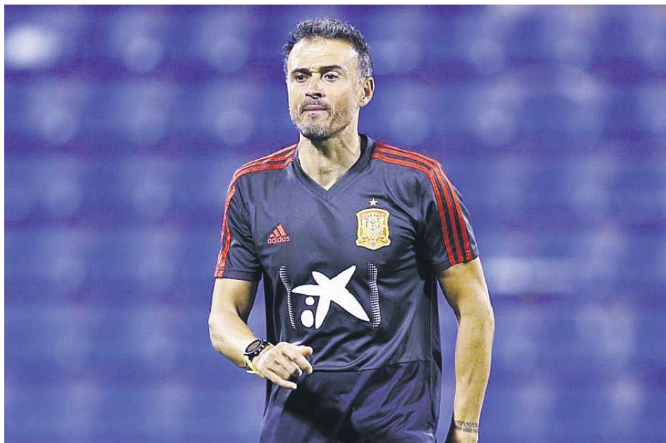
Luis Enrique, en una fotografía con la selección española.

Se limitó a sugerir que Robert Moreno fuera su sustituto. El propio Luis Enrique quiso que la solución continuista fuera la elegida y que el hombre que estuvo a su lado