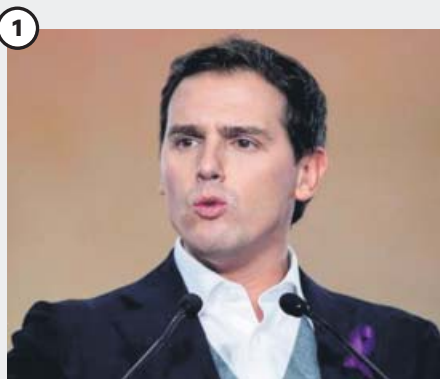
Albert Rivera Expresidente de Ciudadanos

Presidente de Ciudadanos desde 2006 hasta el 11 de noviembre de este año, justo después de perder 47 escaños en las elecciones generales.