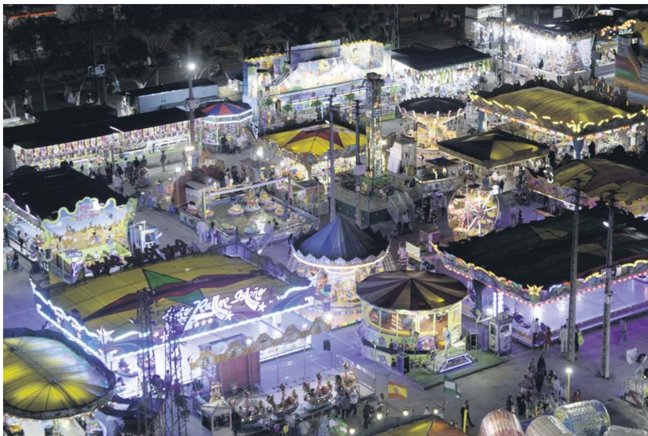
Vista aérea de la calle del Infierno, donde se ubican las atracciones de la Feria de Abril.

El pleno municipal aprobó ayer, con los únicos votos en contra del PSOE, que la música, megafonía y sirenas de las atracciones y quioscos-bar de la calle del Infierno de la Feria de Abril no puedan sonar entre las 00.00 y