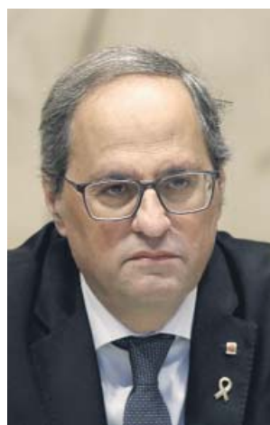
El president de la Generalitat, Quim Torra.

Hoy por hoy, insistió Torra, queda descartado «completamente cualquier adelanto electoral». No obstante, el dirigente también señaló que «las cosas no dependen solo del president », pese a que es únicamente él quien puede convocar a las urnas. Y es que Torra se enfrenta a una posible inhabilitación judicial para ejercer cargos públicos si se