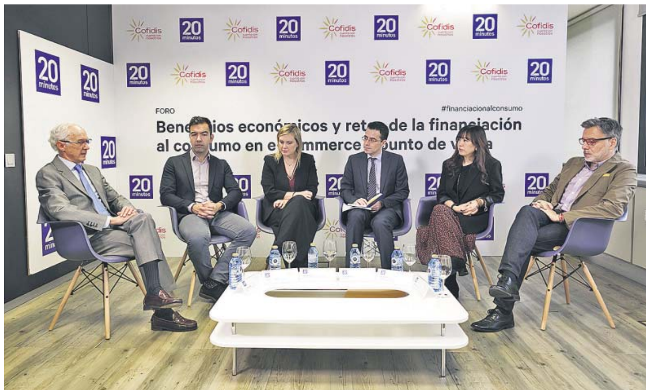
El panel de expertos que participaron ayer en el foro sobre beneficios y retos de la financiación al consumo.

Esta transformación, por la cual la mayor parte de procesos de compra se realiza online , ya es mayoritaria en algunos sectores como el de los viajes o incluso el de la telefonía móvil, pe-