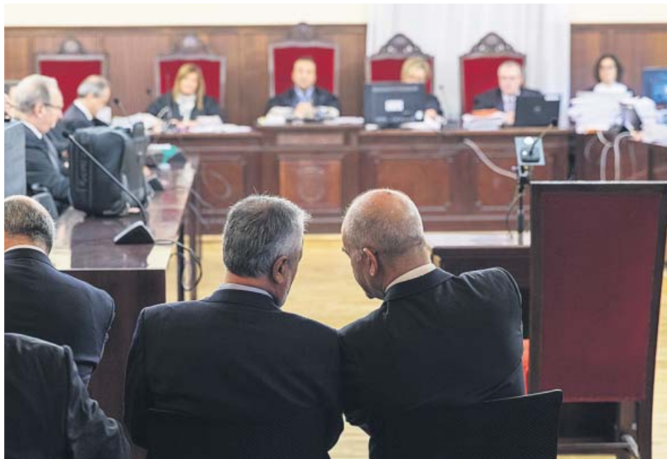
Griñán (i) y Chaves, durante el juicio de la pieza política de los ERE.

La medida se llevará a cabo una vez que el Tribunal Supremo (TS) haga firme la sentencia tras el recurso que los condenados van a presentar, aunque el proceso, admitieron ayer desde el Ejecutivo, será «complicado» y «llevará mucho tiempo», ya que la Junta tendrá que estar personada en muchos casos durante años para reclamar las cantidades. En estos momentos, las consejerías de Hacienda y de Empleo están cruzando