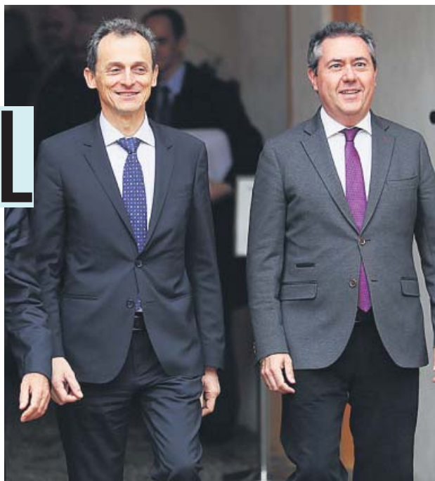
El ministro de Ciencia en funciones, Pedro Duque (i), junto al alcalde de Sevilla, Juan Espadas, ayer.

Con estas cifras sobre la mesa, no es de extrañar que la ciudad haya ostentado este año la Presidencia de la Red