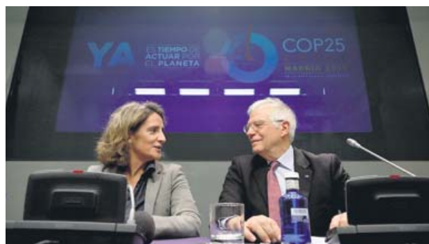
Los ministros en funciones Teresa Ribera y Josep Borrell.

En lugar de Trump, llegará una nutrida representación de demócratas estadounidenses, 16 congresistas y senadores con la presidenta del Congreso, Nancy Pelosi, a la cabeza.