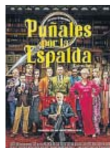
2019. Director Rian Johnson Reparto Daniel Craig, Chris Evans, Ana de Armas

Johnson es consciente de que, más allá de la diversión proporcionada por la búsqueda de pistas para resolver el crimen antes de la revelación final, los misterios de Christie funcionan gracias a dos elementos combinados: las peculiaridades de sus investigadores y una chispa de ironía que no se apaga aunque se acumulen los fiambres. Para salir victorioso de la réplica cuenta con la colaboración de Daniel Craig en el papel del detective privado Benoit