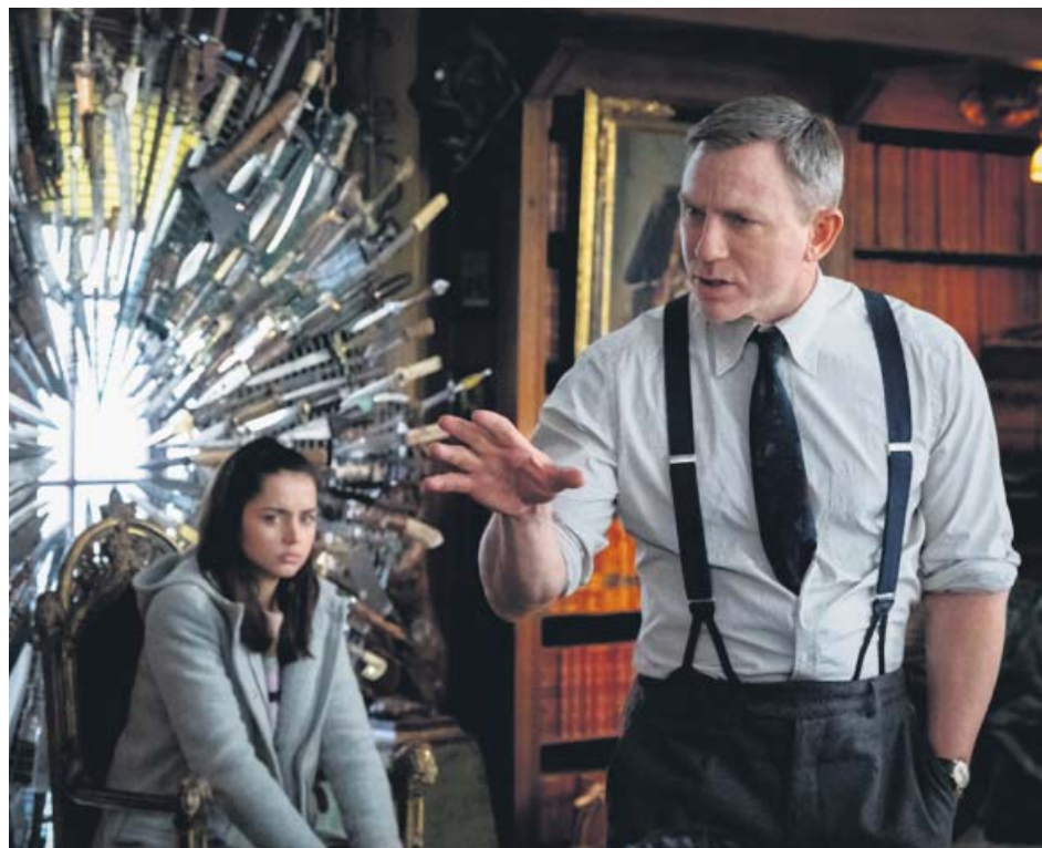
Ana de Armas y Daniel Craig, sospechosa y detective en busca del asesino.

Puñales por la espalda es una pieza whodunit ortodoxa —reparto coral en un entorno cerrado, actores famosos interpretando personajes de brocha gorda, detective excéntrico y cadáver a los postres— que toma la plantilla clásica para plegarla, voltearla e incluso rasgarla con habilidad papirofléxica: aquí, la identidad de quién está detrás de la muerte del adinerado patriarca de turno (Christopher Plummer) es lo de menos.