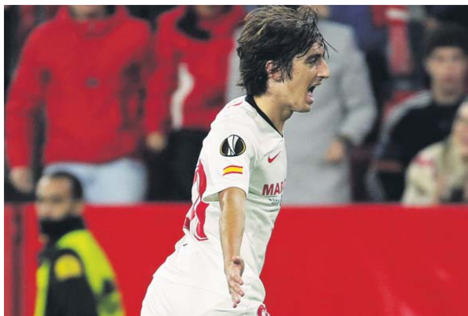
Bryan Gil celebra su gol con el Sevilla ante el Qarabag.

LEGANÉS El domingo, el cuadro sevillano se mide en el Pizjuán a los madrileños