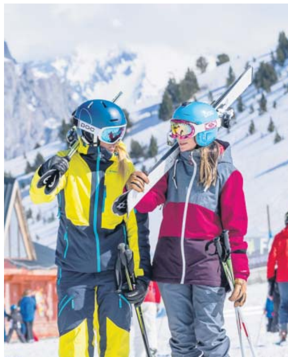
Esquiadores, en la estación de Panticosa. ARAMÓN