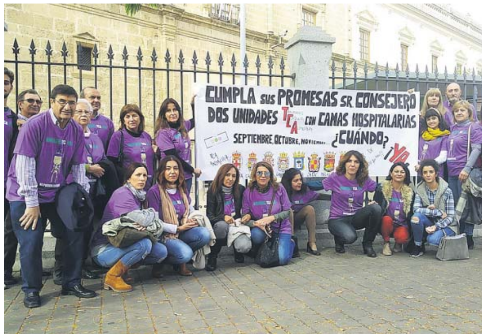
Concentración de familias afectadas a las puertas del Parlamento, ayer.