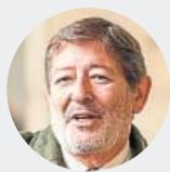
Francisco J. Guerrero EX DIRECTOR GRAL. DE TRABAJO Malversación y prevaricación / 7 años y 11 meses de prisión y 19 años y seis meses de inhabilitación