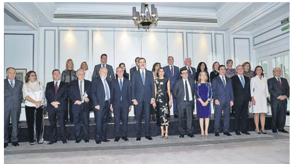
Los reyes, Felipe VI y Letizia, junto a diferentes personalidades y miembros del jurado.

Un niño de dos años se encontraba al cierre de esta edición (23.00 horas) en estado crítico al caer desde una tercera planta a la vía pública en la Calle Ingeniero Paz Peraza del municipio de Arrecife (Lanzarote), según informó el Centro Coordinador de Emergencias y Seguridad (Ceco.es). Las diligencias, por el momento, siguen abiertas.