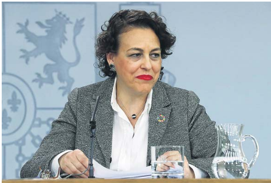
La ministra de Trabajo, Migraciones y Seguridad Social en funciones, Magdalena Valerio.

En su primer diciembre en la Moncloa, en 2018, Sánchez decretó una subida del 22%, cuando pasó de 735 a 900 euros el SMI. Precisamente, esta subida récord es la que ha llevado a pensar a los empresarios que en 2020 quizá no debería haber un nuevo incremento, una idea con la que discrepan totalmente los sindicatos, que exigen que el salario mínimo aumente otros 100 euros más al mes y se sitúe en los 1.000 euros.