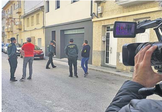
Los agentes, ayer, en el registro de la vivienda de L'Ollería.

Estas circunstancias han permitido a los vecinos del pueblo grande relatar sus observaciones. Aseguran haber visto al sospechoso recientemente en la casa. Y no solo eso. Según re-