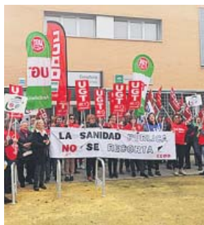
Protesta en el centro de salud de Palmete. CC OO

El de Palmete no es el único caso. No en vano, CC OO de Sevilla denuncia que el Servicio Andaluz de Salud (SAS) ha decidido también «cerrar todos los centros de salud del Distrito Sevilla por las tardes