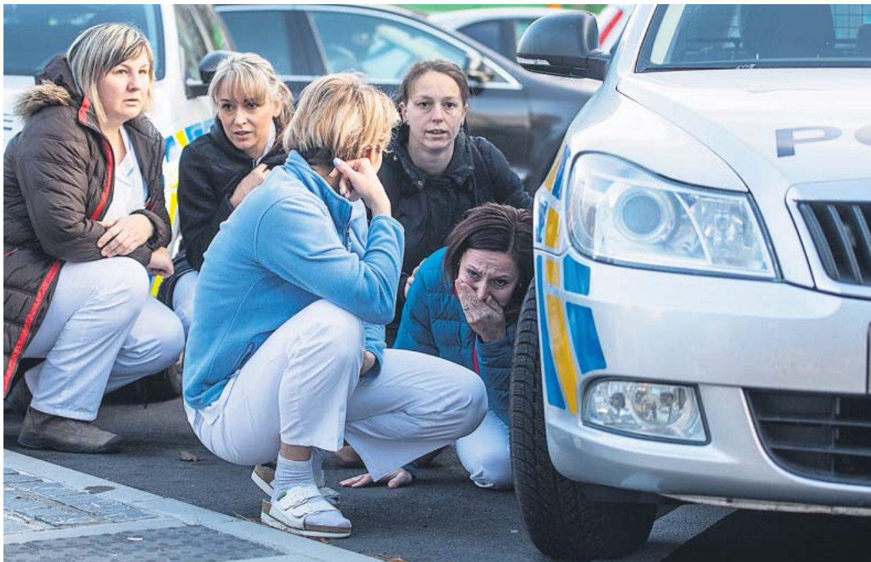
Varias personas se protegen detrás de los coches en los alrededores del hospital de Ostrava donde se produjo el tiroteo.

La acusada, M. C. G. R., era cotitular de una cuenta corriente en CaixaBank junto con su madre, que falleció en julio de 1992 y que tenía reconocido el derecho al cobro de una pensión del INSS desde el 1 de octubre de 1979. Desde agosto de 1992 a diciembre de 1996, se satisfizo por parte del INSS la pensión, si bien no se pudo averiguar la cuantía exacta percibida por la procesada al no existir entonces ficheros automatizados. ●