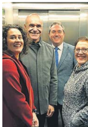
El alcalde (2d), en el nuevo ascensor, ayer.

El elevador de Pino Montano es el tercero de los cuatro proyectos que ya han sido aprobados por el Ayuntamiento y al que en los próximos días se sumará uno nuevo situado en el barrio de Alcosa. Tanto Pino Montano