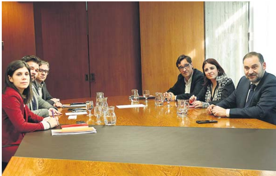
Imagen de la reunión ayer del comité negociador del PSOE-PSC y ERC en el AMB. AON

TRAS DOS HORAS y media de cita emiten un comunicado en el que destacan voluntad de seguir negociando EN EL AMB El encuentro se realizó en terreno neutral y a las afueras de Barcelona SIN FECHA A diferencia de las dos anteriores, ayer no se fijó una nueva cita JXCAT Retiró la moción sobre autodeterminación para no interferir