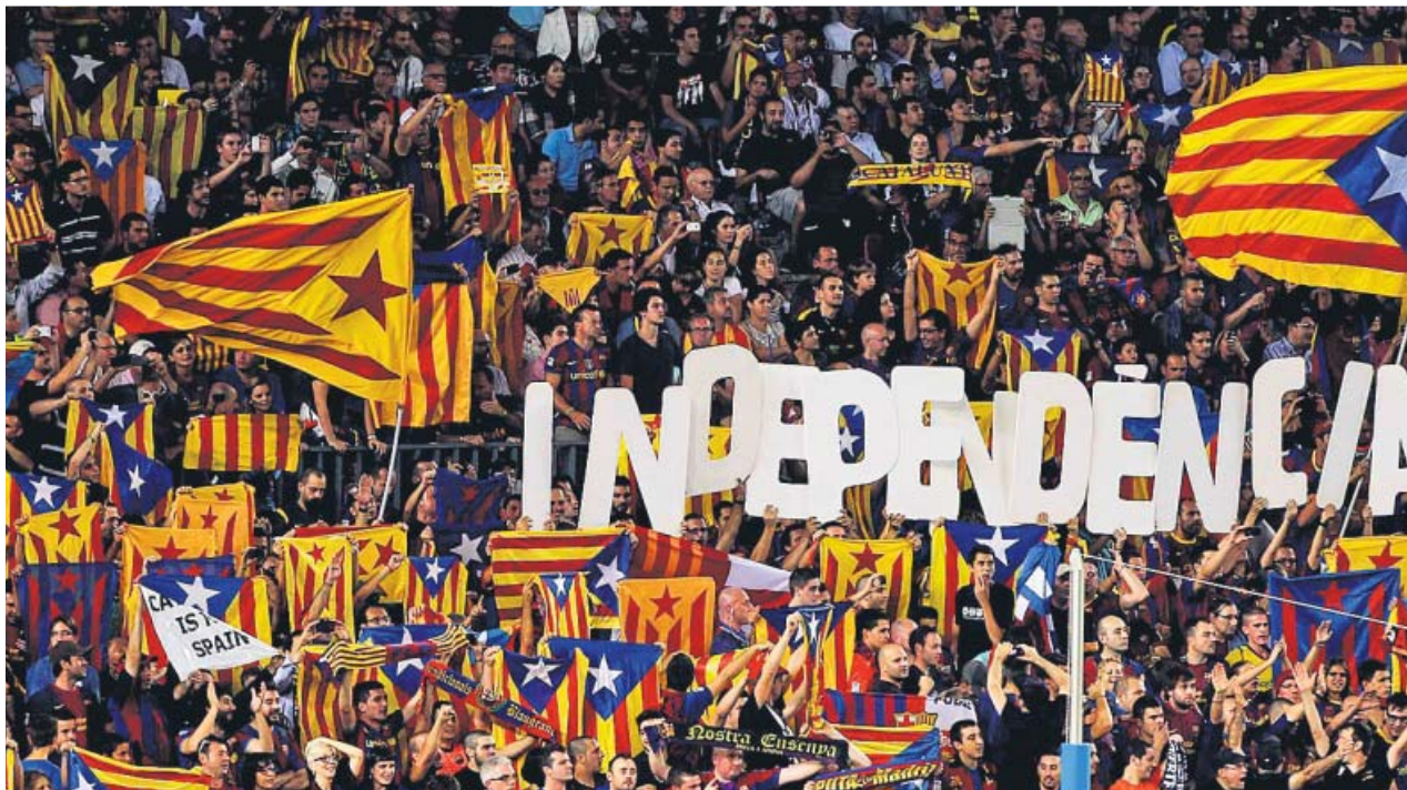
El estadio azulgrana ya ha sido escenario de protestas políticas de tinte independentista.