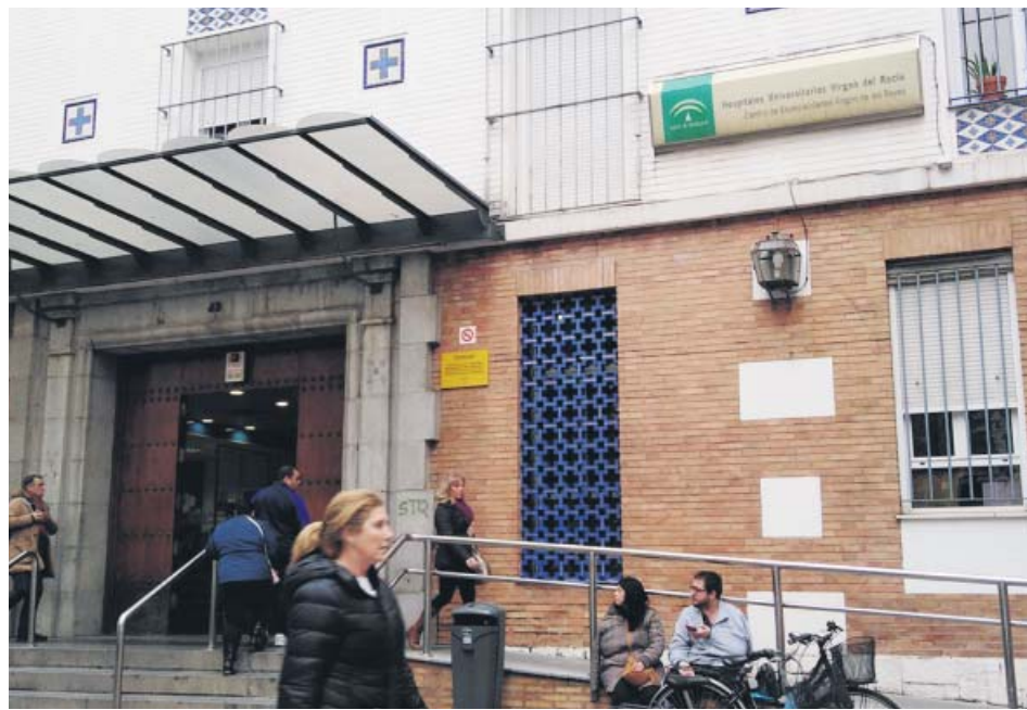
Centro de especialidades Virgen de los Reyes, en Marqués de Paradas.