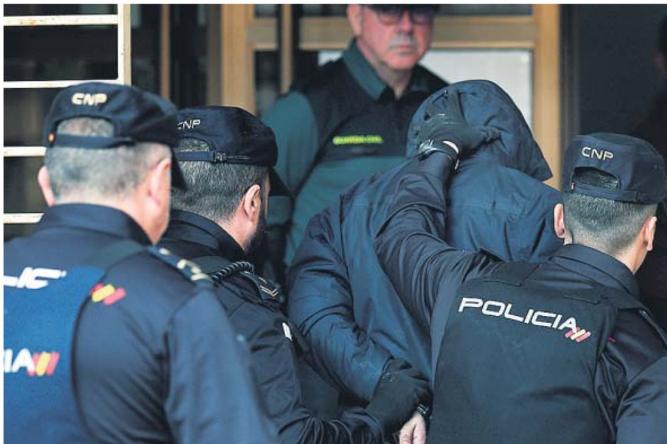
El autor confeso del crimen de Marta Calvo a su llegada a los juzgados.