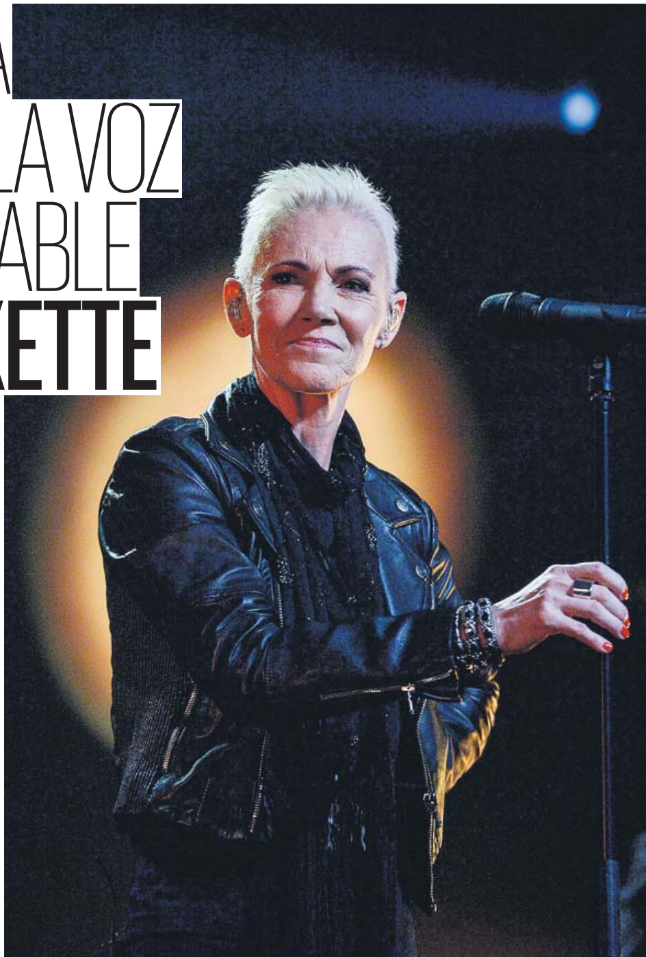
Marie Fredriksson durante un concierto de Roxette en Estocolmo en 2014.

Marie Fredriksson y Per Gessle se conocían desde hacía unos años. Él tenía –aún se reúnen– un grupo que despuntó, Gyllene Tider; ella concatenó expe-