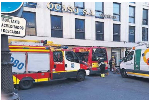
Autobús accidentado el pasado sábado.

Así lo apuntó ayer el alcalde, Juan Espadas, que descartó problemas de «obsolescencia o de mantenimiento»