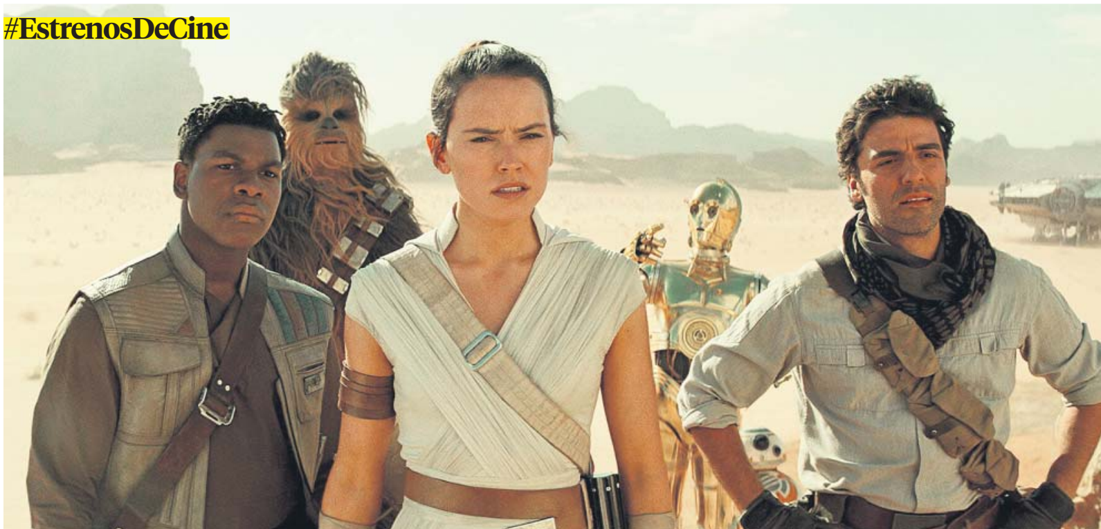
Rey (en el centro) y el resto de héroes protagonistas de Star Wars: El ascenso de Skywalker .