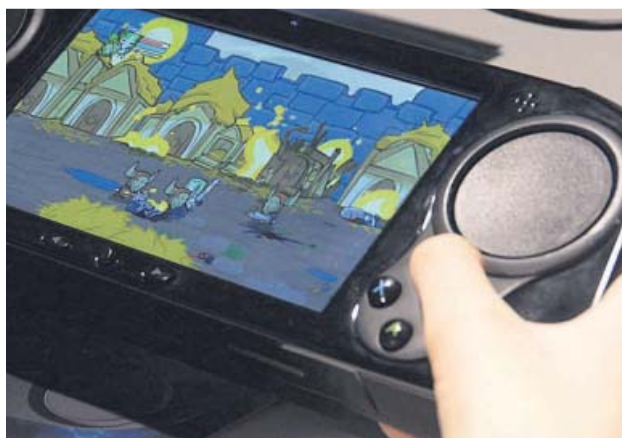
Un jugador probando Smach Z en la Gamescom. SMACH Z

Smach Z es como tener un ordenador en la palma de la mano con una potencia y una calidad gráfica inéditas en un dispositivo portátil. Se puede jugar a los títulos digitales que el usuario compre o haya comprado en las diferentes plataformas existentes y a la vez se puede utilizar para ver Netflix, navegar por internet, instalar programas e incluso conectar dispositivos bluetooth como teclados y rato-