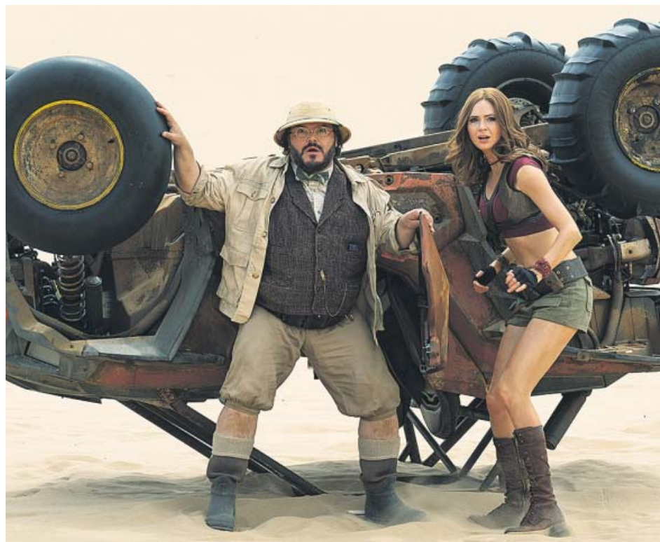
Jack Black y Karen Gillan vuelven al videojuego más salvaje del cine.

En este Siguiente nivel se repite la historia... lo que tal vez no ha sido la mejor de las decisiones. En vez de innovar, amplifica todo lo que funcionó en la anterior entrega. ¿Que congeniaba la 'cuchipandi' interracial? Pues añadimos un nuevo miembro oriental (Awkwafi-