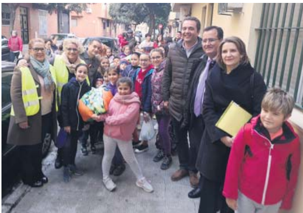
Alumnos del CEIP María Zambrano de Pino Montano. AYUNTAMIENTO

El proyecto se ha probado ya en dos centros, con una subida de 14 puntos porcentuales en los viajes en bici o a pie