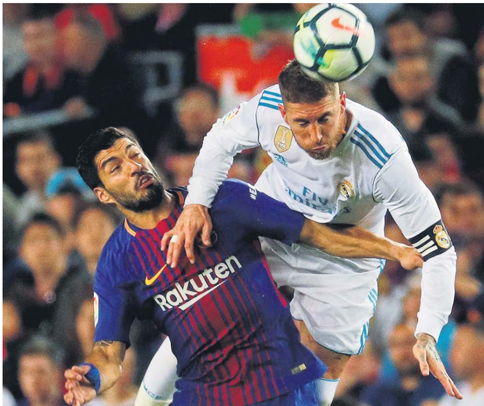
Pugna entre Luis Suárez y Sergio Ramos en el último Clásico en el Camp Nou.