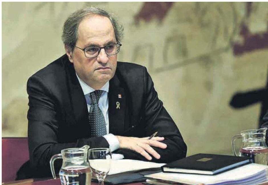
El president de la Generalitat, Quim Torra.

Al propio Torra tampoco le convence este movimiento, pese a que últimamente ha tratado de contactar en varias ocasiones con Sánchez sin éxito, tachó en octubre de «increíble» que Sánchez no quisiera cogerle el teléfono e incluso publicó un vídeo en el que reaccionaba con un airado «qué cojones» a una de las llamadas infructuosas. Fuentes de la Generalitat afirmaron ayer que incluir a Torra en una lista de llamadas a los presidentes autonómicos no es la vía para «encarar el conflicto» catalán «con valentía y cora-