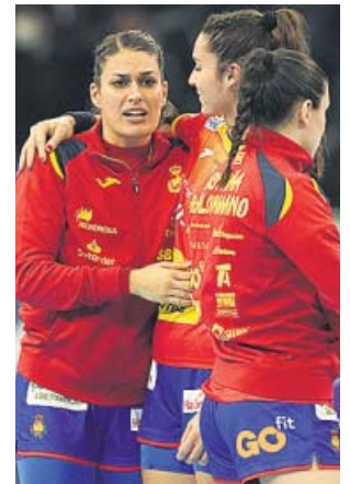
Varias jugadoras españolas ante Rusia.

Quiméricas fueron las opciones de victoria de España en la final del Europeo 2008, el torneo que dio origen a la leyenda de las Guerreras, en el encuentro por el bronce del Mundial de China 2009 o en las semifinales del Mundial de Brasil 2011. Pero tres años más tarde, en Budapest, el conjunto español, que cayó por 28-25,