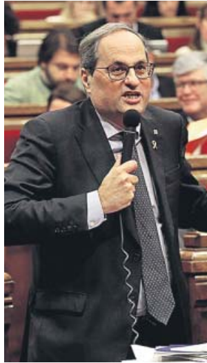
Quim Torra, interviniendo ayer en el Parlament.

Convocará en enero a los partidos catalanes en busca de «un pacto nacional para ejercer el derecho a decidir»