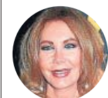
NORMA DUVAL Actriz y empresaria

«Por supuesto que sí, me he sentido acosada, pero yo me sabía defender. Las mujeres no somos tontas, sobre todo en mi mundo»