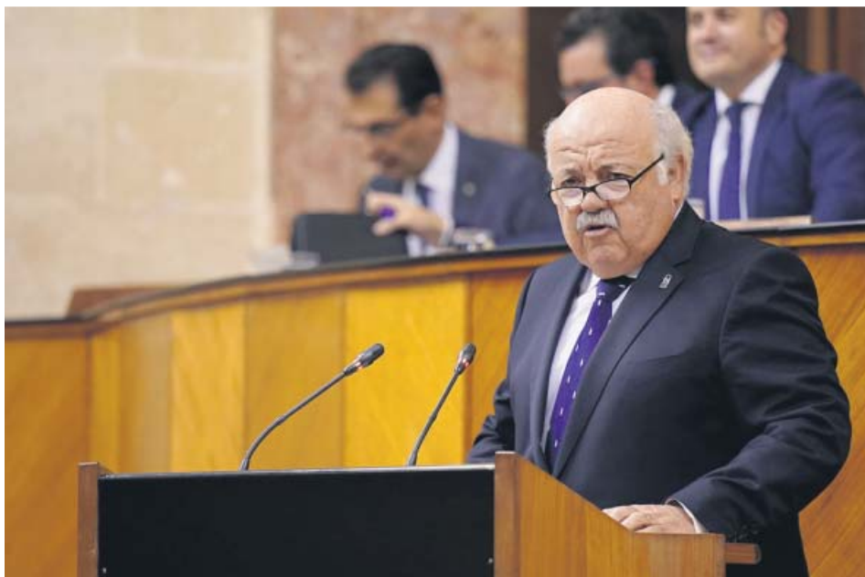
El consejero de Salud, Jesús Aguirre, ayer en su comparecencia en el Parlamento. JUNTA

EL CONSEJERO compareció ayer en un debate monográfico a petición del PSOE-A y Adelante Andalucía, que le reprocharon su «mala gestión» y las protestas de los profesionales sanitarios. AGUIRRE puso en valor el plan de choque contra las listas y las contrataciones realizadas en el SAS