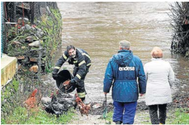
Un bombero rescata a unas gallinas en Ponferrada (León).