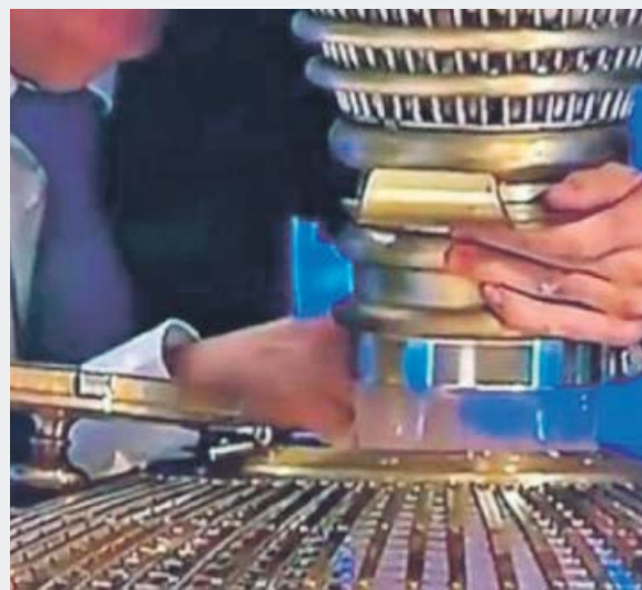
Momento del polémico gesto antes del sorteo.

Un extraño gesto del encargado de poner en funcionamiento el bombo desató la polémica. Introducidas las bolas, se vio cómo metía algo más. Desde LAE aclararon que una bola había caído fuera del bombo y él se habría ocupado de introducirla.