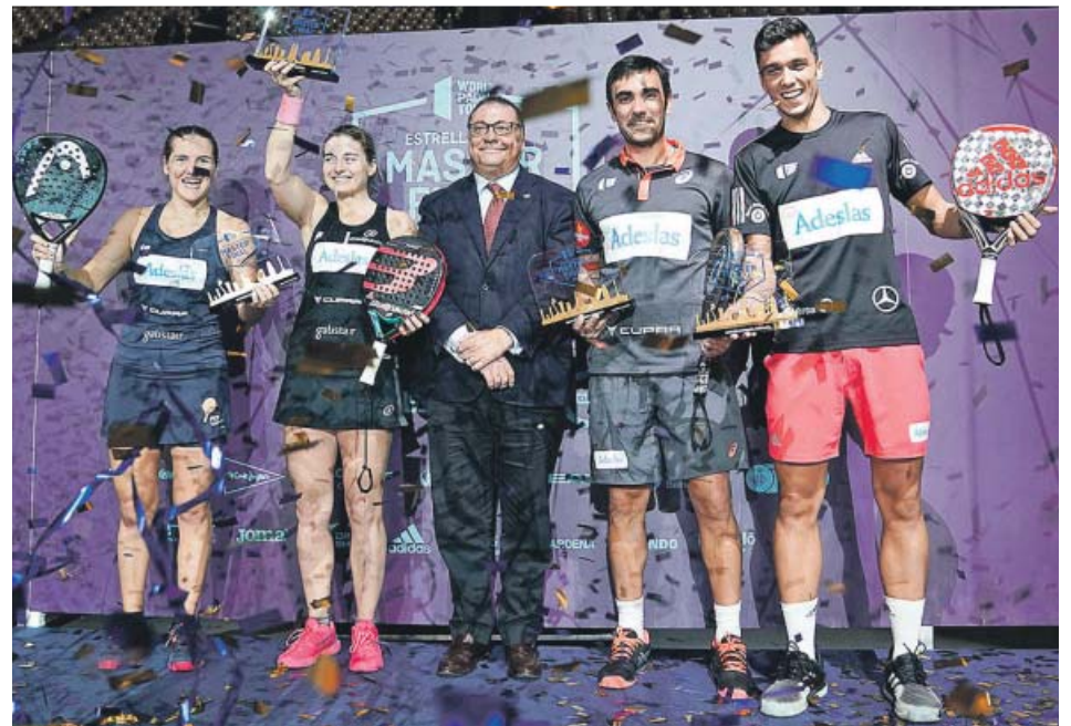
Ari Sánchez y Alejandra Salazar (izq.) y Pablo Lima y Alejandro Galán (dcha.).