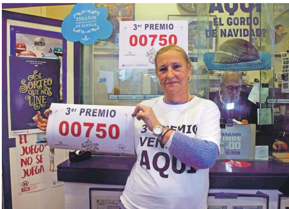
En la primera foto, J. M. a Nogales y Paloma Rguez. se abrazan porque su administración (Sevilla) ha repartido el Gordo. En la segunda, los loteros de La Gata Loca (Málaga) descorchan el champán por el segundo premio. La última muestra el número agraciado con el tercero en Granada. EFE

Otro gallo cantó en el caso del tercer premio (el 00750), que estuvo mucho más repartido a lo largo de la geografía andaluza. Fueron seis las provincias donde cantaron eureka: Granada, Cádiz, Sevilla, Huelva, Almería y Málaga. En concreto, del 00750 se vendieron 400 décimos –40 series– en Almuñécar (Granada), una serie –diez décimos– en Cádiz capital y otra en la ciudad de Sevilla; dos décimos en Punta Umbría (Huelva), y uno tanto en Almería capital como en los municipios malagueños de Arroyo de la Miel y Ronda (Málaga), y en las localidades sevillanas de La Puebla de Cazalla y San Juan de Aznalfarache.