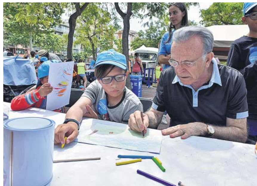
El presidente de Fundación La Caixa, Isidro Fainé, en uno de los eventos solidarios.

Una chica de 22 años murió ayer en Madrid de un disparo de caza accidental en el torax. El incidente ocurrió, concretamente, en un paraje de Valdehondo, próximo a la carretera M-633, según informó Emergencias 112 Comunidad de Madrid. Hasta el lugar se trasladó el Summa, que encontró a la joven en parada cardiorrespiratoria y que no pudo hacer nada para salvarle la vida.