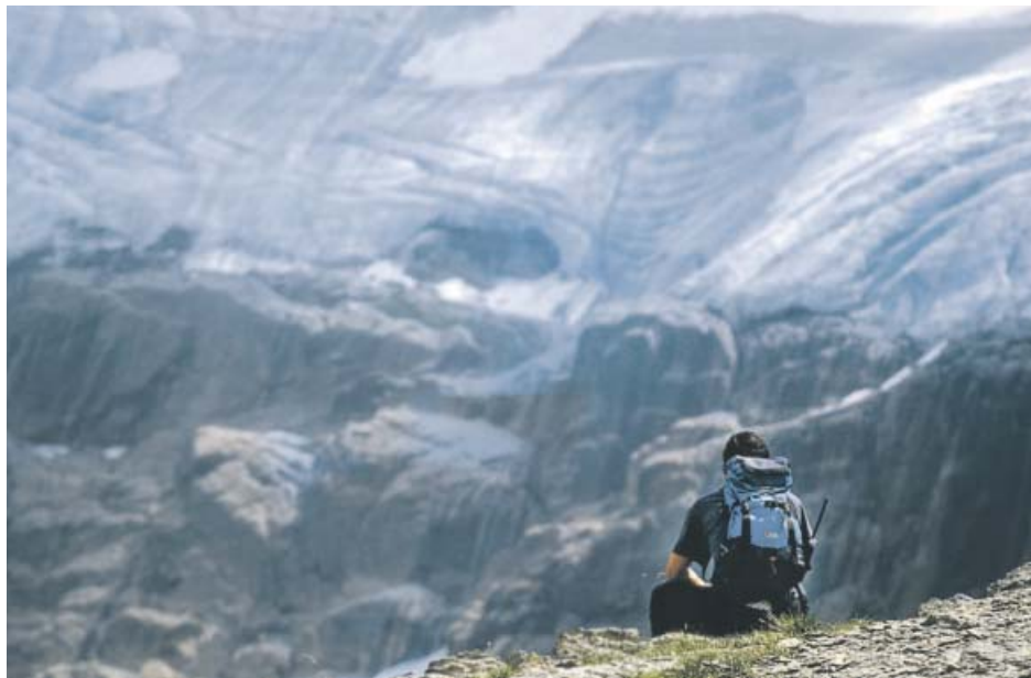
Un montañero observa la cara norte de Monte Perdido.. E.V.C.

Uno de los hielos glaciares más conocidos es, precisamente, el que persiste colgado a unos 2.700 m de altitud en la cara norte del macizo de Monte Perdido, acantonado debajo del pico de 3.355 metros ubicado en el corazón del Parque Nacional de Ordesa y Monte Perdido. Es uno de los 19 glaciares que todavía so-