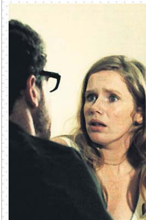
Los protagonistas de la ficción sueca.

Primero fue una serie de 300 minutos y seis capítulos, cada uno con su título (de Inocencia y pánico a En plena noche, en una casa oscura ), en los que Bergman se adentraba en las vísceras de la vida conyugal, poniendo especial atención al papel de las mujeres. No sobra nada, pero ahora recuerdo especialmente dos