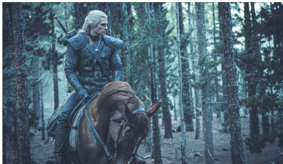
Henry Cavill da vida a Geralt de Rivia en la nueva apuesta de la plataforma.