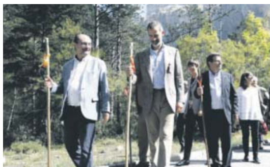
Visita del Rey al Parque Nacional.

Su Majestad el Rey Felipe VI ha estado muy presente en el Centenario de Ordesa y Monte Perdido: visitó el Parque Nacional, presidió la sesión del Senado conmemorativa de los dos parques centenarios (Ordesa y Picos de Europa) y es el presidente de honor del Comité Organizador. El Rey recordó que la conservación de Ordesa es "responsabilidad de todos" y alabó la labor realizada "día a día" por los habitantes del territorio.