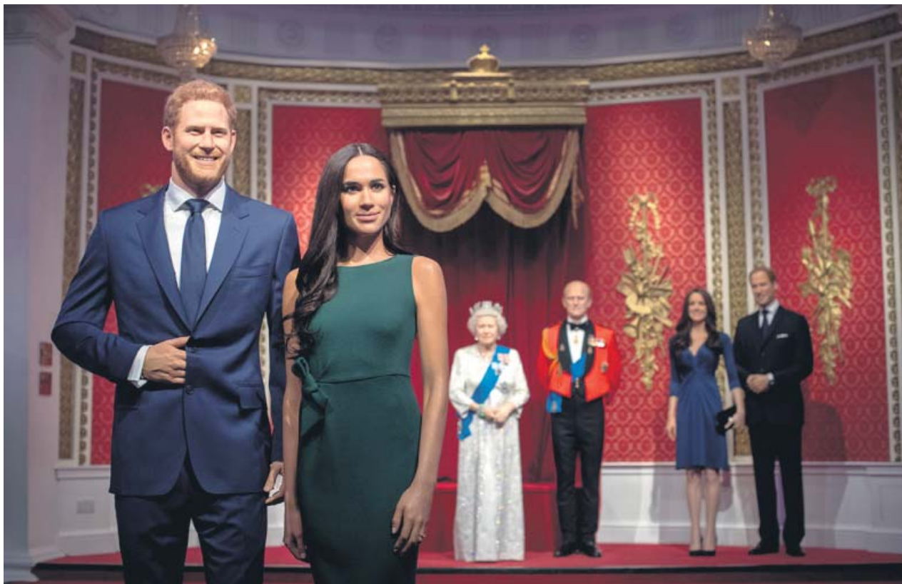
Las figuras de cera del príncipe Harry y Meghan Markle ya no estarán junto a Isabel II y el resto de la casa real.

La hija del torero y la tonadillera ha rechazado una oferta importante para hacer declaraciones sobre su nueva relación. Dice que quiere vivir su historia en la más estricta intimidad. ●