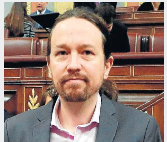
PABLO IGLESIAS Vicepresidente segundo, de Derechos Sociales y Agenda 2030