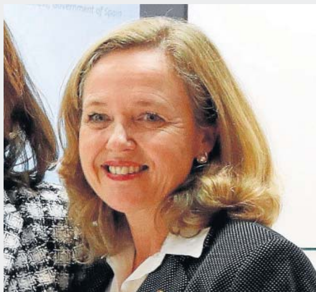
NADIA CALVIÑO Vicepresidenta tercera, de Asuntos Económicos y Transformación Digital