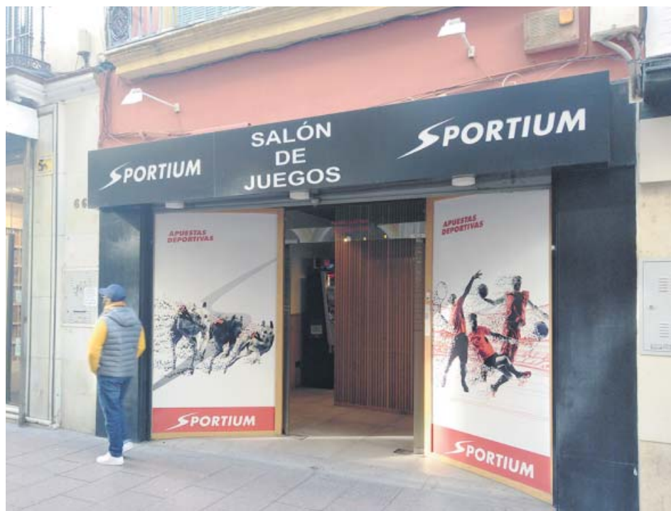
Salón de juegos ubicado en la calle Sierpes de Sevilla. B. R.

Entre las novedades más significativas del decreto aprobado ayer, que entrarán