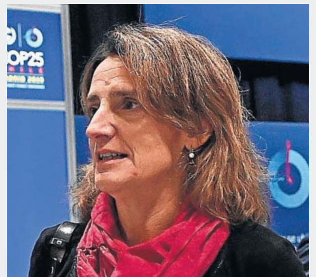
TERESA RIBERA Vicepresidenta cuarta, de Transición Ecológica y Reto Demográfico