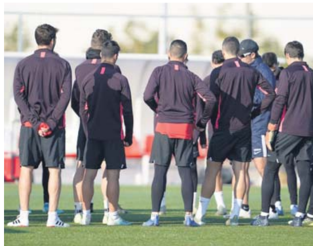
Lopetegui da instrucciones en el campo de césped artificial.

El preparador guipuzcoano, sin el delantero israelí Munas Dabbur, que fue traspasado el martes al Hoffenheim alemán, tuvo ayer a su disposición al centrocampista Fernando Reges, después de que el miércoles se le concediera permiso por el nacimiento de su tercer hijo.