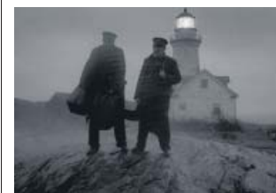
Robert Pattinson y Willem Dafoe, fareros.

Como un faro en el fin del mundo, alzado sobre una grieta entre las tinieblas, la segunda película de Robert Eggers te lanza a la cara la radiación de las interpretaciones al límite de Willem Dafoe y Robert Pattinson. De la oscuridad de la sala de cine brota llena de luz blanca una pantalla —en formato 1.19:1, con fotografía en blanco y negro expresionista de Jarin Blaschke— seguida por la quilla de un barco que avanza mientras el ruido de las olas se confunde con el re-