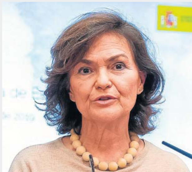
CARMEN CALVO Vicepresidenta primera, de Presidencia y Relaciones con las Cortes