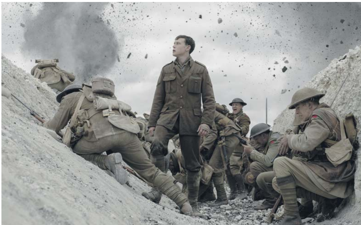
George MacKay, en las trincheras de Sam Mendes para este experimento lleno de adrenalina.