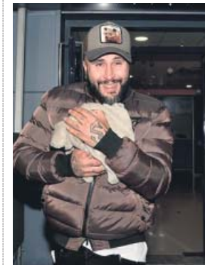
Kiko Rivera, en una imagen reciente.

complicados de su ya explicada adicción a las drogas, hablará por primera vez sobre el tiempo en que su madre, Isabel Pantoja, estuvo en la cárcel.