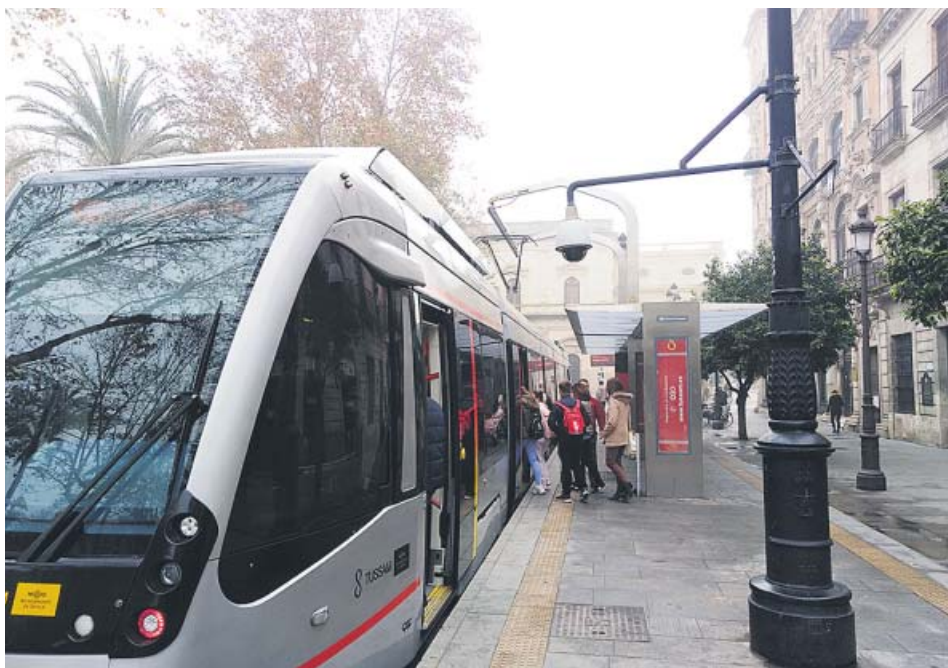
Un grupo de viajeros sube al tranvía en la terminal de la Plaza Nueva. B. R.