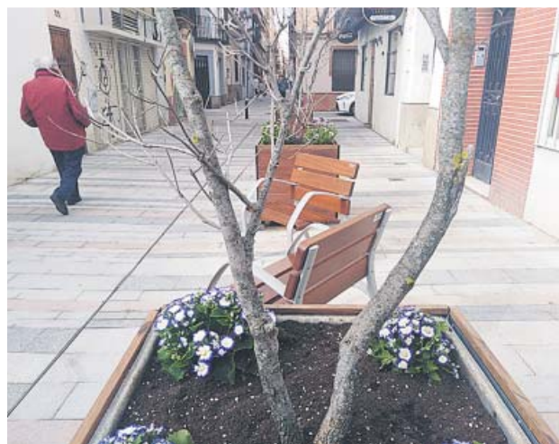
Nuevo aspecto de la calle Baños, con macetones y bancos. B. R.

donde se han renovado las redes de saneamiento y abastecimiento, además de instalarse una nueva iluminación, arbolado y mobiliario urbano y de eliminarse todas las barreras arquitectónicas. Pese a que las dimensiones de la calle dan «pocas opciones de hacer paisajismo, sí hay detalles», explicó el alcalde, como la incorporación de más vegetación con tres árboles en la parte más próxima a San Vicente, seis grandes macetones y bancos, y otros tres árboles más en la plaza de la Gavidia. «Otro Urbanismo es posible», aseveró el regidor, que