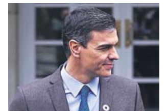
El presidente del Gobierno, Pedro Sánchez, en Moncloa.

ticipación paritaria. Según el Ejecutivo, este órgano responde a «la necesidad» de ambos departamentos de «actuar como un único actor». ●