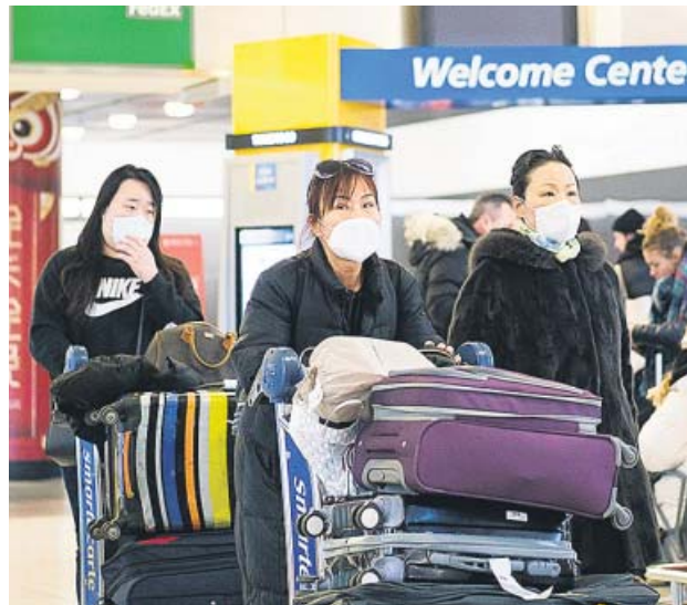
Viajeros con mascarillas en el aeropuerto de Nueva York.

Unos 600 ciudadanos de 14 países de la UE desean ser repatriados desde China, una ope-