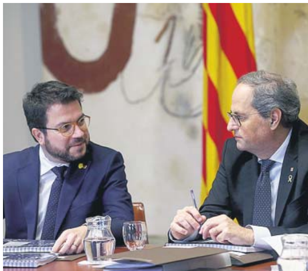
Quim Torra y Pere Aragonès, ayer, en la reunión del Govern.

20M.ES/CATALUÑA Puedes consultar toda la actualidad sobre la política catalana en nuestra web 20minutos.es