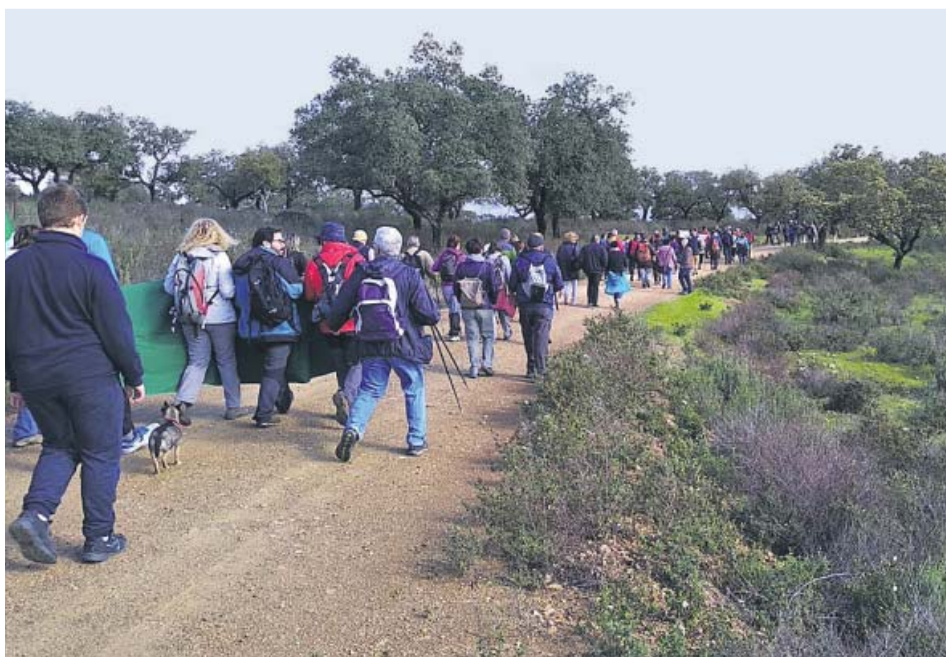
Un grupo de personas en una de las marchas realizadas por la asociación. ASEDECA

Asedeca, además de las marchas lúdicas, también realiza visitas a los diferentes consistorios para pedirles que registren los caminos y vías pecuarias. Algunos, como Osuna (Sevilla) o Santa Ana la Real (Huelva), ya se han puesto en marcha.