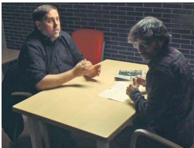
Junqueras, entrevistado por Évole, en Lledoners.

DIÁLOGO El líder de ERC apoya desde la cárcel la línea negociadora de su partido PRIVILEGIOS Niega que disfrute en prisión de más ventajas que los presos comunes