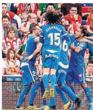
Los jugadores del Getafe celebran uno de los goles.

Una victoria inapelable de los azulones, que se auparon a la tercera plaza provisional de la tabla —empatados a 39 puntos con el Sevilla, cuarto— y abrie-