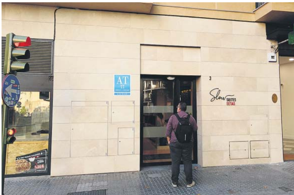
Apartamentos turísticos ubicados en la plaza de San Pedro. B. R.

LA MAYOR PARTE se ubican en el casco antiguo y más de 150 fueron para nuevos emplazamientos. LOS VECINOS denuncian que les están «expulsando» de sus barrios y abogan por una «limitación», mientras que el sector defiende que se genera «autoempleo» y los turistas gastan más