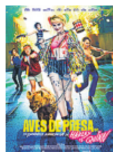
2020. Director Cathy Yan Reparto Margot Robbie, Rosie Perez, Ewan McGregor

Esta no es una producción ambiciosa, ni busca serlo. No hay reflexiones grandilocuentes sino un relato sencillo en el mejor de los sentidos. Aquí, a falta de testosterona, tenemos a unas aves enjauladas que gritan (ojo a la Cazadora, diestra en la lucha, maravillosamente inepta en las relaciones sociales); a falta de