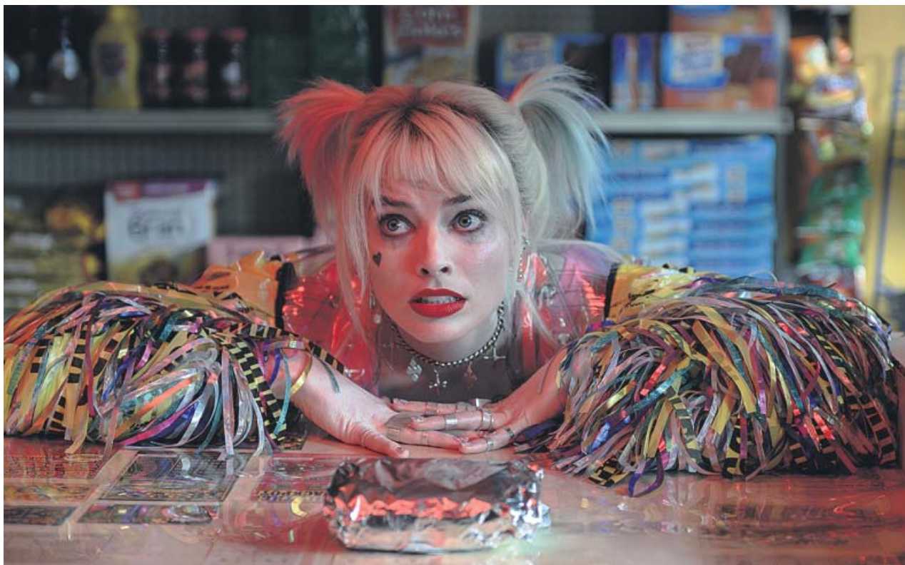
Corte de coletas y chaqueta de serpentinas: qué bien le ha sentado la soltería a Harley Quinn (Margot Robbie).