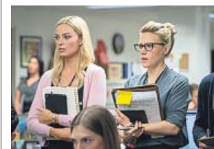
Margot Robbie y Kate McKinnon.

Apadrinado por el magnate Rupert Murdoch, Roger Ailes creó Fox News en 1996 con el objetivo de ser el altavoz de la derecha estadounidense. Bajo su dirección, la cadena mantuvo un liderazgo de audiencia estratosférico. El escándalo ( Bombshell ) presta su voz a las periodistas que durante años sufrieron abusos sexuales por parte de Ailes: las presentadoras Megyn Kelly y Gretchen Carlson, interpretadas por Charlize Theron