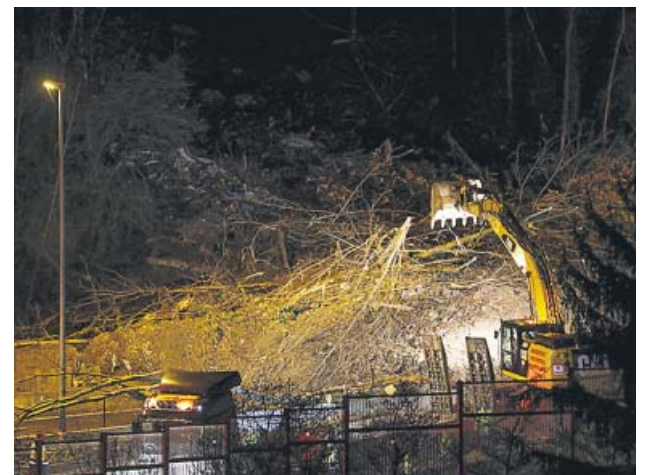
Maquinaria trabajando en la zona del desastre.

Un hombre de 75 años murió la noche del pasado miércoles en el barrio de La Palmilla (Málaga), tras recibir una bala perdida de un tiroteo entre clanes. La Policía detuvo a seis personas por su supuesta implicación e investiga la muerte del anciano.