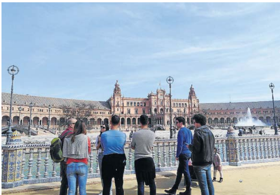
Un grupo de visitantes atiende las explicaciones de una guía turística en la plaza de España. B. R.

LAMENTAN también la temporalidad y parcialidad del empleo, sobre todo entre las mujeres