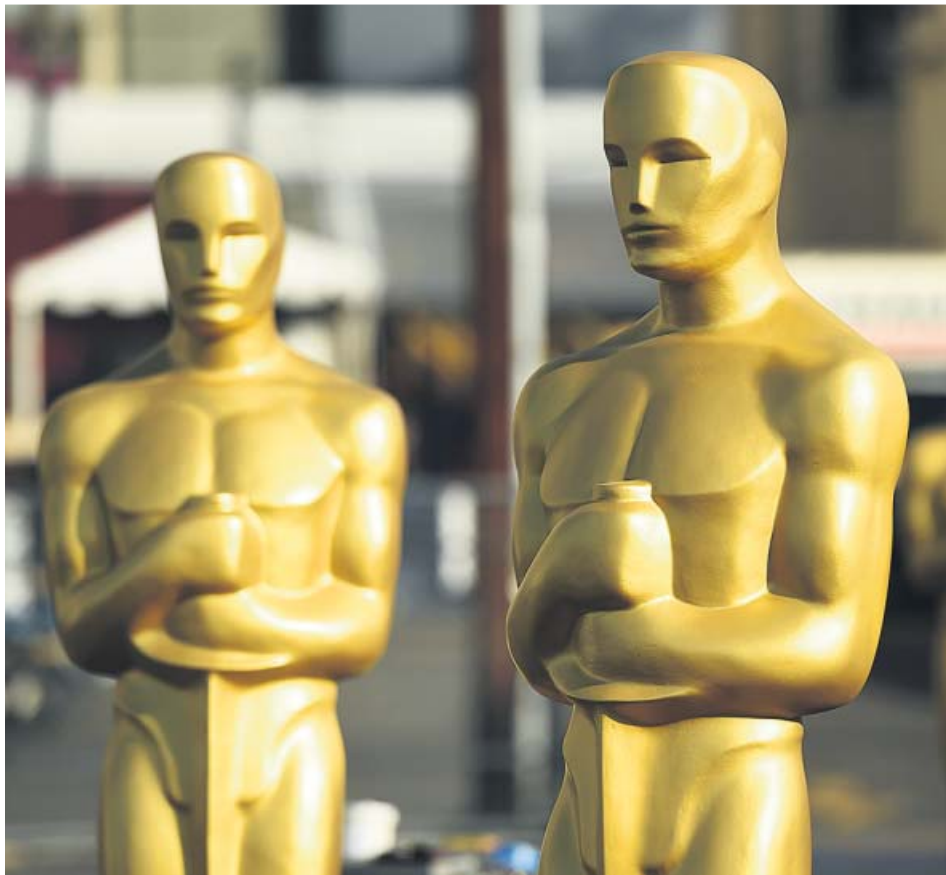
La ceremonia de los Óscar se celebra en el Dolby Theater de Los Ángeles (EE UU).

Los premios más famosos del cine se entregan el domingo. Hay nueve aspirantes a mejor película y 'Dolor y gloria' y 'Klaus' intentarán traerse una estatuilla a casa