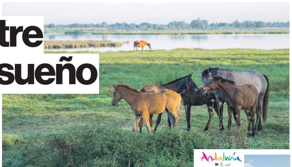
Arriba, caballos marismeños en Charco de la Boca, dentro de Doñana. A la derecha, las carreras de caballos de Sanlúcar de Barrameda. JUNTA DE ANDALUCÍA

A estas se suman muchas más. Existen rutas que exploran vertientes arquitectónicas, como la que avanza desde La Cartuja hasta Jerez de la Frontera y descubre en su avance grandes emblemas de la campiña jerezana; y otras que discurren entre comarcas cerealistas y oliveras a la vera izquierda del Guadalquivir. Pueblos de costumbres, vuelos de aves protegidas y horizontes únicos que se des-