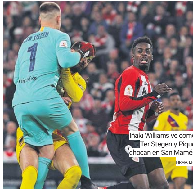
Iñaki Williams ve como Ter Stegen y Piqué chocan en San Mamés