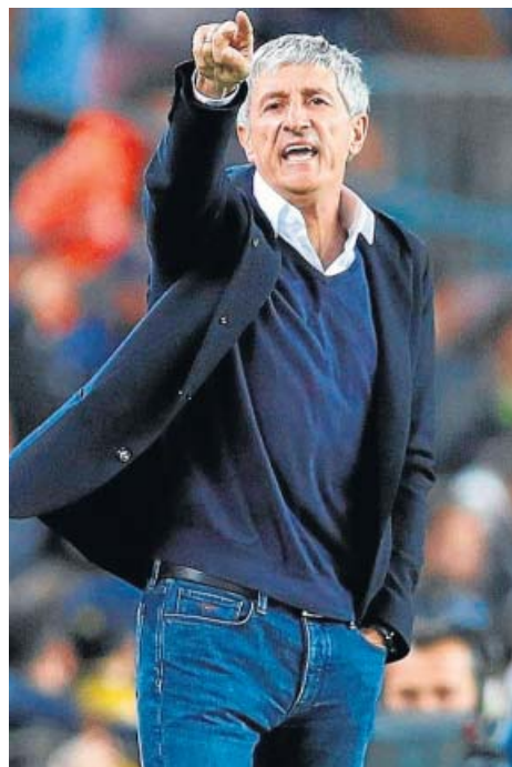
Rubi (izq.) y Quique Setién (dcha.), duelo con morbo en los banquillos del Benito Villamarín.