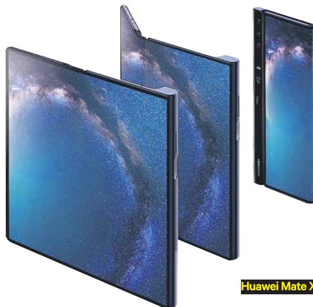
Huawei Mate X

Por otro lado, ZTE ha desvelado los detalles del inminente Axon 10s Pro, Xiaomi prevé lanzar múltiples terminales con 5G este año y se confía en que el gigante Apple dé el paso en su nueva generación de iPhone. ●