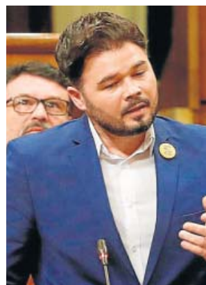
El portavoz de ERC en el Congreso, Gabriel Rufián.

espinosa que permitió al presidente desgranar algunas de las medidas que plantea: la reforma de la ley de Memoria Histórica, el aumento de la financiación para las exhumaciones de fosas de víctimas del franquismo, la retirada de los reconocimientos a funcionarios franquistas como Billy el Niño e, incluso, la revisión del juicio en