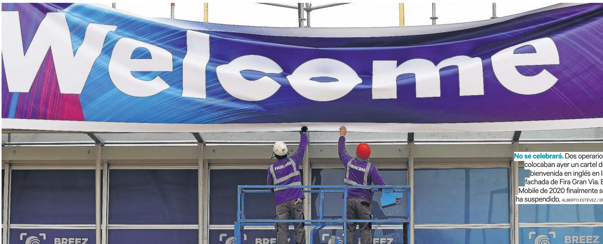
No se celebrará. Dos operarios colocaban ayer un cartel de bienvenida en inglés en la fachada de Fira Gran Via. El Mobile de 2020 finalmente se ha suspendido.