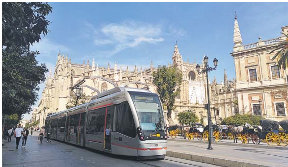
El Metrocentro, a su paso por la Avenida de la Constitución. B. R.

El Consejo de Gobierno de la Gerencia de Urbanismo aprobó ayer definitivamente el plan especial, que ahora tendrá que ser ratificado en el Pleno del Ayuntamiento. El grupo municipal de Cs, que ya anunció hace unos días su intención de desbloquear el proyecto, mantuvo ayer su apoyo a la iniciativa del alcalde, Juan Espadas, cambiando así su voto en contra de diciembre de 2018, cuando la oposición en bloque mandó al cajón la ampliación del Metrocentro. «Cs cumple con lo que promete», manifestó su portavoz, Álvaro Pimentel, que aseguró que dan su apoyo «por Sevilla y por los sevillanos, y porque es posible ser oposición y ser útiles a los intereses de los ciudadanos». El PP y Vox, que en las últimas semanas se han mostrado contrarios al proyecto de ampliación, se abstuvieron, mientras que Adelante Sevilla, que con su apoyo permitió la aprobación del presu-