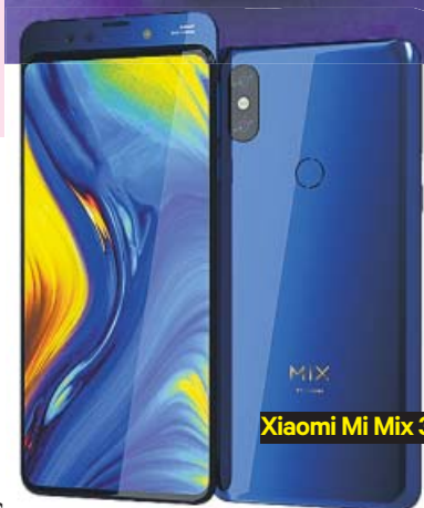
Xiaomi Mi Mix 3

En el universo Xiaomi figuran el Xiaomi Mi 9 Pro y el