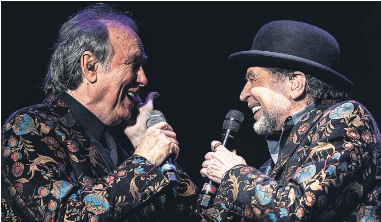
Sabina y Serrat, durante el concierto que ofrecieron el martes en Madrid en su gira No hay dos sin tres .