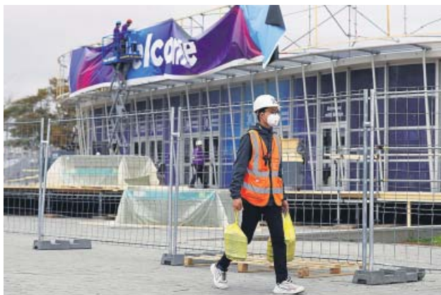
Últimos preparativos antes de conocer la cancelación.

28.000 habitaciones estaban reservadas por los congresistas. Los restaurantes y el transporte son otros sectores afectados