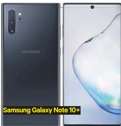
Samsung Galaxy Note 10+

La conectividad 5G constituye una tendencia tecnológica al alza, si bien su potencial se alcanzará a medio plazo. Hay muchos modelos que ya lo soportan