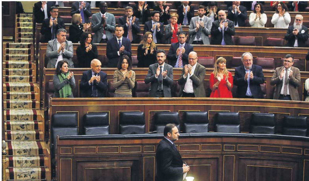
El ministro de Transportes, José Luis Ábalos, es aplaudido por el grupo socialista en el Congreso.

Fueron varios los diputados del PP que cuestionaron a Ábalos al respecto. La primera fue María Valentina Martínez, que acusó al ministro de «mentiroso» y de poner en riesgo la «credibilidad de España» por reunirse con alguien «que tiene sanciones por violaciones de los derechos humanos». Pero no fue la única: su compañera Belén Hoyo espetó al ministro que