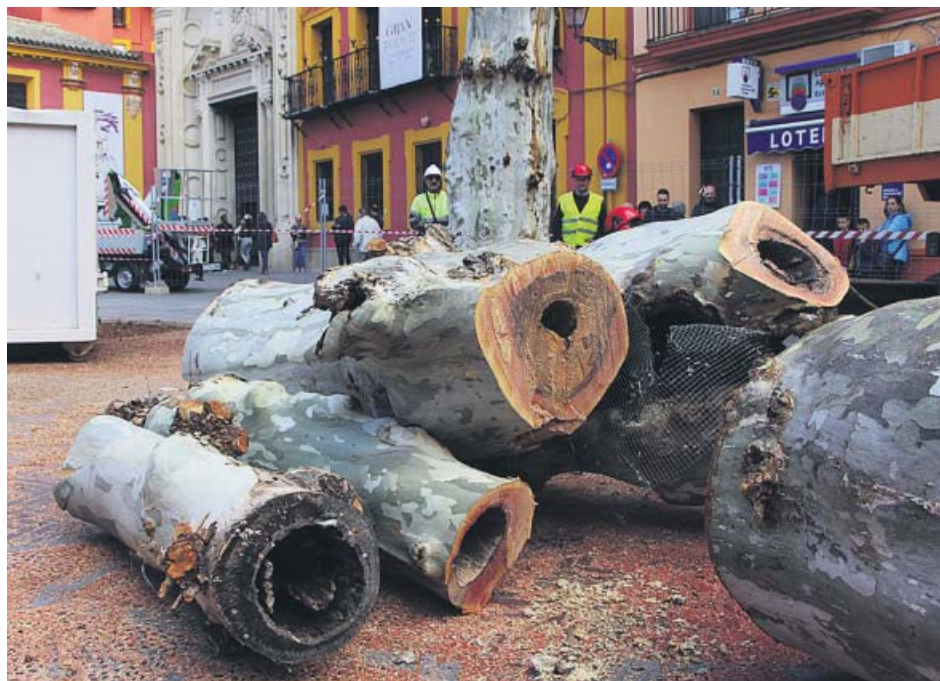
Los plátanos de sombra talados en la céntrica plaza de San Lorenzo.

Adelante Sevilla llamó ayer a apoyar la «reivindicación histórica del movimiento andalucista» para que el aeropuerto Sevilla-San Pablo sea rebautizado como Blas Infante, padre de la patria andaluza.