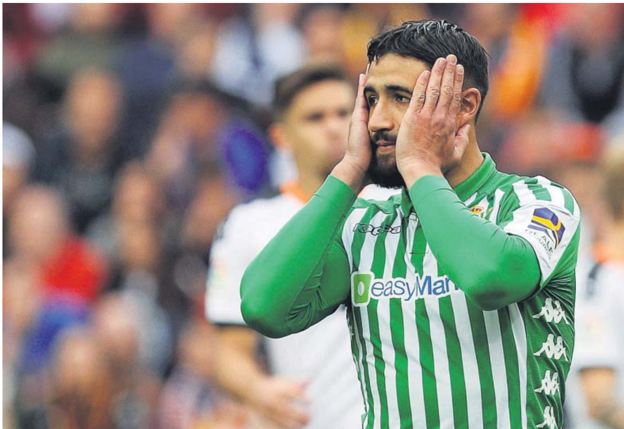
Nabil Fekir, delantero del Real Betis, se lamenta de una ocasión fallada ante el Valencia.