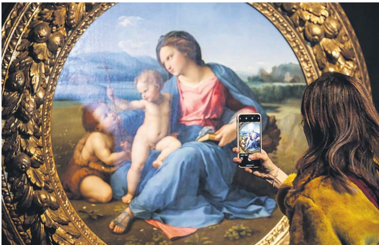
Una mujer fotografía en la exhibición el cuadro 'Madonna d'Alba', del pintor Rafael.

Preocupación por el empeoramiento de la salud de la madre de nuestra folclórica más importante. En los últimos días ha sufrido un bajón del que creen que no se recuperará. ●