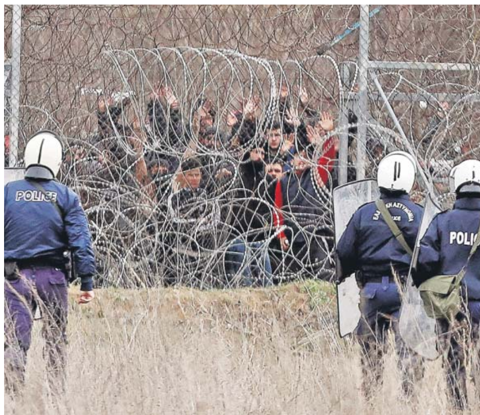
Policías griegas en la frontera con Turquía donde miles de refugiados esperan para cruzar.

Desde el Gremio de Restauración aseguraron ayer a este diario que la norma «regula algo ya está haciendo y está muy arraigado en los restaurantes» pero que complica las cosas «a los locales más pequeños o empresas débiles» y a un sector que está «cargado de normas y de inspecciones» y piden ayudas para los pequeños locales. ● P. CARO