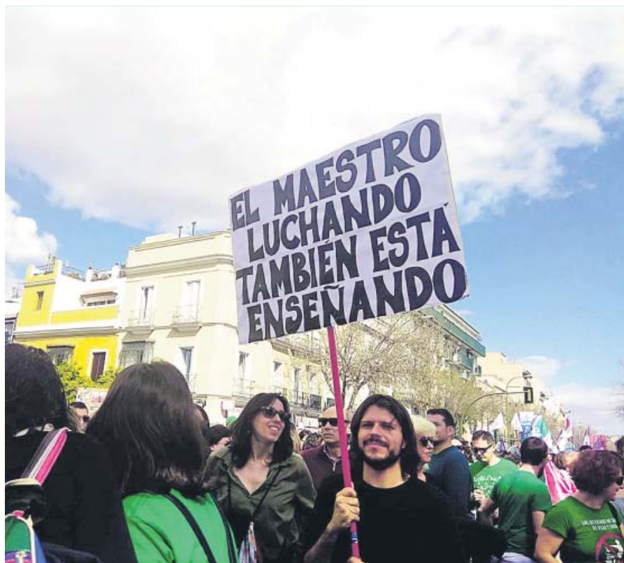
Uno de los asistentes a la manifestación de ayer en Sevilla.