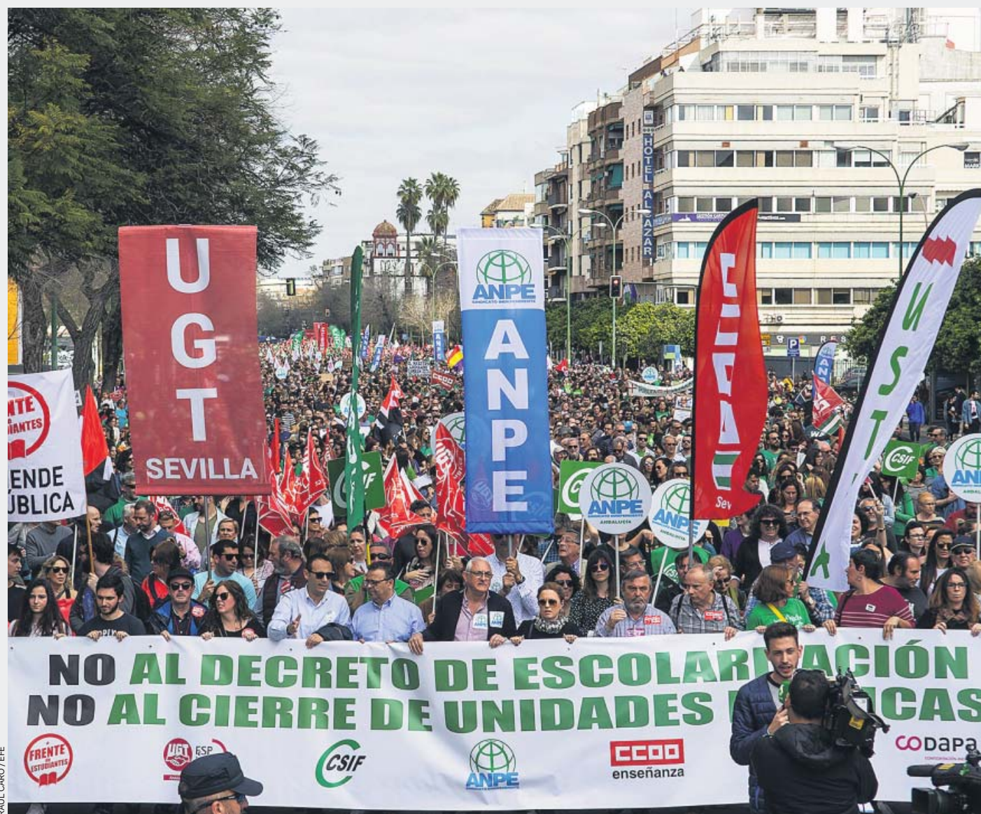
RAÚL CARO / EFE

LA HUELGA GENERAL NO FRENA EL DECRETO EDUCATIVO ANDALUZ