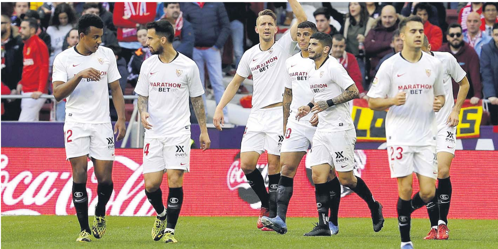
Los jugadores del Sevilla celebran el gol de Luuk de Jong en el Wanda Metropolitano.