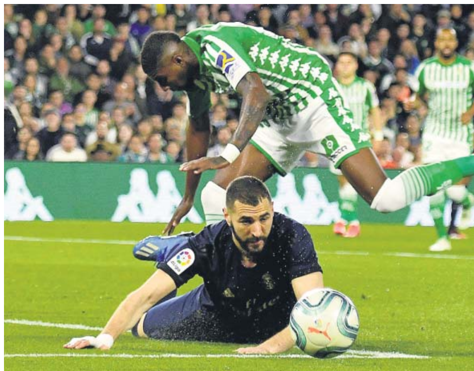
El madridista Karim Benzema lucha con el brasileño Emerson Royal, del Real Betis.