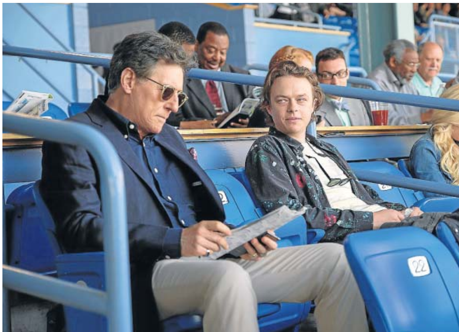
Gabriel Byrne y Dane DeHaan, protagonistas de 'ZeroZeroZero'.

Adaptando el libro homónimo de Roberto Saviano ('Gomorra'), 'ZeroZeroZero' muestra al tráfico de cocaína como verdadero motor de la economía global