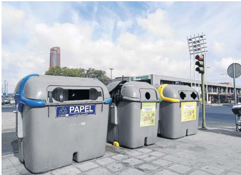
Contenedores de recogida selectiva en el entorno de Plaza de Armas. B.R.

Además de en estos contenedores, Lipasam recoge residuos de forma selectiva en los 14 nuevos Ecopuntos distri-