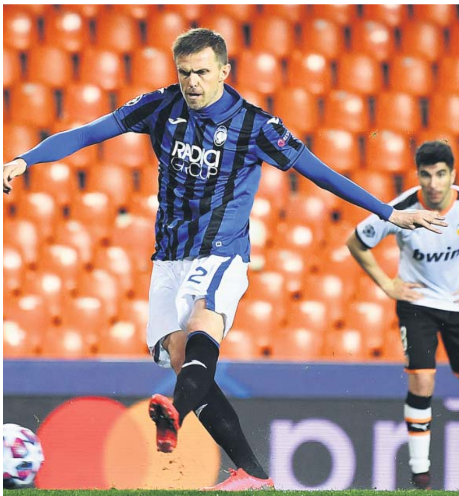
Josip Ilicic, héroe ayer del Atalanta con cuatro goles, marca en un Mestalla vacío.

Nunca dejó de intentarlo el Valencia, que echó mucho de menos el calor de su público. Hacían falta cuatro goles y el