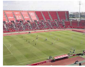
Mallorca-Barcelona Sábado, 18.30