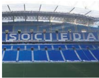
R. Sociedad-Osasuna Domingo, 14.00