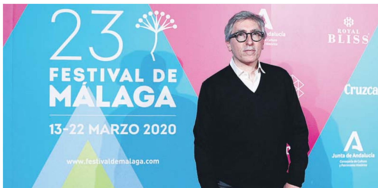
El escritor y cineasta David Trueba iba a presentar en el Festival de Málaga su película A este lado del mundo .