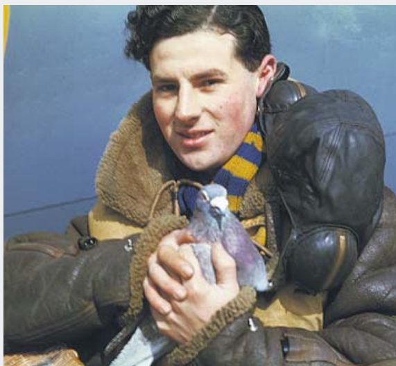
Un piloto sujeta a una paloma mensajera.