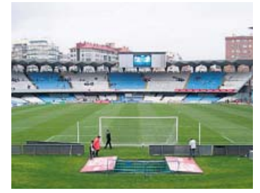
Celta-Villarreal Sábado, 21.00