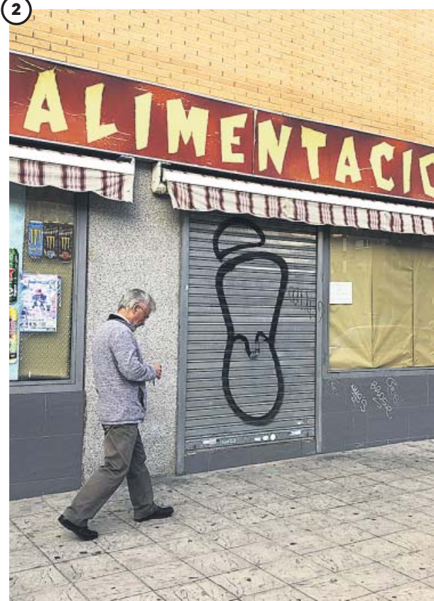
Los comercios chinos echan el cierre temporalmente Desde hace varios días, tiendas y restaurantes chinos han echado el cierre y han dejado escuetos carteles en los que avisan de que el negocio está clausurado por vacaciones.