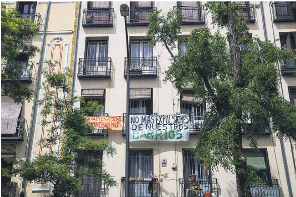
Viviendas amenazadas por desahucios en el madrileño barrio de Lavapiés. ELENA BUENAVISTA

El Gobierno amplía la moratoria de los desahucios e incluye a los padres y madres solos con un hijo como población vulnerable