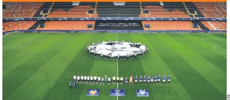
EL DEPORTE ESPAÑOL, 2 SEMANAS A PUERTA CERRADA P. 10