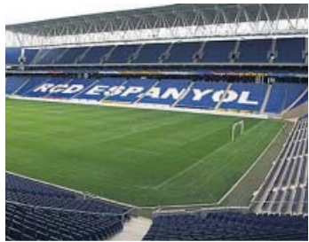
Espanyol-Alavés Domingo, 12.00