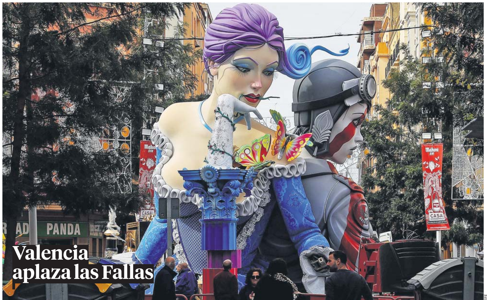
Valencia aplaza las Fallas

Vivimos un momento grave. El mundo afronta la crisis sanitaria más dura de este siglo y España, lejos de escapar, está entre los lugares más afectados. Nuestro sistema sanitario afronta una ardua prueba, nuestro día a día ha cambiado y la crisis económica puede ser muy lesiva. Lo que viene no va a ser fácil. El mensaje de Sánchez apunta a esa rotundidad: «Haremos lo que haga falta, cuando haga falta y donde haga falta». Hubo crudeza, pero también un mensaje alentador: «Juntos superaremos esta crisis». Ahora, a trabajar para conseguirlo. ●