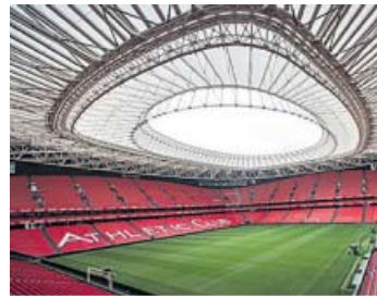
Athletic-Atlético Domingo, 16.00