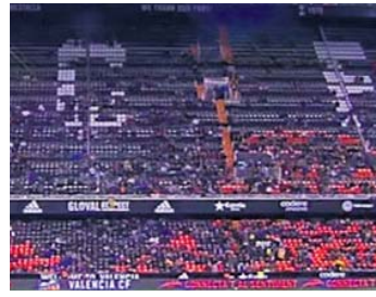
Valencia-Levante Sábado, 16.00