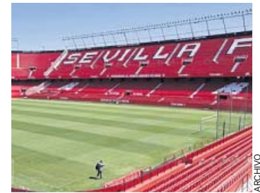
Sevilla-Betis Domingo, 21.00