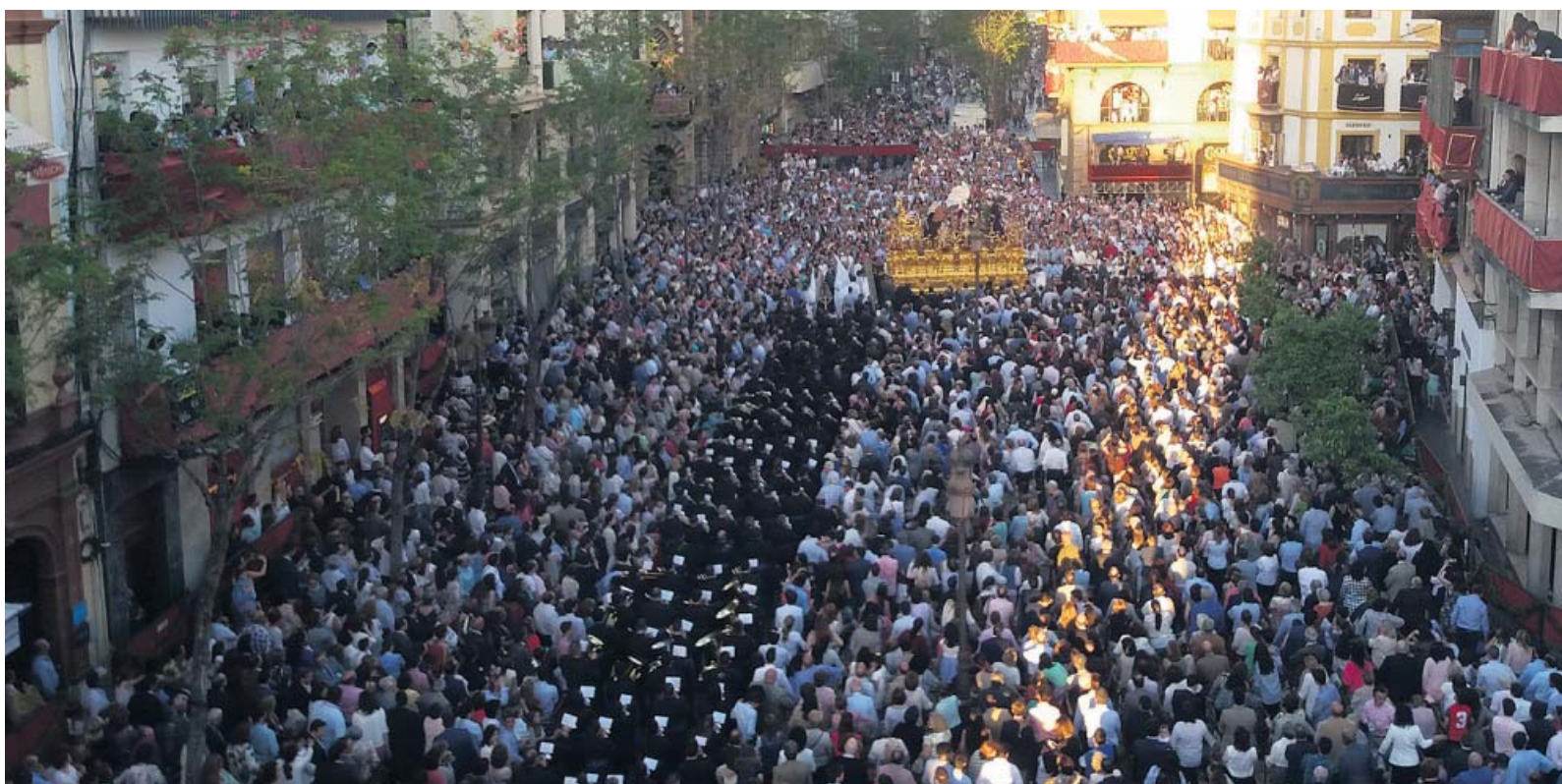
Paso de Nuestro Padre Jesús en su Soberano Poder ante Caifás, de la hermandad de San Gonzalo, a su paso por la Campana.

La Universidad Pablo de Olavide iniciará una investigación para esclarecer el origen de un falso comunicado que circula online sobre el cierre de la institución por el coronavirus. «Es rotundamente falso», afirmó.