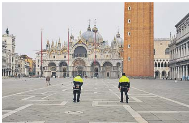
Arriba, dos chicas pasean por Nueva York con mascarilla. Abajo, Venecia completamente vacía a causa del virus.

drán ingresar en el país salvo que presenten un certificado de salud o accedan a permanecer aislados al menos durante 14 días. Eslovenia también cerró su frontera con Italia.