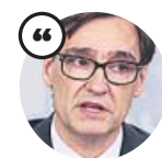
SALVADOR ILLA Ministro de Sanidad

«Todas las personas en aislamiento preventivo se considerarán en situación temporal de baja laboral»