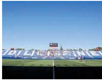
Leganés-Valladolid Sábado, 13.00