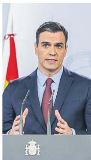
El presidente del Gobierno, ayer en Moncloa.

Sobre el aspecto económico, Sánchez avanzó medidas para facilitar la liquidez de las pymes o ayudas a las familias para «conciliar» en los lugares donde se han cerrado los colegios. Más allá de eso, admitió que no hay manera de saber qué consecuencias económicas tendrá el coronavirus. «Ahora mismo no hay ningún organismo internacional que pueda evaluar el im-