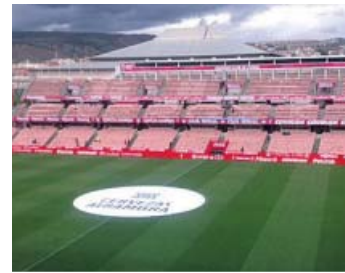
Granada-Getafe Domingo, 18.30