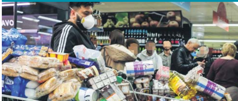
COLAS EN MADRID POR MIEDO A LAS CUARENTENAS