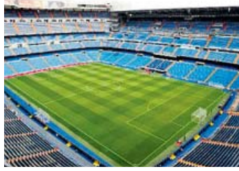
Real Madrid-Eibar Viernes, 21.00