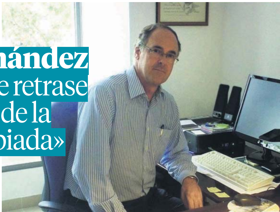
UNIVERSIDAD MIGUEL HERNÁNDEZ DE ELICHE

El portavoz de la Sociedad Española de Salud Pública y Administración Sanitaria valora las acciones puestas en marcha contra el Covid-19