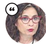
MARÍA JESÚS MONTERO Ministra de Hacienda y portavoz del Gobierno

«Si los progenitores tienen que quedarse al cuidado, que no perjudique su desarrollo personal o profesional»