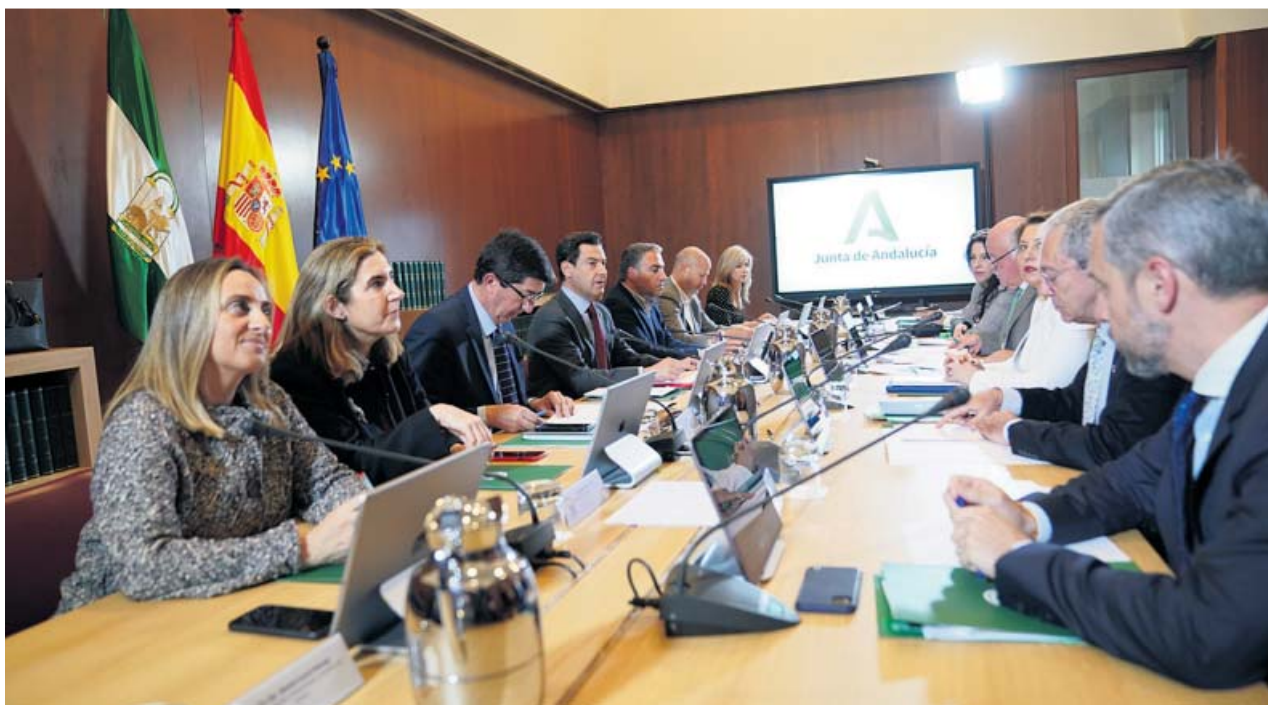
Reunión del Comité para el Control de Situaciones Especiales por el coronavirus, ayer.