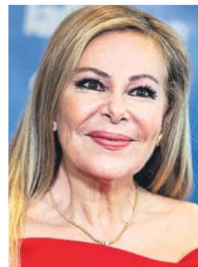
La actriz y presentadora Ana Obregón.

Estaba muy emocionada. Sus mensajes anunciando el regreso a los escenarios habían conseguido dibujar sonrisas esperanzadoras en aquellos que estábamos preocupados. Ana Obregón volvía al teatro para encarnar un papel protagonista junto a Andoñi Ferreño. No podrá ser. Hace pocos días, la actriz comunicaba al equipo directivo que no podría incorporarse.