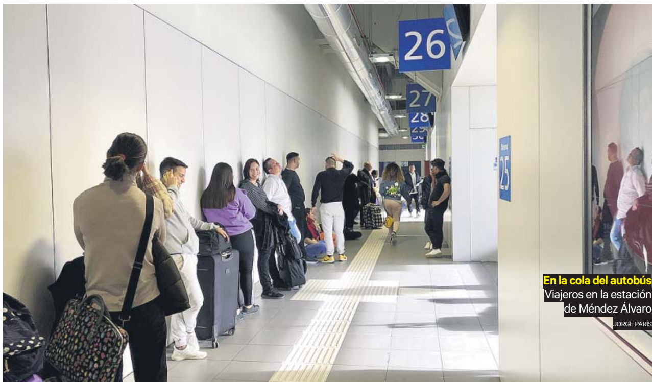
En la cola del autobús Viajeros en la estación de Méndez Álvaro

Los colegios mayores se han mantenido abiertos, salvo el Loyola, que decidió suspender temporalmente su actividad desde ayer durante 15 días, llevando a los 200 universitarios que residen en sus instalaciones a volver a sus casas. ●