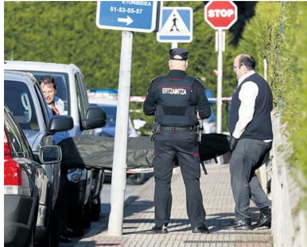
Personal funerario traslada los cadáveres de las víctimas.

Los vecinos de Abanto se mostraron «asombrados» an-