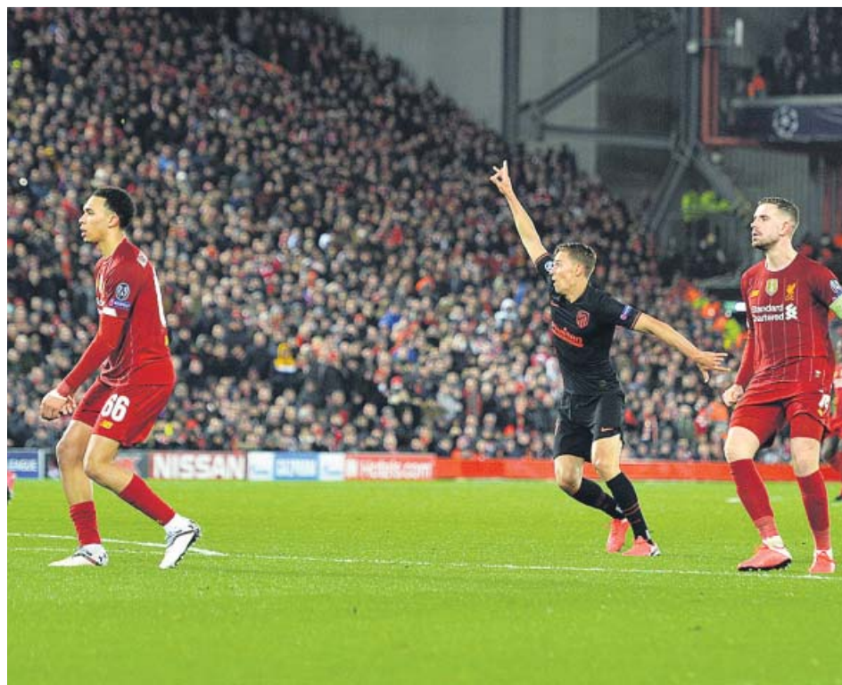
Marcos Llorente celebra uno de sus goles ayer en Anfield.

Un cabezazo de Wijnaldum y un remate de Salah fueron los