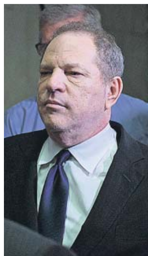
Weinstein, en una imagen de 2018.

Antes de escuchar su sentencia, Weinstein dijo ante el tribunal que estaba «profunda-