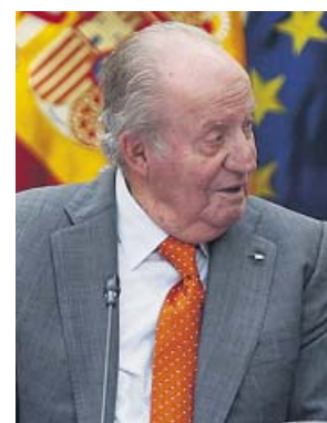
El rey Juan Carlos I, en una imagen de archivo.

Por otro lado, el Código Civil refleja que no se puede renunciar legalmente a una herencia paterna en vida, solo se