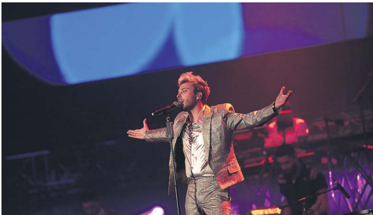
Blas Cantó era el artista seleccionado para representar a España en Eurovisión 2020.

El presentador, al que vincularon con un concursante del televisivo y popular reality de supervivencia, está esperando a que el protagonista confirme el bulo para lanzarse a interponer las acciones legales que considere. ●