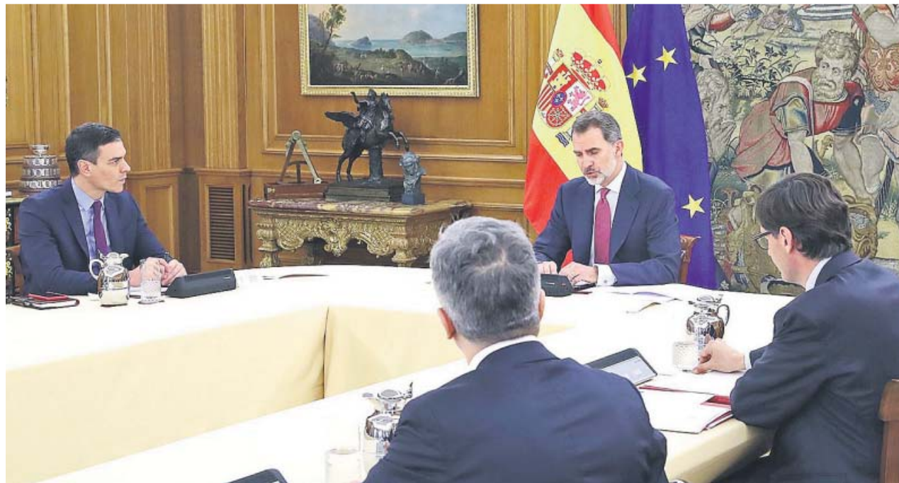
El rey Felipe VI, reunido ayer en Zarzuela con Pedro Sánchez y el Comité de Gestión Técnica del coronavirus.

«Es el momento de resistir y tenemos que adaptar nuestros modos de vida a las indicaciones de autoridades y expertos para ganarle al virus. Todos debemos contribuir al esfuerzo colectivo con nuestras acciones por pequeñas que sean», dijo.