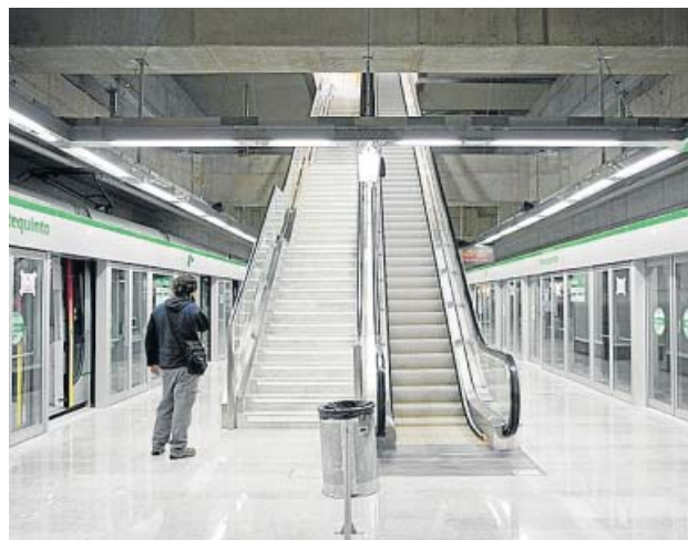
Fotografía de archivo de una estación de metro.

Así, desde hoy, se reincorporan todos los trabajadores de Tussam afectados por el ERTE, se refuerzan de nuevo las horas punta y se aumenta la capacidad de los vehículos dentro de las recomendaciones sanitarias. Los autobuses de diez metros tendrán capacidad para 25 personas; los de 12 metros