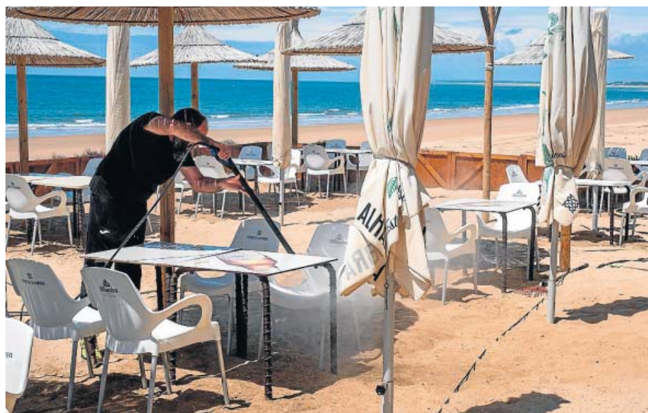
Un trabajador prepara una terraza en Punta Umbría, Huelva.

LA FASE 1 permite la libre circulación dentro de la misma provincia o reuniones de diez personas