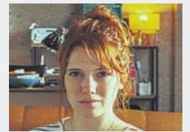
La actriz interpreta a Valeria en la serie de Netflix.

Diana Gómez «Yo hace un año estaba sin dinero y sin trabajo»