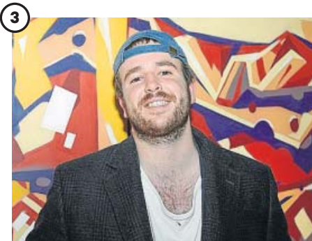
Activo hasta el final El joven permaneció activo casi hasta el final, trabajando y acudiendo a diferentes actos mientras la salud se lo permitió. En la imagen, durante un evento en abril de 2019.