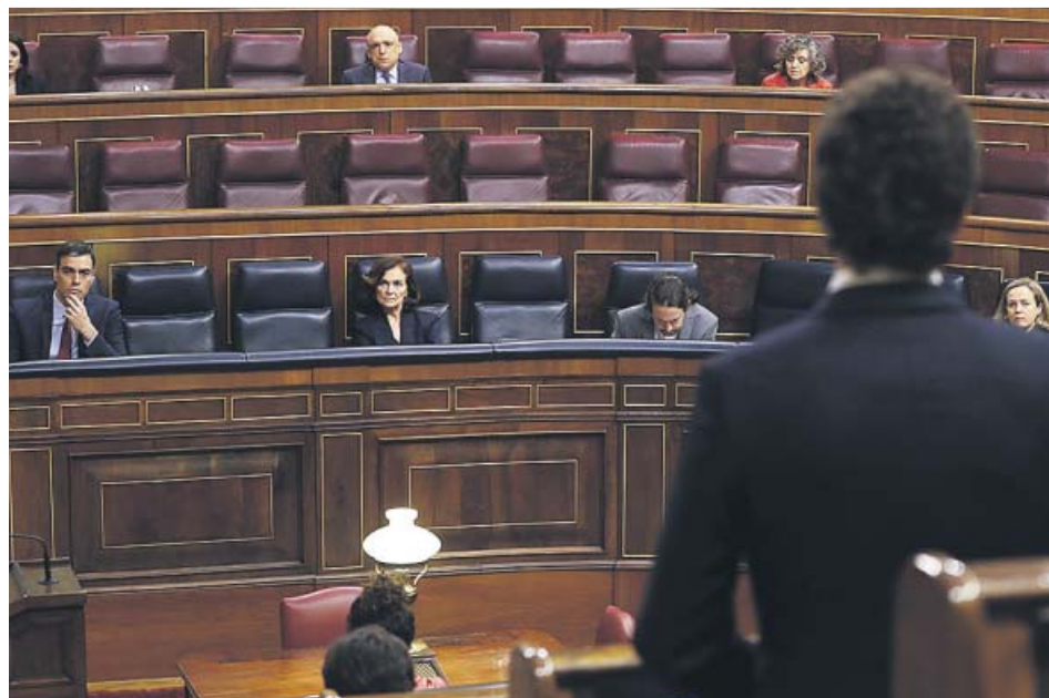
El presidente Sánchez y sus vicepresidentes, durante una intervención de Casado en el Congreso.

Casado preguntó a Sánchez si la crisis del coronavirus obligará a España a «pedir el rescate» a la UE y «cuánto costará» a los ciudadanos. Y esa cuestión le sirvió para trazar un paralelismo entre la forma de afrontar la crisis económica de 2008 por parte de Zapatero y la que está llevando a cabo Sánchez en 2020. «Hemos pasado de los brotes verdes a la V asimétrica, de la Champions League de la economía a la gama alta de éxito, del Plan E al escudo social: es la misma propaganda en