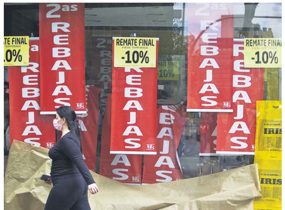
Una mujer con mascarilla pasa por delante de una tienda que anuncia rebajas. JORGE PARÍS

Este oncólogo se encuentra ya plenamente incorporado a su trabajo: «Habitualmente la PCR se repite a los catorce días pero como tenía tan pocos síntomas volvieron a hacérmela a los diez y ya había negativizado. En el momento en el que estábamos, la necesidad de reincorporación era relativamente acuciante». Ya han empezado a notar un descenso en la presión del hospital, pero han pasado por un momento excepcional: «Nunca jamás habíamos vivido una cosa como esta. Nunca habíamos tenido una cantidad de pacientes tan grande. Cuando estás dentro te das cuenta de la trascendencia de esta infección». ●