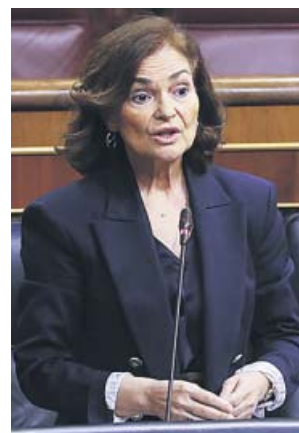
La vicepresidenta primera del Gobierno, Carmen Calvo.

El Gobierno muestra así coherencia con su afirmación de que la actual legislación no permite tomar medidas como las actualmente vigentes sin el estado de alarma. Y, por ello, aboga por «una reforma sanitaria de algunos elementos