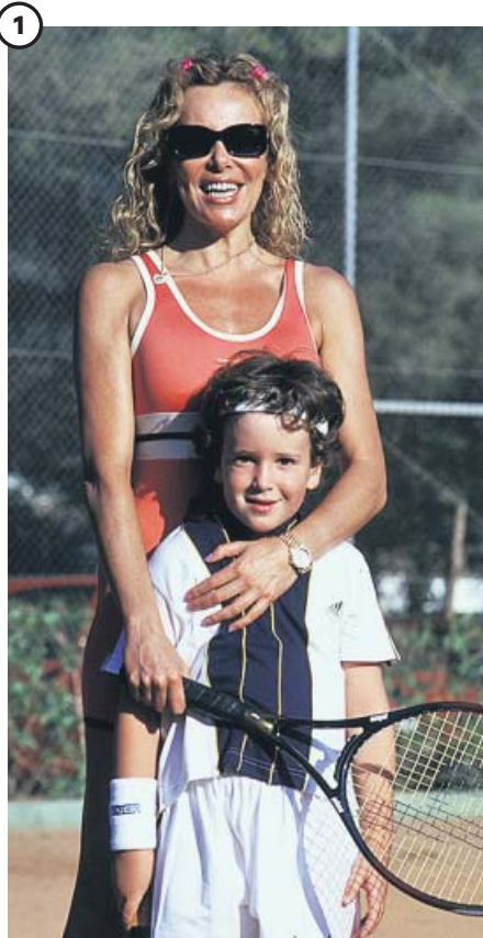
Madre incondicional «Mi hijo me ha dado una lección de vida», ha dicho la presentadora y actriz Ana Obregón varias veces en los últimos meses. En la imagen, madre e hijo posan en una pista de tenis en 1998.