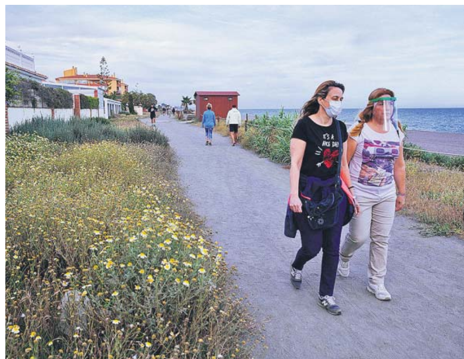
Dos mujeres pasean junto a una de las playas de Rincón de la Victoria (Málaga).

Aguirre aseguró ayer que de las 1.107 residencias de mayores que hay en la comunidad, 840 están «libres de coronavirus», mientras que 23 continúan en fase de medicalización. Además, anunció que la Junta quiere integrar de forma definitiva estas instalaciones en el abordaje sanitario dentro del sistema público de salud.