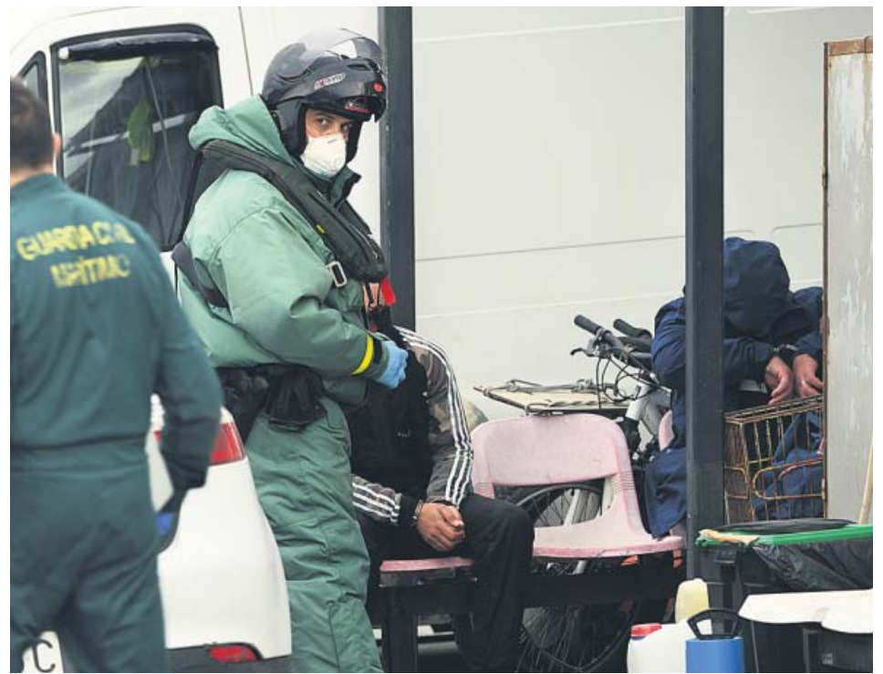
Guardias civiles protegidos contra el coronavirus en Ceuta.

casos totales se han confirmado desde que hay datos. La nueva cuenta de Sanidad vuelve a incluir de nuevo resultados de algunos test serológicos.