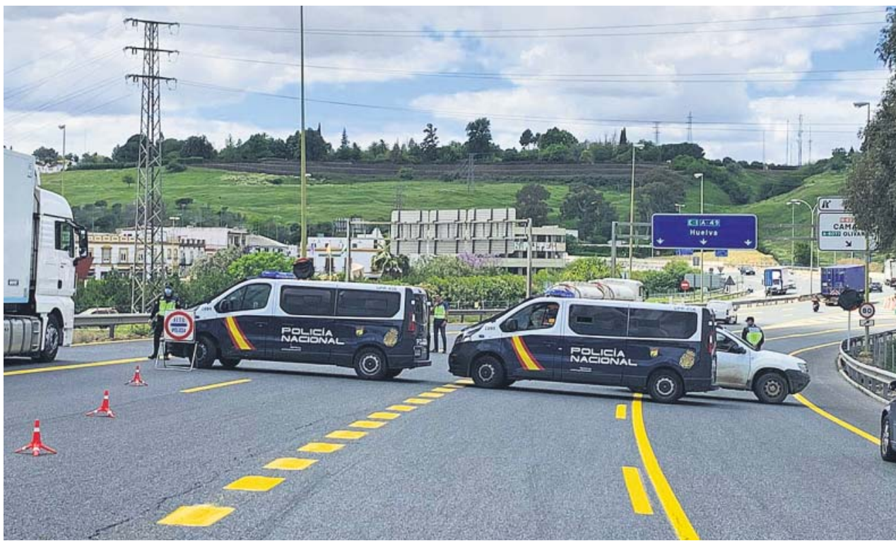
Control de la Policía Nacional a la salida de Sevilla en la A-49. SUBDELEGACIÓN DEL GOBIERNO