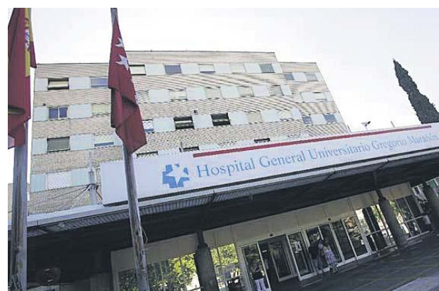
El Hospital Gregorio Marañón de Madrid desarrolla el estudio.

«Si esto se confirma, justificaría la posibilidad de utilizar estos fármacos de manera preventiva en personas de riesgo, como los trabajadores sanitarios o personas que tienen contacto con enfermos de Covid», declara el consultor en enfermedades infeccio-