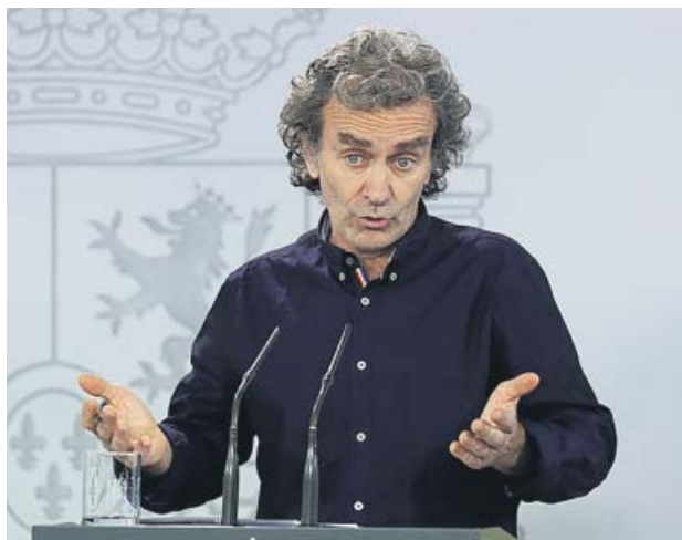
Fernando Simón, durante su comparecencia de ayer.

Tras conocerse que la acusación pedía incluirle en la causa por el 8-M, cuya investigación en un juzgado de Madrid ha causado todo un terremoto político en el seno del Ministerio