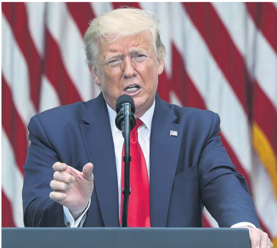
El presidente de EE UU, Donald Trump, da un discurso en la Casa Blanca.

La puesta en duda de la veracidad de dos tuits del presidente ha desatado su furia contra la red social