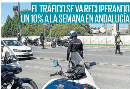
DELEGACIÓN DEL GOBIERNO

El Consejo de Ministros aprueba hoy la puesta en marcha del Ingreso Mínimo Vital, que se empezará a cobrar a partir de junio. La previsión es que puedan acceder a esta ayuda unos 850.000 hogares. De estos, unos 100.000 podrán recibirla de forma directa, al tener ya verificado que cumplen los requisitos.