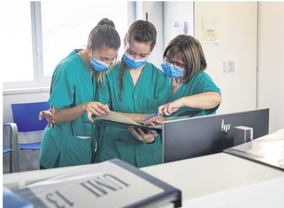
Personal sanitario en la unidad polivalente de críticos en el Hospital de Logroño.