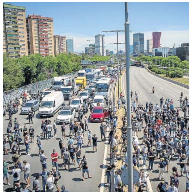
Algunos trabajadores de Nissan quemaron ayer neumáticos en la planta de la Zona Franca de Barcelona y cortaron el tráfico en el exterior.