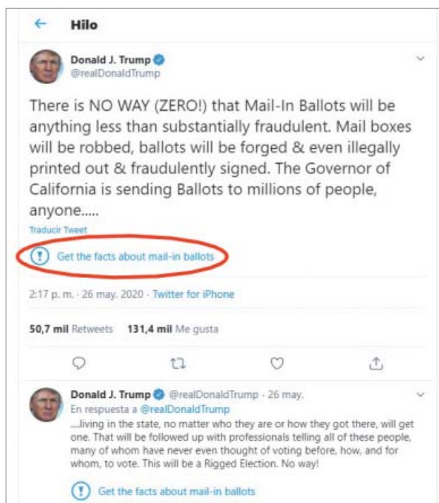
Dos tuits de Trump cuya veracidad fue puesta en duda.

Este martes, esa red social publicó un enlace y una alerta