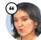
REYES MAROTO Ministra de Industria

«Nosotros seguimos tendiendo la mano a Nissan porque creemos que el cierre de la planta es la peor solución»