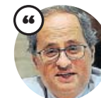
QUIM TORRA Presidente de la Generalitat

«Combatiremos esta amenaza con toda la determinación. Haremos todo lo que esté en nuestra mano»