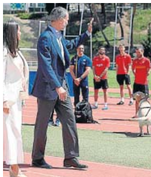
Los Reyes, ayer durante la visita al CAR.

Felipe VI lanzó este mensaje durante la visita que realizó junto a doña Letizia al centro de Alto Rendimiento del Consejo Superior de Deportes (CSD), su primer acto