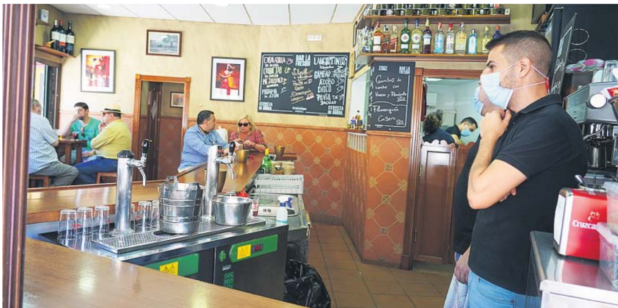
Dos clientes toman algo en la barra de un bar del centro de Sevilla bajo la supervisión de los camareros.

LA FASE 3 permite el consumo en el mostrador manteniendo la distancia entre clientes LOS HOSTELEROS avanzan que esta misma semana abrirán todas las terrazas de verano