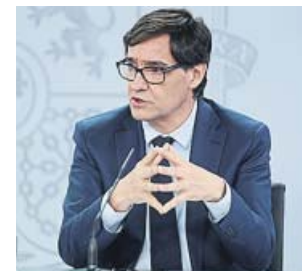
Salvador Illa. EFE

si una persona que haya asistido a cualquiera de las manifestaciones» antes del estado de alarma decretado el 14 de marzo y que resultara infectado por el Covid-19 «lo haya sido en esas concentraciones