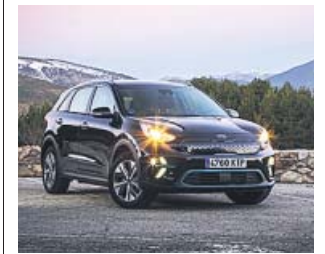
El e-Niro es uno de los modelos eléctricos de Kia.

Como la adquisición de modelos eléctricos o híbridos enchufables genera inquietud, Kia ha establecido una serie de compromisos con quienes los compran. Así, además de los siete años de garantía (incluida la batería) disponible para todos los modelos o el mantenimiento gratuito durante los primeros tres años, Kia ofrece la posibilidad de cambiar el coche si durante el primer mes o tras 1.000 kilómetros el cliente no queda satisfecho. Otro compromiso es, si se adquiere un eléctrico, el de disponer duran-