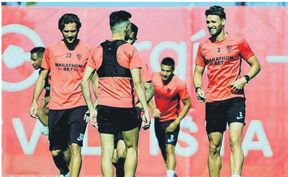
Entrenamiento de ayer del Sevilla.