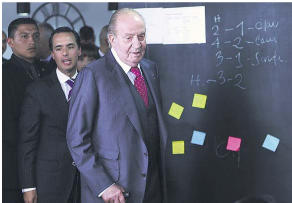
Juan Carlos I, ya emérito, llega a Colombia para asistir a la investidura del presidente Santos.

La causa se enmarca dentro de las diligencias abiertas en diciembre de 2018 por Anticorrupción para aclarar el destino de 80 millones de euros que, según Corinna Larsen, de casada Corinna zu Sayn-Wittgenstein, se habrían repartido —entre otros— el monarca emérito por la ad-