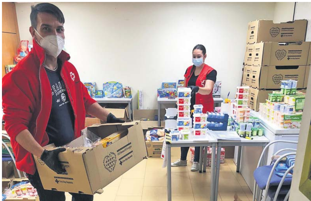
Voluntarios de Cruz Roja organizan en cajas los alimentos que van a repartir a las familias más vulnerables.

En lo que a personal de refuerzo se refiere, el Hospital Universitario Virgen Macarena ha ampliado su plantilla con 242 profesionales de distintas áreas para garantizar la correcta atención y el descanso de los sanitarios. ●