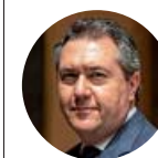
JUAN ESPADAS Alcalde de Sevilla

«Esta crisis es más que nunca una razón para abordar las acciones en materia de emergencia climática»