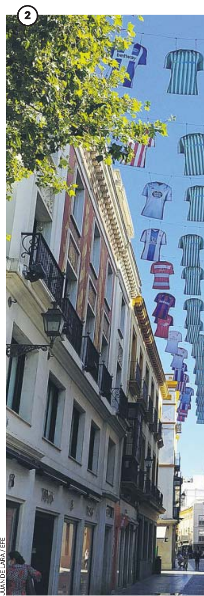
JUANDE LARA / EFE