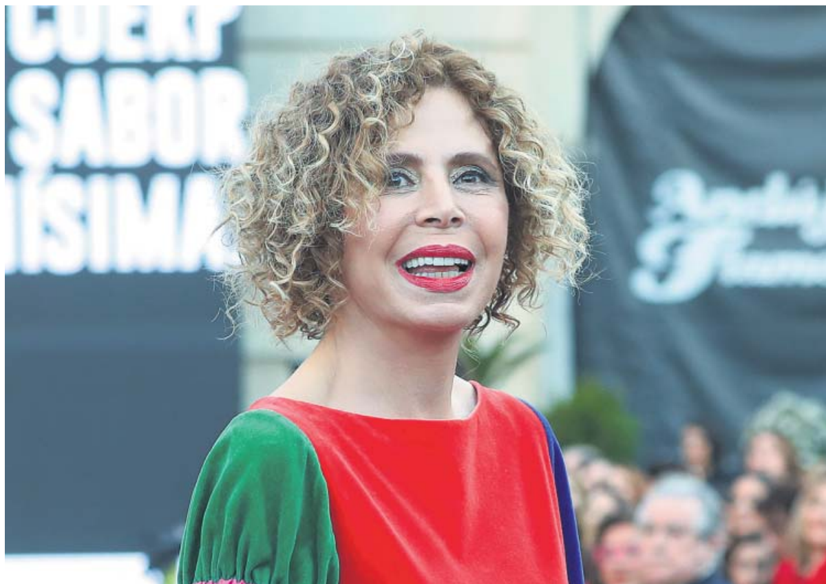
Ágatha Ruiz de la Prada en la pasarela de Andújar Flamenca el pasado mes de febrero.