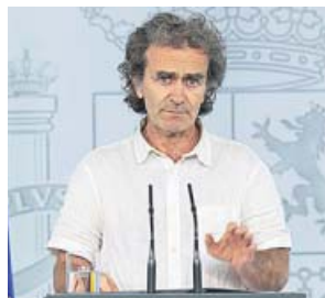
Fernando Simón. EFE

En el mismo documento se dice que «no es posible saber