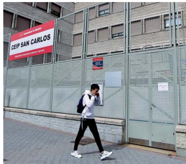
Un colegio de Villaverde (Madrid), en la mañana de ayer.

Desde la FAPA Francisco Giner de los Ríos señalan que las direcciones de los colegios iniciaron el jueves el envío de comunicados a los hogares para