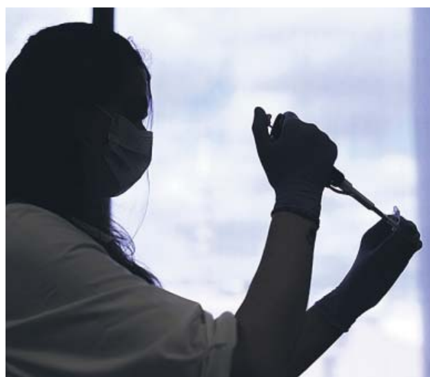
Una sanitaria analiza un test de Covid en un laboratorio.

EL MEDICAMENTO ha permitido reducir la mortalidad entre los pacientes de Covid-19 y es de fácil acceso