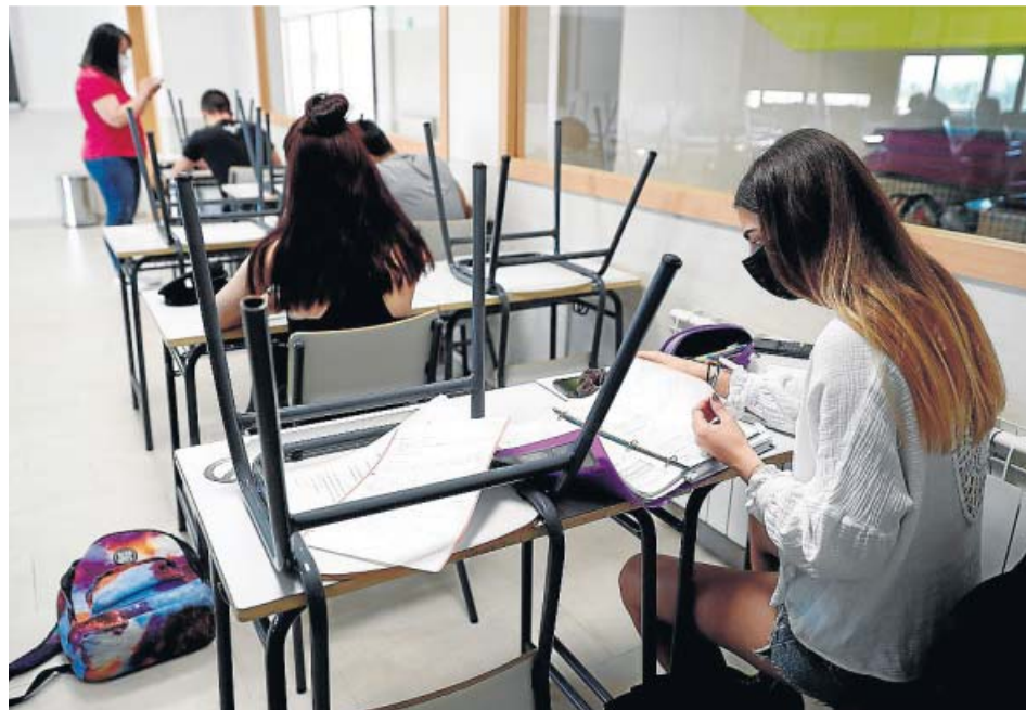
Clases de repaso para la EBAU en el IES Simone Veil de Paracuellos, en Madrid.

A la espera de conocerse qué comunidades se sumarán al