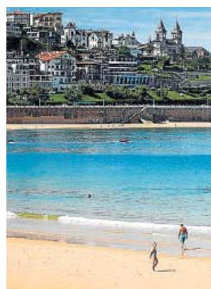
Bañistas en la Playa de la Concha, San Sebastián.

bló por el sector al advertir de que si el Gobierno no ayuda, «las empresas turísticas vamos a aguantar un telediario». El sector pide bonos y programas de incentivos para aumentar la demanda y también un IVA superreducido que el Gobierno tiene descartado. Ayer, la ministra de Industria, Comercio y Turismo, Reyes Maroto, prefirió no