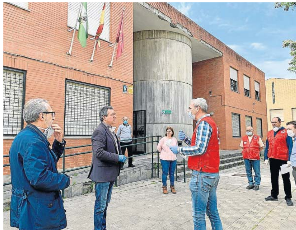
Visita reciente del alcalde, Juan Espadas, a un dispositivo de Cruz Roja.

A esta ampliación del programa alimentario se suman otras iniciativas que el Consistorio desarrollará también durante el verano para las personas más vulnerables, como las actividades socioeducativas para menores, con 1.520 plazas, un programa