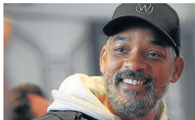
El actor Will Smith, el pasado mes de febrero en Milán.