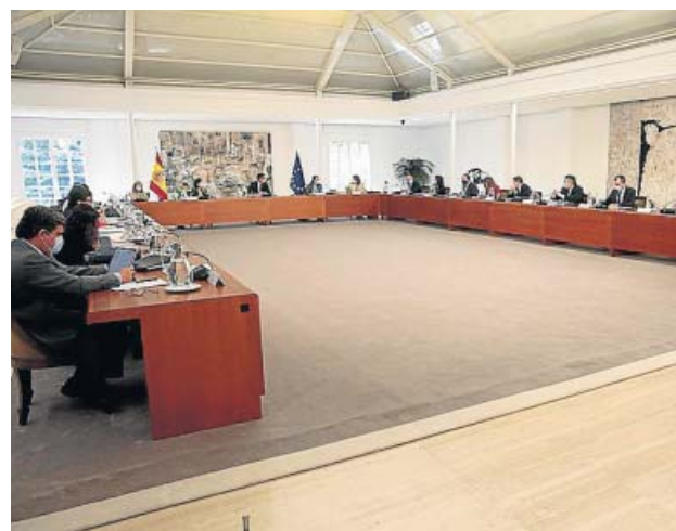
El Gobierno, reunido ayer en el Consejo de Ministros.

Además, el fondo para educación de 2.000 millones se repar-