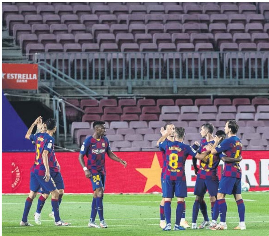
El Barcelona celebra uno de los goles con las gradas vacías del Camp Nou al fondo.

MESSI no faltó a su cita con el gol y lleva 21 en la Liga. Forzó un penalti que él mismo se encargó de meter