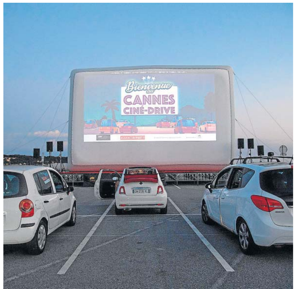
Pase de una película en un autocine de la ciudad francesa de Cannes.

Ante la imposibilidad de celebrarlo, la organización ha decidido difundir la lista de unas 60 películas, una cuarta parte dirigidas por mujeres, que hubieran estado en la competición oficial y el resto de secciones. Para Thierry Frémaux, el delegado general del festival, «un festival online de cine no es un festival». Así que las películas podrán verse en otros festivales, como Toronto, Telluride, San