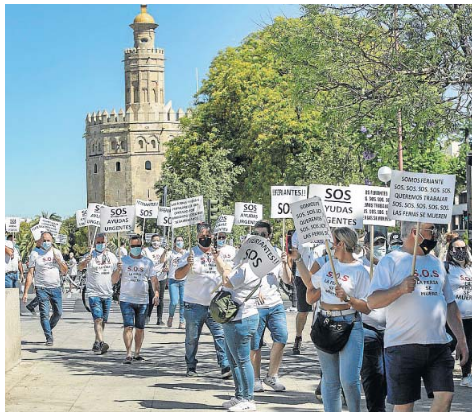
Un grupo de feriantes, durante la manifestación de ayer en Sevilla.

Los feriantes andaluces volvieron ayer a manifestarse en Sevilla para reclamar la oportunidad de regresar al trabajo, justo el día en el que la Junta insistió de nuevo en su recomendación a los ayuntamientos de no celebrar ferias ni romerías en julio y agosto. Entre otras medidas, el sector, «que solo en Andalucía da trabajo a más de 8.000 personas entre empleos directos e indirectos», reclama a los consistorios a «hacer parques con sus medidas de seguridad para poder montar las atracciones». Las movilizaciones se llevarán a cabo en otras provincias andaluzas y en Madrid. ● R.S.