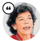
ISABEL CELAÁ Ministra de Educación y Formación Profesional

«La digitalización es un factor muy importante para que todo el alumnado tenga acceso al contenido educativo»