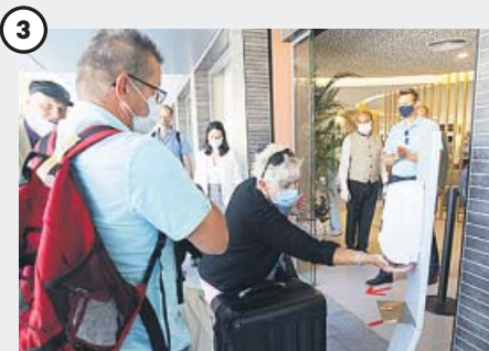
3 En los hoteles, con precaución Los establecimientos hoteleros se han preparado para la 'nueva normalidad' de tal forma que se fomente el «turismo seguro». Desinfectantes y mascarillas son parte de la rutina.

que eliminarán las medidas de cuarentena cuando vuelvan a abrir las fronteras. «Nosotros las tendremos hasta el 22 de junio y ese día las retiraremos. Si el Reino Unido quisiera mantenerlas después de ese día, por razones que tienen que ver con su propia visión de la salud, nosotros lo respetaremos pero probablemente actuaremos en re-