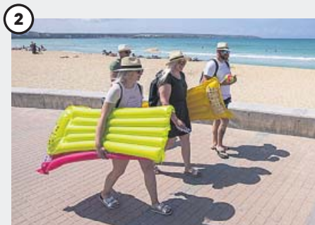
2 Mucha afluencia en las playas Si en algo se nota la llegada de turistas es en la ocupación de las playas, donde también se han tomado medidas como, por ejemplo, el mantenimiento de la distancia de seguridad.