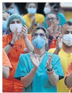
Sanitarios del hospital Gregorio Marañón (Madrid).

La encuesta, elaborada para el sindicato por la empresa de estudios Sonda, fue realizada a finales de mayo y principios de junio a profesionales de la enfermería. Sus principales conclusiones son que la pandemia ha afectado gravemente al colectivo y que han tenido escaso material de protección para ponerse en primera línea.