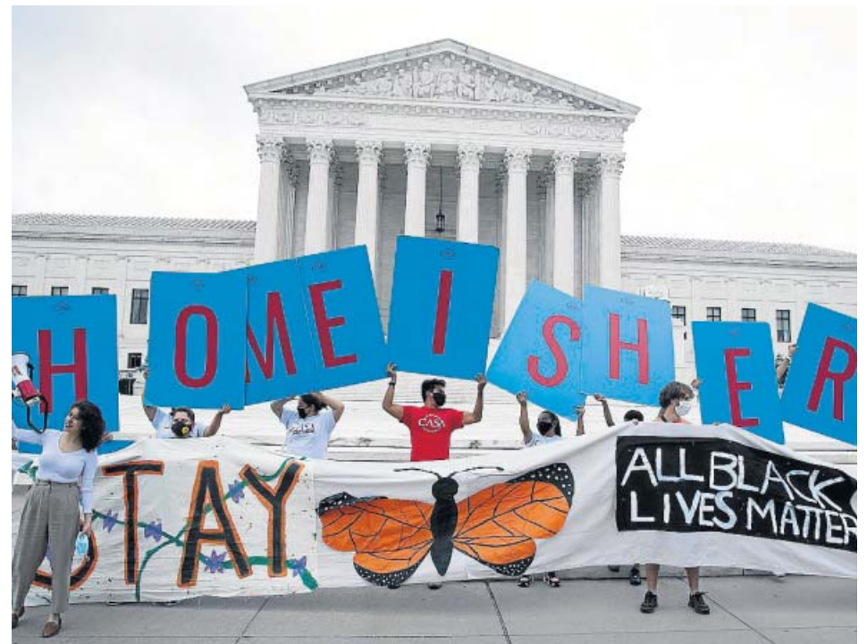
Manifestantes contra el plan de expulsión de jóvenes inmigrantes, ayer en Washington.

En cuanto a la evolución anual de 20minutos , el crecimiento de usuarios en sites (incluyendo todas sus webs vinculadas) fue del 20% en un año, según constata el medidor oficial Comscore. Mientras, la página principal del periódico ha tenido un crecimiento del 25% en internet entre mayo de 2019 y de 2020. Es el más alto entre los periódicos que están en el top 10 y tienen edición digital e impresa. En el caso de El Mundo.es , su crecimiento ha sido del 16%; ABC ha subido un 23%, La Vanguardia un 7% y El País se ha mantenido en los 23,2 millones de usuarios, igual que el pasado año. ●