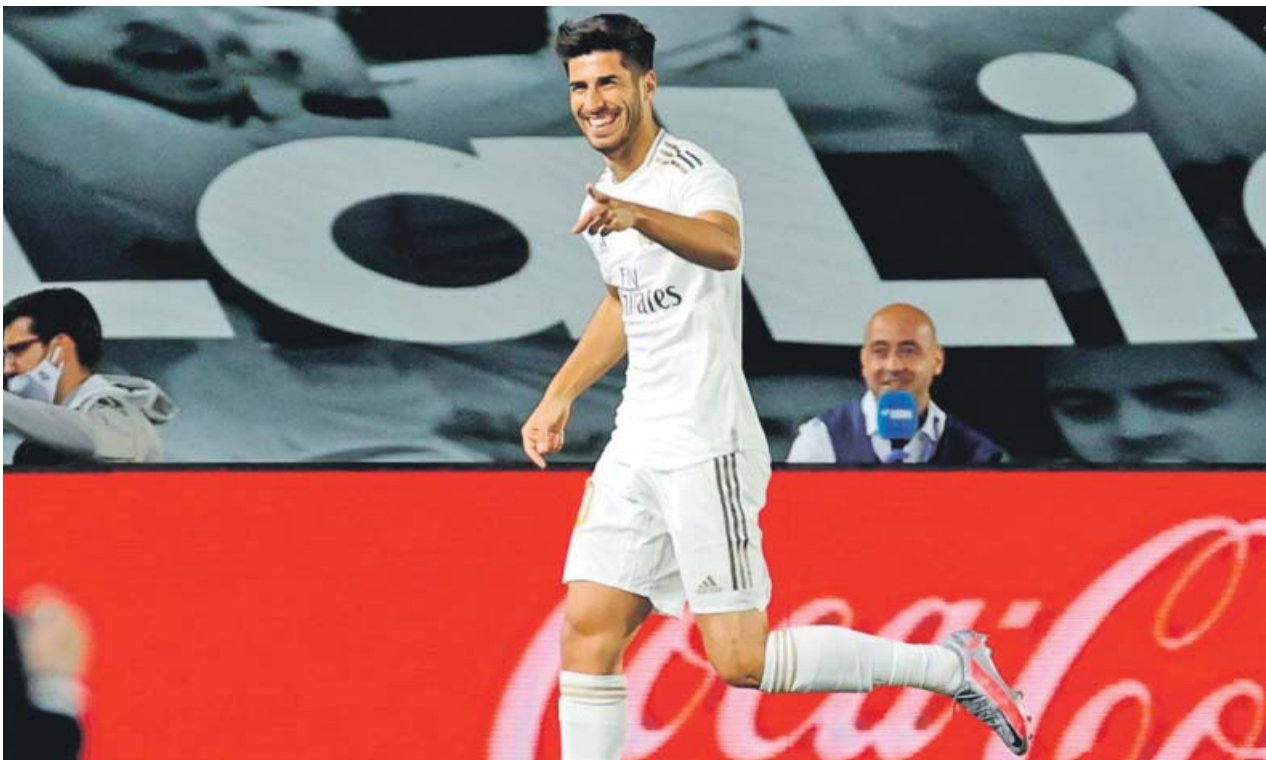
Asensio sonríe tras marcar el segundo tanto del Madrid, apenas un minuto después de salir a jugar tras más de 10 meses parado.