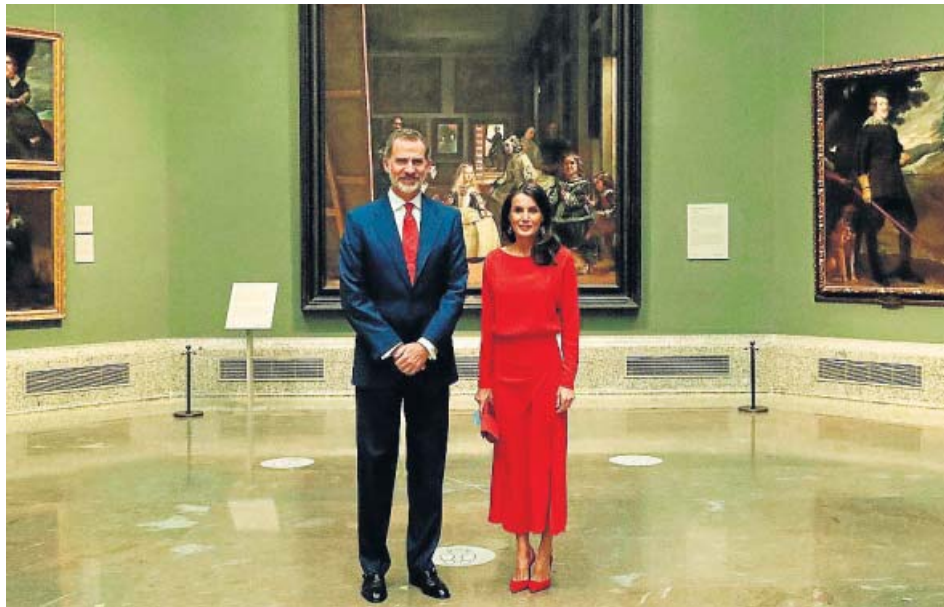
Los Reyes, ayer, delante de Las Meninas durante la presentación de la campaña Spain for Sure .

Los Reyes presidieron ayer en el Museo del Prado el lanzamiento de otra campaña a favor del turismo, Spain for sure –España, seguro que sí–. En este caso, para promover el regreso de los turistas internacionales y lanzar, según el rey, un «mensaje de fe en nosotros mismos». Rafael Nadal, Pau Gasol, Isabel Coixet, los hermanos Roca o Ana Botín se unieron en un vídeo para garantizar que «España es el país más seguro del mundo». ●