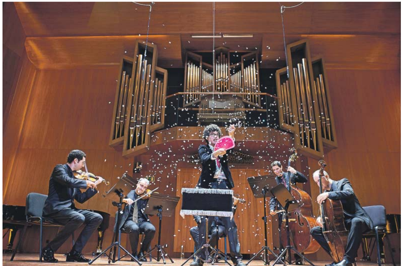
Un espectáculo melódico de magia en la Escuela Superior de Música Reina Sofía.

«Las artes escénicas funcionan como aglutinadoras y catalizadoras de la diversidad social y nos ayudan a construir identidades y personalidades saludables dentro de la sociedad moderna en la que vivimos. Son muy importantes para quebrar las barreras de las diferencias culturales. En otras palabras, sirven para unirnos más, para aprender unos de otros, pues la cultura y la sociedad siempre han estado directamente conectadas. Las artes escénicas son una parte fundamental en el fortalecimiento del bienestar y de la libertad que querríamos alcanzar. Nos ayudan a razonar, a comprender y a imaginar. Y, particularmente, la música tiene un gran poder en la sociedad, pues su impacto emocional es innegablemente evocador y sanador. Hay una frase del filósofo Arthur Schopenhauer con la que no podría estar más de acuerdo: 'La música expresa la filosofía más elevada en un lenguaje que la razón no comprende'. Por otra parte, no hay que olvidar su poder para atraer visitantes, funcionar como catalizador urbano y potenciar el tejido económico del territorio en el que se desarrolla».