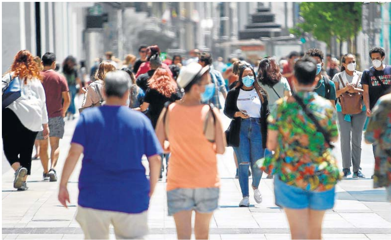
Ciudadanos pasean por la calle protegidos con mascarillas frente al coronavirus. JORGE PARÍS

«Hemos aprobado un acuerdo marco para la compra de vacunas contra la gripe al que se han podido sumar las comunidades que lo han considerado oportuno. Aparte, de forma excepcional, el Ministerio de Sanidad está ejecutando una compra reforzada de dosis», afirmó ayer el ministro Salvador Illa. Ese acuerdo marco contempla la adquisición de 4,74 millones de vacunas, frente a los aproximadamente tres millones del año pasado. Y entre las regiones que se han sumado a la compra centralizada está por ejemplo Andalucía, que alerta de «problemas de abastecimiento». El con-