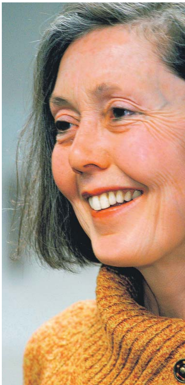
La poeta y ensayista Anne Carson.

Sus editores en España alaban su precisión en el lenguaje poético y su «excelencia»