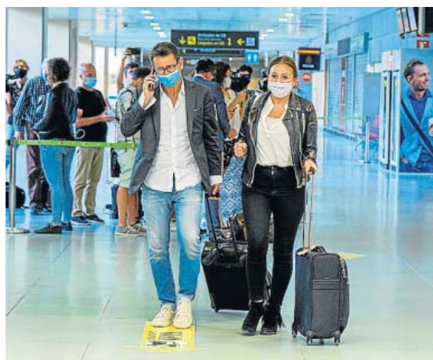
Turistas alemanes llegando al aeropuerto de Ibiza.

Los expertos consultados por 20minutos aseguran que «solo es viable hacer las PCR en ori-