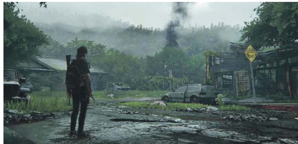
Ellie protagoniza el videojuego The Last of Us - Parte II .

A tenor de las primeras críticas, este ambicioso proyecto parece destinado a repetir el destino de su predecesor: convertirse en un hito dentro de la industria. The Last of Us - Parte II ha recogido las cualidades del título original y las ha llevado un paso más allá tanto a ni-