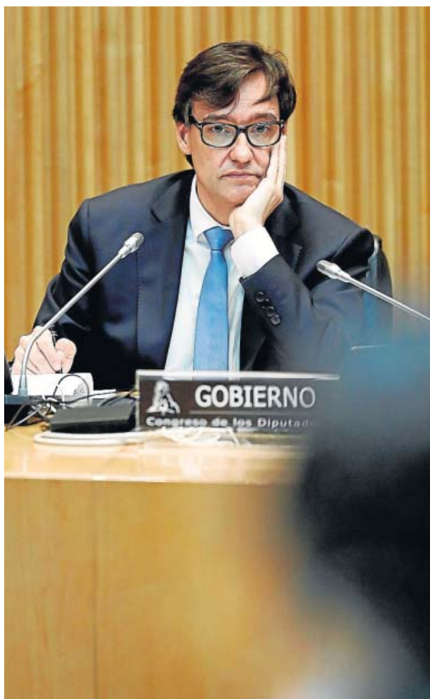
El ministro de Sanidad, Salvador Illa, ayer en el Congreso.

De ahí que la prioridad del ministerio ahora mismo, señaló el titular de Sanidad, sea reforzar el sistema sanitario para que, en caso de necesitarlo, las comunidades pudieran reactivar en apenas unos días sus planes de contingencia. Gobierno y comunidades, explicó Illa, están haciendo acopio de reservas «estratégicas» de material. No obstante, en el plano positivo, Illa se mostró confiado en que una eventual segunda ola sería «más benigna» que la primera por el aprendizaje de los sanitarios y las medidas de seguridad que ya está tomando la población, si bien insistió en que «el virus está ahí y no podemos relajarnos».