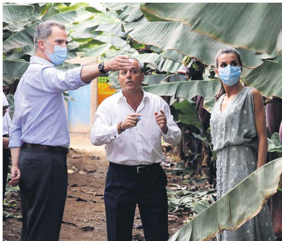
Felipe VI y Letizia durante un momento de su visita por Gran Canaria.

«Es verdad que [Canarias] está físicamente más lejos, pero también es verdad que tuvo desgraciadamente un protagonismo al inicio de esta crisis con los primeros casos que se reportaron en La Gomera», señaló Felipe VI antes de recordar que España «ya está en marcha» y levantando «el ánimo». ●