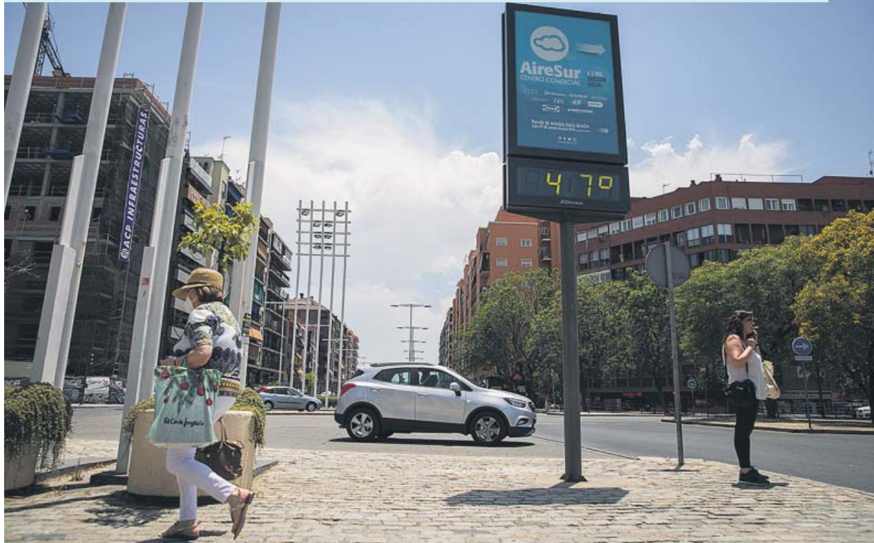
Un termómetro marca 47°C de temperatura ayer en Sevilla, una jornada especialmente calurosa.