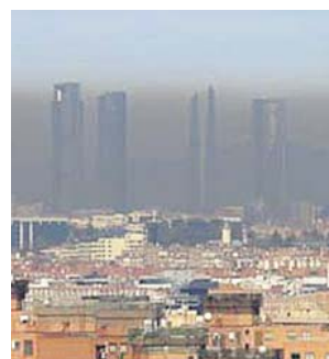
Las grandes urbes siguen siendo las más contaminadas.

No obstante, esos cálculos, recogidos por Ecologistas en Acción en el informe sobre la calidad del aire en España durante el pasado año que presentaron ayer, no son benévolos por dos motivos. El