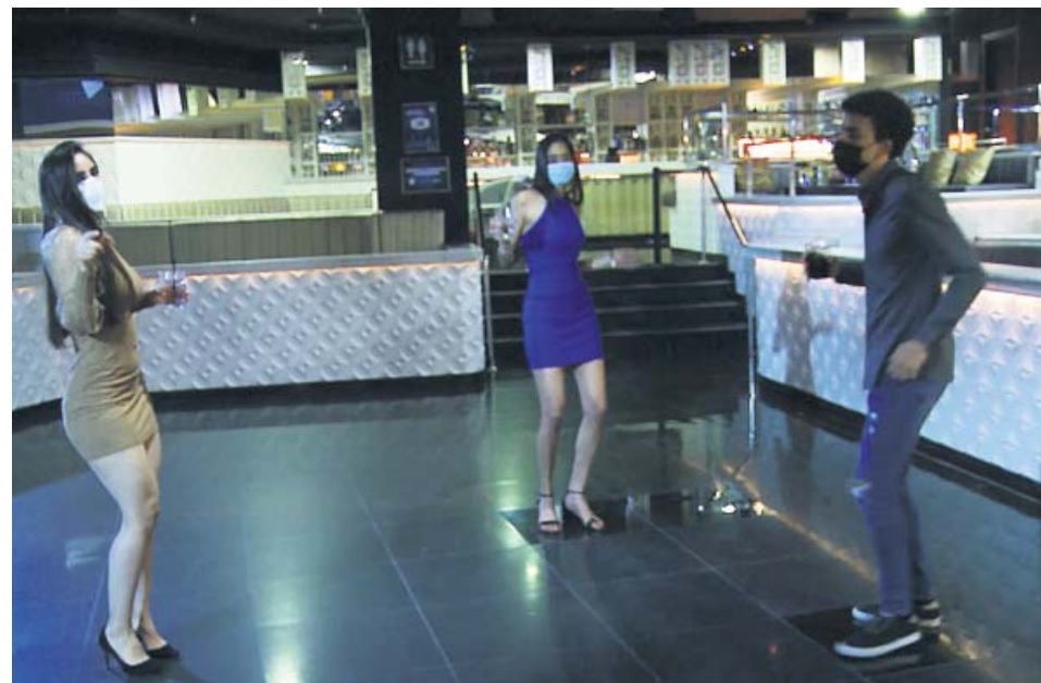
Tres personas bailando en la pista de una discoteca con mascarilla. ESPAÑA DE NOCHE

Aseos con aforo limitado. Los aseos deberán tener definida su capacidad máxima y se insta a que haya una persona dedicada a limpiarlos y a controlar que se cumplan las medidas de seguridad.