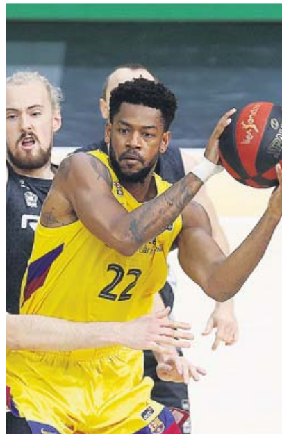
El Barça pasa como líder Ganó, sin Mirotic, al Bilbao Basket (73-85)

Toda la información sobre cómo afecta el coronavirus al mundo del deporte, en nuestra web