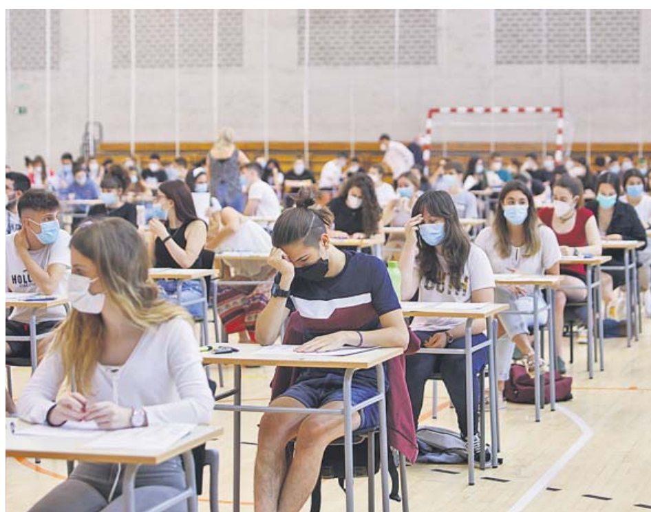
Estudiantes de Navarra, ayer durante la realización de la EBAU en una cancha deportiva.

Educación asegura que la guía ofrece «un marco común» que puede ser adaptado en cada comunidad e implementado según la realidad de cada centro y alerta de que las medidas se actualizarán en función de la evolución de la Covid. ●