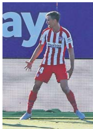
Marcos Llorente fabricó el gol del Atlético.

Diego Costa formó el ataque rojiblanco junto a Marcos Llorente, el 'delantero' que ha descubierto Simeone y que está demostrando un gran rendimiento cuando juega cerca del área. Y fue precisamente Llorente quien se encargó de fabricar el gol de la victoria colchonera al cuarto de hora. Con un control