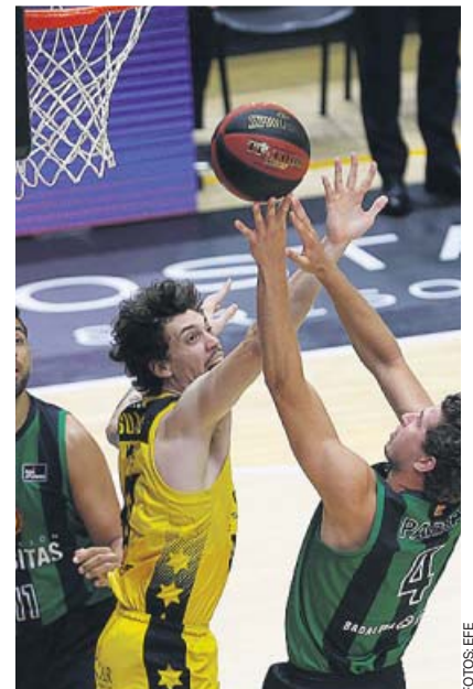
El Joventut, eliminado Tras su derrota ante el Tenerife (82-80)