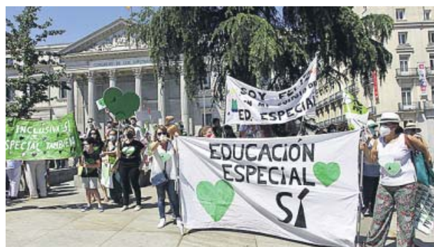
Concentración por la Educación Especial ante el Congreso.

Convocados por la plataforma Educación Inclusiva Sí, Especial También, los asistentes desafiaron las altas temperaturas de primera hora de la tarde y exigieron la retirada de los apartados de la Ley Celaá que «vulneran gravemente los derechos de las personas con necesidades