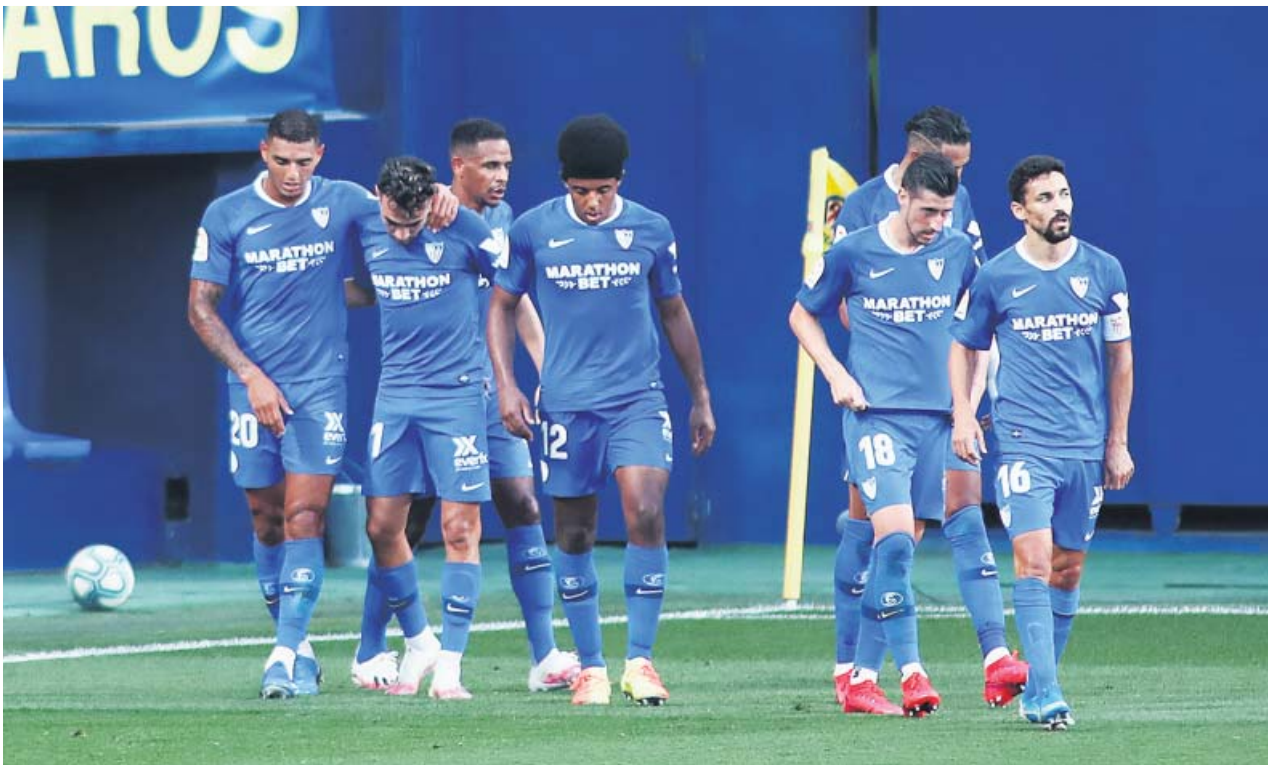
Los jugadores del Sevilla celebran uno de los goles ante el Villarreal en La Cerámica.