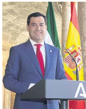
Moreno, ayer tras la reunión en la Alhambra.

El presidente de la Junta, Juanma Moreno, y el vicepresidente, Juan Marín, destacaron ayer el cumplimiento al 88,89% de los compromisos que el PP-A y Cs suscribieron en enero de 2019, cuando se convirtieron en socios de Gobierno tras las elecciones del 2 de diciembre de 2018. Así lo expusieron ayer tras el Consejo de Gobierno celebrado, por primera vez, en la Alhambra de Granada, donde el popular afirmó que «es evidente la sintonía personal que ten-