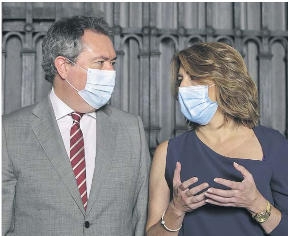
Juan Espadas, acompañado por la secretaria general del PSOE-A, Susana Díaz.

LAS ENCUESTAS lo vuelven a situar como ganador con un concejal más que ahora EL REGIDOR renuncia de momento a la tasa turística e incrementa el gasto social