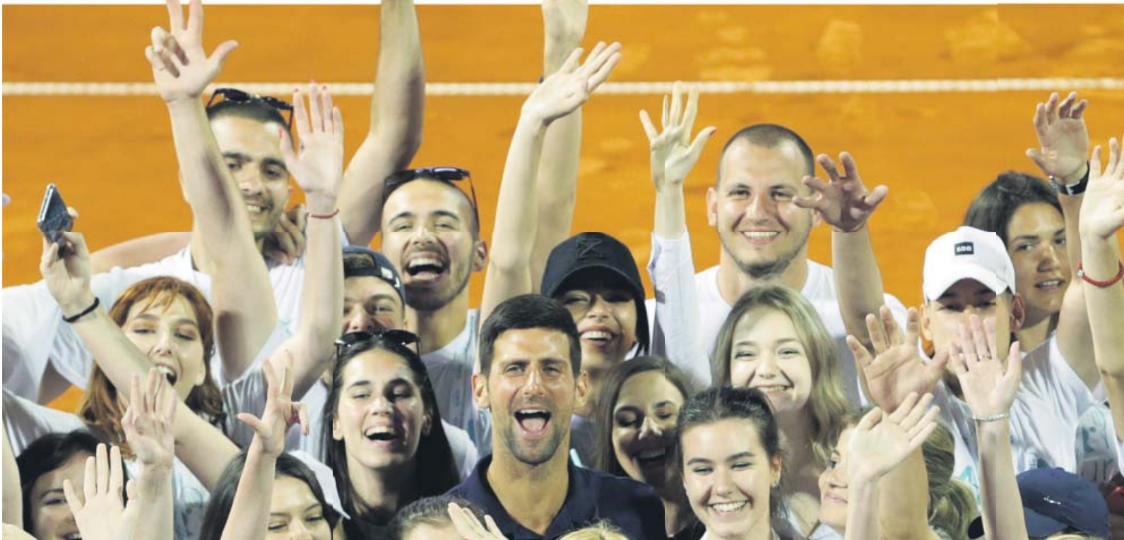
Novak Djokovic posa junto a varios voluntarios del Adria Tour.