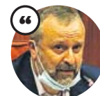
RAMON MAS Presidente de la Federación Española de Discotecas

«Si no se puede bailar no podemos abrir los establecimientos. No se puede jugar así con los puestos de trabajo»