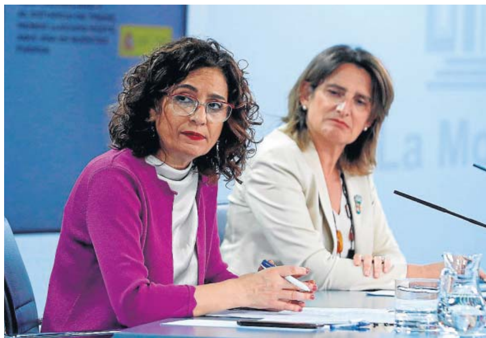
La portavoz del Gobierno, María Jesús Montero, y la vicepresidenta cuarta, Teresa Ribera.

El Gobierno no tiene previsto actuar por ahora ante los últimos brotes de coronavirus, pero no descarta tomar medidas si fuera necesario. En caso de «agravarse» la situación, se plantea cerrar el país al turismo internacional y restringir de nuevo los movimientos mediante la declaración del estado de alarma. El Gobierno lanzó ayer estos dos mensajes —uno más voluntario que otro— al mismo tiempo que intentaba mantener la calma sobre los casos que se registran estos días. «No hay nada que temer en estos momentos», dijo su portavoz, María Jesús Montero.