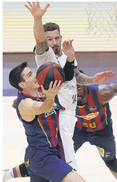
El Baskonia, casi clasificado Venció en la prórroga a Unicaja (87-86)