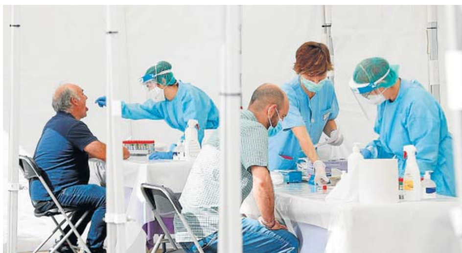
Gráfico: Carlos G. Kindelán