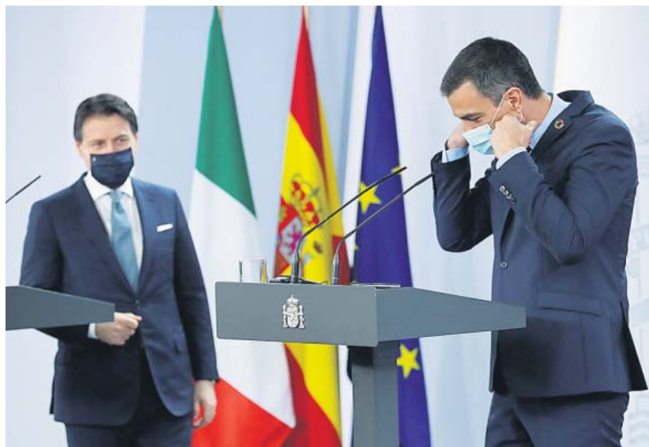
Pedro Sánchez y Giuseppe Conte, ayer en Moncloa.

Fondo de rescate. Sánchez no descarta pedir ayuda al MEDE si la situación por la Covid «empeora». Podría pedir créditos por hasta el 2% del PIB para sufragar gasto relacionado con la pandemia.