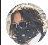
JOHNNY DEPP Actor

«Odio defender las drogas, el alcohol, la violencia o la locura para cualquiera, pero siempre han funcionado para mí»