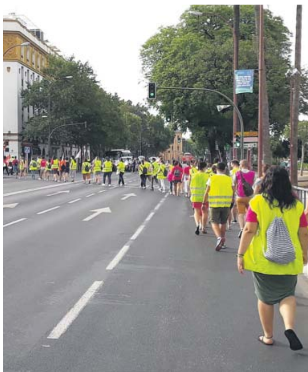
Movilización por el mantenimiento de los PTIS. CC OO SEVILLA

Desde CC OO-A hablan de una «nefasta gestión» y se remiten a los datos. El sindicato asegura que el incremento de docentes planteado por la Junta supondrá un «irrisorio aumento de plantilla del 4%, frente al 30% necesario para garantizar la distancia física» y «cuyo