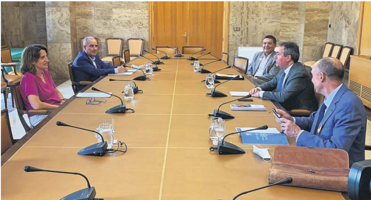
Reunión en Madrid entre la ministra Teresa Ribera y el alcalde de Sevilla, Juan Espadas.