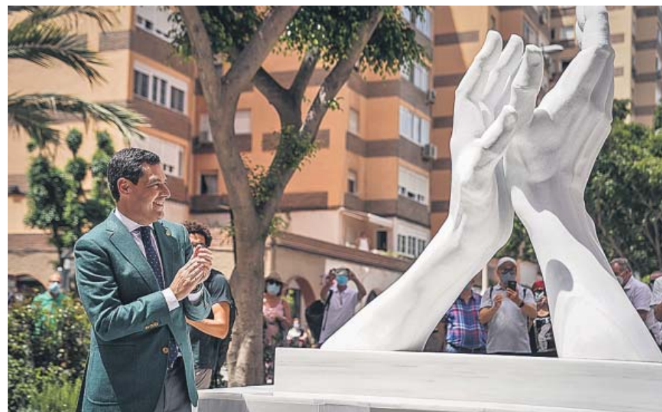
Un aplauso en mármol por todos los que han estado en primera línea

Y en mitad de esta polémica, precisamente ayer el presidente de la Junta, Juanma Moreno, anunció que ha solicitado al consejero de Salud y Familias, Jesús Aguirre, que convoque