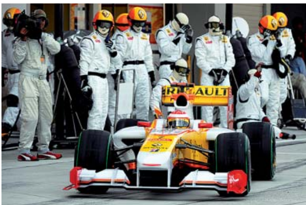
2009 Su segunda parada en Renault no fue tan afortunada y nunca pudo luchar por ese tercer campeonato que, desde entonces, se le resistió.