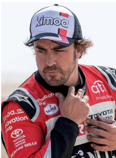
2020 La gran locura se convirtió en reto y Alonso no lo dudó, corriendo en el Dakar y acabándolo en una más que digna decimotercera posición.