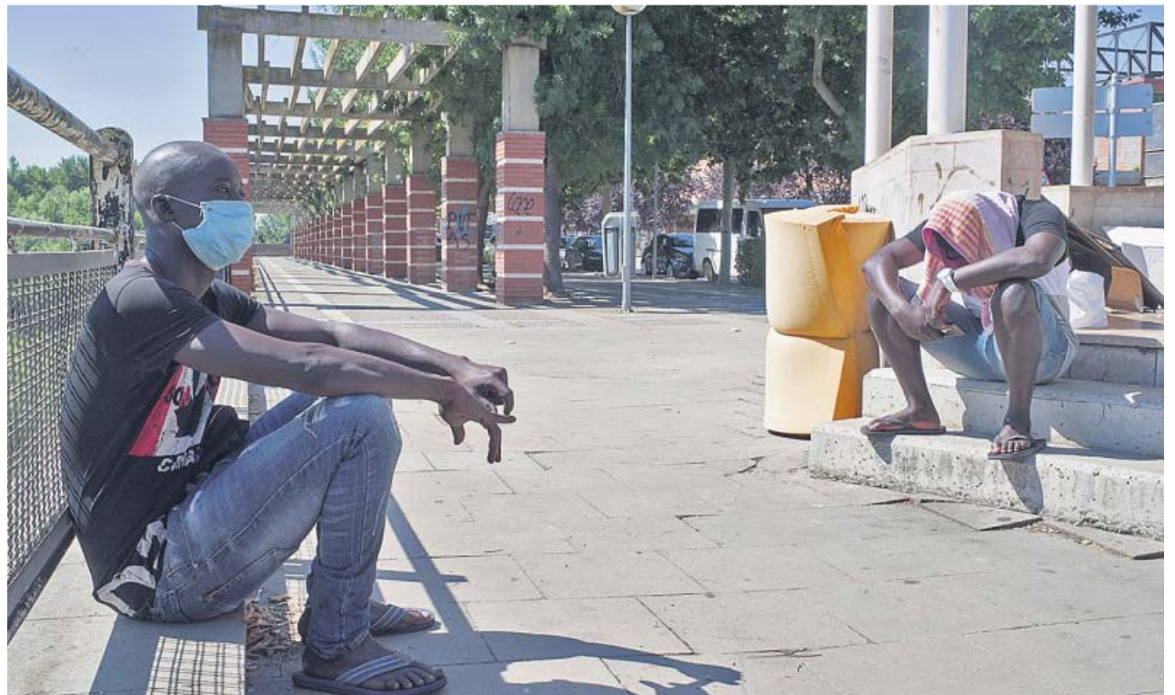
Dos temporeros en la localidad de Zaidín, en Huesca, una de las zonas con brotes activos.

«Desde el punto de vista económico, resulta obvio que la irregularidad nos cuesta dinero, y el paso a la regularidad permite incrementar los ingresos del Estado» por los impuestos que comenzarían a pagar estos migrantes al trabajar legalmente, argumentó el portavoz. «Según algunos estudios, acabar con la irregularidad de las personas que no tienen documentación en regla podría suponer hasta 1.500 millones de euros de ingresos extra para el Estado», cifró.