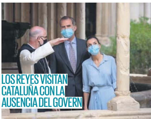
LOS REYES VISITAN CATALUÑA CON LA AUSENCIA DEL GOVERN

Comunidades como Murcia prohibieron ayer el ocio nocturno dentro de los locales tras multiplicarse los contagios por actividades de este tipo en Gandía, Córdoba, Cantabria... Desde el viernes, se han registrado 4.581 casos en España. PÁGINA 6