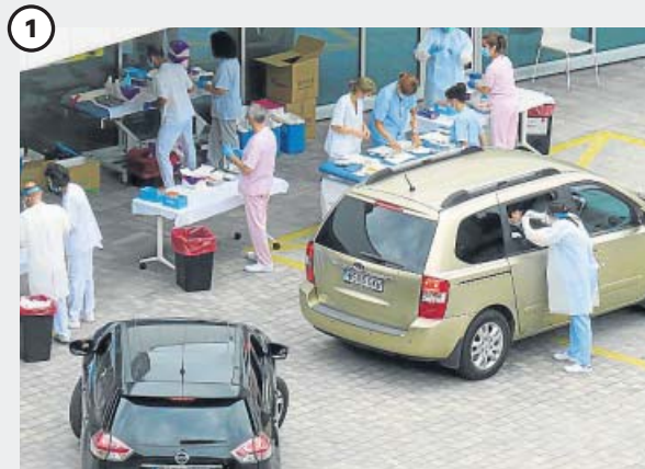
Test masivos en Guipúzcoa por la subida de los contagios Las autoridades han comenzado a hacer test masivos en Guipúzcoa por la escalada de contagios en Euskadi: la semana pasada empezó con 27 casos y el domingo terminó con 197.