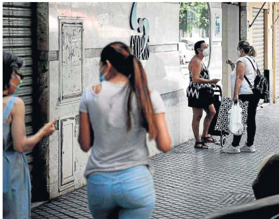
Unas vecinas charlan en la calle donde vivía la mujer asesinada por su hijo en Córdoba.

●●● Algo más del 42% de los encuestados considera que la gestión de la Junta es buena o muy buena, frente al 34,8% que la considera mala o muy mala. En cuanto a la situación económica de la comunidad, el 65,5% cree que es mala o muy mala y solo el 15,4% la califica como buena o muy buena. Además, al ser preguntados por qué partido puede dar mejor respuesta a los problemas de Andalucía, el 33,5% señala que «ninguno». El barómetro se realizó entre el 18 de junio y el 1 de julio, con 3.600 encuestas en las ocho provincias.