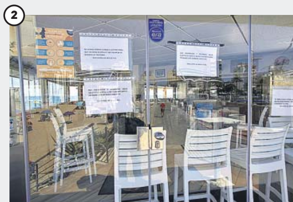
Un brote en Gandía provoca el cierre del ocio nocturno El brote originado en un pub de la playa de Gandía sumó ayer 7 nuevos casos a los 70 que ya había. Esto provocó que la Generalitat Valenciana cerrase el ocio nocturno en la localidad.

Por su parte, el Gobierno gallego de Alberto Núñez Feijóo anunció el viernes que no permitiría la celebración de botellones en la vía pública y solicitó que se limitasen las fiestas privadas. En el País Vasco, el lehendakari Iñigo Urkullu ha hecho retroceder al sector hostelero (incluyendo la noche) a una fase que mezcla características de la 2 y la 3 con limitación de aforos y obligatoriedad de mascarilla en todo momento.