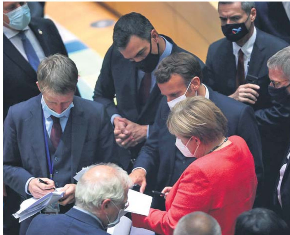
La canciller alemana, Angela Merkel, rodeada de mandatarios europeos, entre ellos Sánchez.

Comisión Europea. De esta cifra, los Estados miembros obtendrían 312.500 millones en subsidios y 360.000 millones en créditos. Para recibir estas ayudas, los gobiernos nacionales tendrán que elaborar planes de reformas que serán evaluados por la Comisión Europea en un plazo de dos meses. En su análisis, Bruselas analizará el