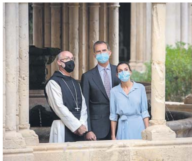
Los Reyes, en el monasterio de Poblet, con el abad.

El president Quim Torra solicitó a la policía catalana un informe de «los incidentes»; ERC, CUP, ANC y Òmnium criticaron la actuación de los agentes; y la exconsellera Clara Ponsatí pidió la dimisión del conseller de Interior, Miquel Buch.