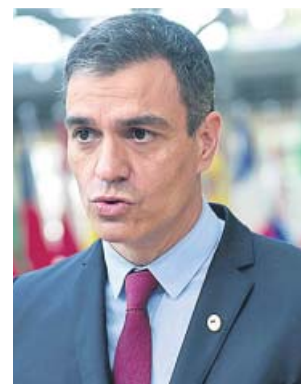
El presidente del Gobierno de España, Pedro Sánchez.

Hizo además un llamamiento al resto. «Tenemos que dar una respuesta que dé certidumbre, que dé tranquilidad, sosiego y serenidad tanto a empresas y trabajadores como al conjunto de la ciudadanía para poder afrontar con todas las garantías de la pandemia», explicó.