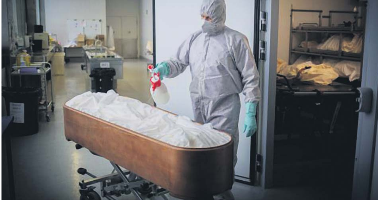
Operarios del crematorio de Girona desinfectan un cadáver con Covid-19 y su ataúd. DAVID ZORRAKINO