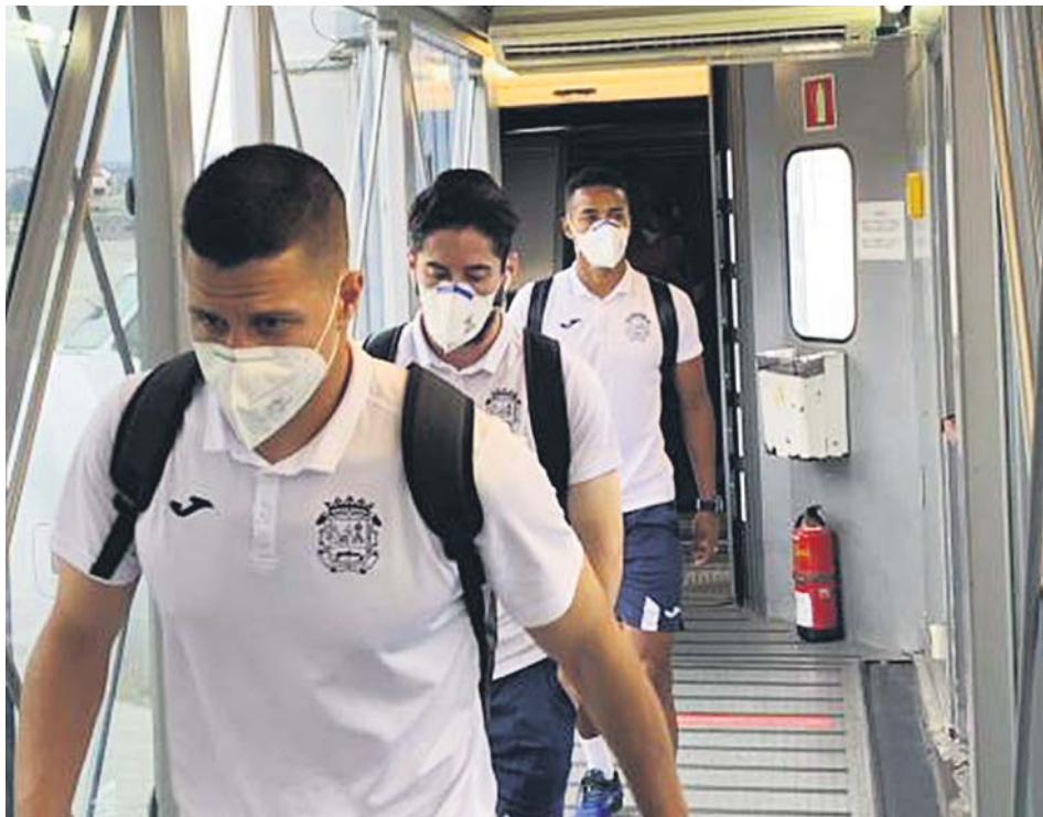
Varios jugadores del Fuenlabrada, llegando ayer a La Coruña.