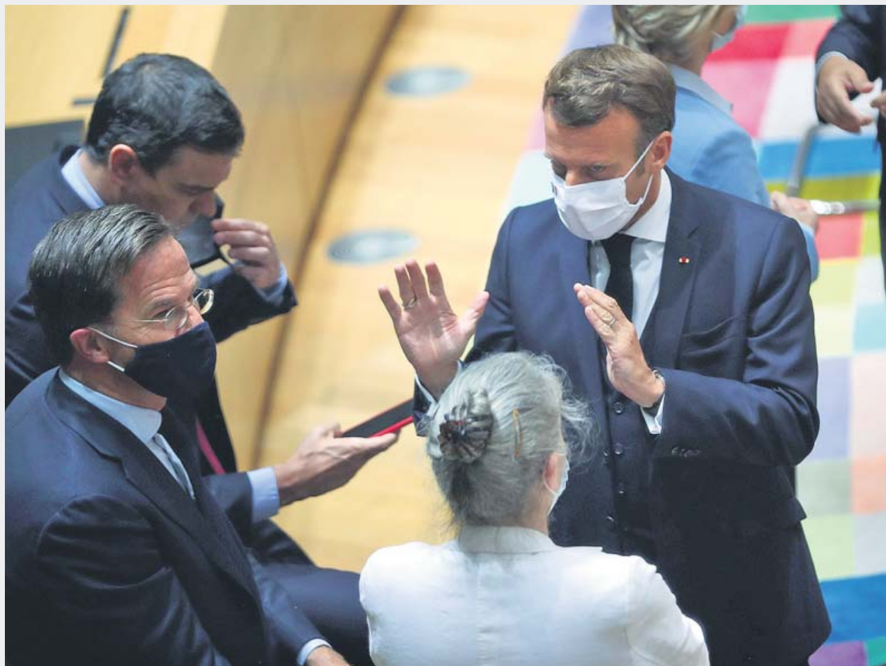
Los corrillos se multiplicaron ayer durante el maratónico Consejo: en esta imagen, Emmanuel Macron gesticula delante de Mark Rutte, primer ministro de Países Bajos, y el presidente español Pedro Sánchez, que mira el teléfono móvil.