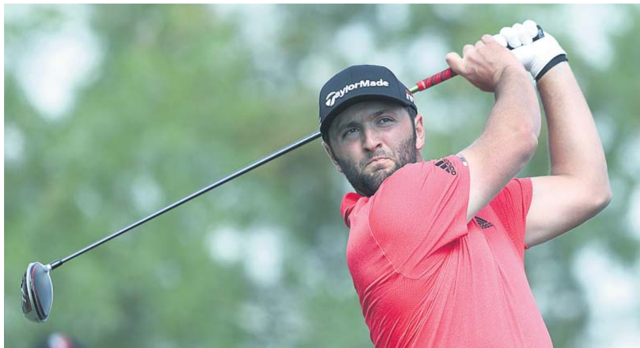
Rahm, con tan solo 25 años, ha logrado escalar hasta la cima del golf mundial.

El golf español está de enhorabuena después que Jon Rahm se proclamase nuevo campeón del torneo Memorial del PGA Tour y también alcanzase el puesto de número uno en la clasificación mundial. Rahm, a sus 25 años, se convierte en el segundo español que lo consigue y vio cumplido el gran sueño de emular al legendario Severiano Ballesteros, el gran maestro que primero lo logró, y que ha sido su inspirador y referencia desde que llegó al deporte del golf. ●