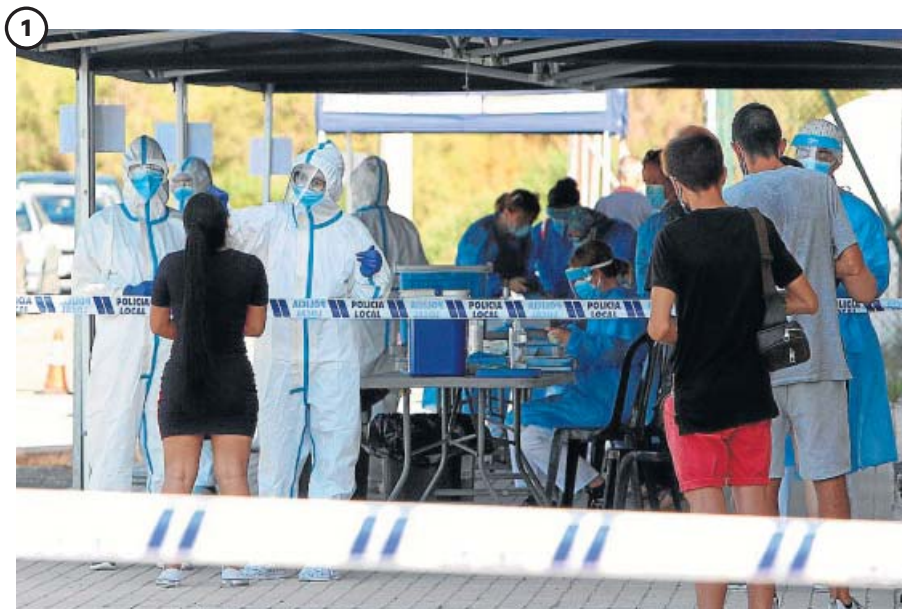
Centenares de test a los clientes de la discoteca Oasis de Santa Pola (Alicante)

El personal sanitario de la localidad alicantina de Santa Pola comenzó ayer a realizar pruebas PCR a todas las personas que estuvieron en la discoteca Oasis los días 10, 11 y 12 de julio ante la aparición de un brote de Covid-19 con origen en la misma. Hasta ayer se habían detectado 11 positivos.