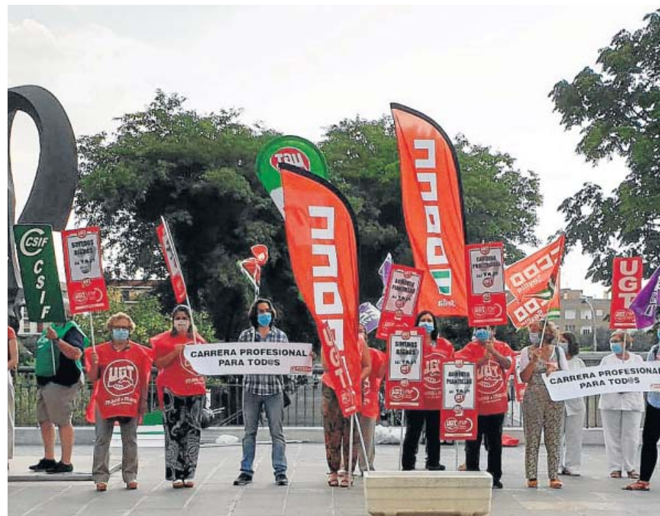
Protesta a las puertas del Hospital de Valme, en Sevilla. cc 00

●●● Los mayores y pensionistas podrán recoger a partir de hoy las tres mascarillas gratis que la Junta va a repartir en las farmacias a estos colectivos a través de la tarjeta sanitaria. Para evitar aglomeraciones en las boticas, el reparto comenzará hoy para los mayores con 80 años o más; el jueves, para los de 70 años o más; el viernes, para los de 65 cumplidos o más; y el sábado, para el resto de pensionistas menores de 65. A partir del lunes, podrán acudir a por sus mascarillas quienes no hayan podido hacerlo en su día asignado.