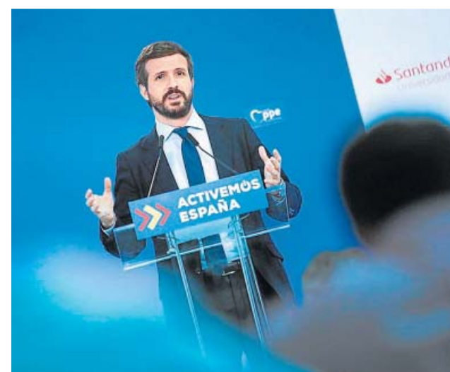
Pablo Casado, ayer, en un acto del Partido Popular.

La llegada de fondos de la UE para engrosar los Presupuestos tampoco hace que el Gobierno abandone su reforma fiscal para subir impuestos como el de Sociedades o el IRPF a las rentas más altas. Montero afirmó ayer que eso sería «hasta contradictorio» y no «hacer los deberes» ante la ayuda europea. La subida de impuestos «permitirá que nuestros ingresos se parezcan más a los de países de nuestro entorno». «Lo que no puede ser es un Estado que solicite lo que necesita no haga sus propios deberes». ●