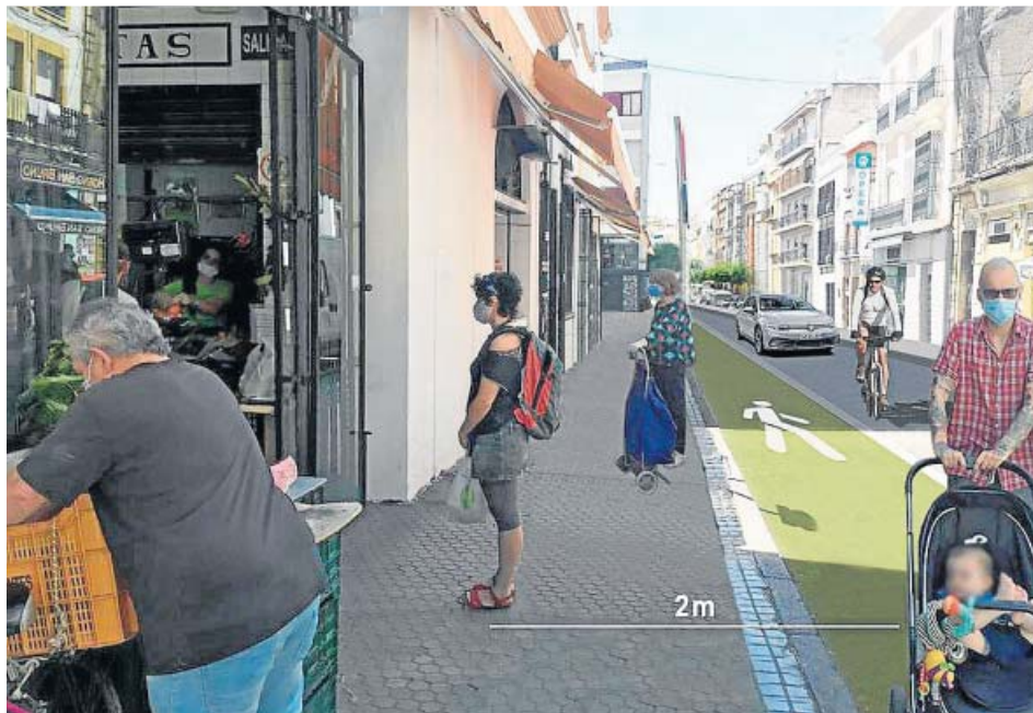
Arriba, la calle Feria actualmente; abajo, recreación cuando gane acerado.

mente hay hasta cinco—. El tramo hasta Marqués de Paradas quedará con tres carriles de circulación y un amplio espacio peatonal y ciclista. Y desde esta calle y hasta Santas Patronas habrá dos carriles para vehículos y el resto, para peatones y bicis. La carga y descarga y la parada de taxis se reubicarán.