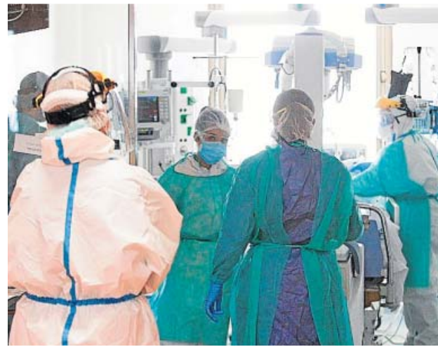
Sanitarios tratando a un enfermo de Covid.

■ Lopinavir-Ritonavir. Ha sido recomendado por las autoridades sanitarias chinas durante la crisis en este país, pero no existe evidencia procedente de ensayos clínicos sobre su eficacia.