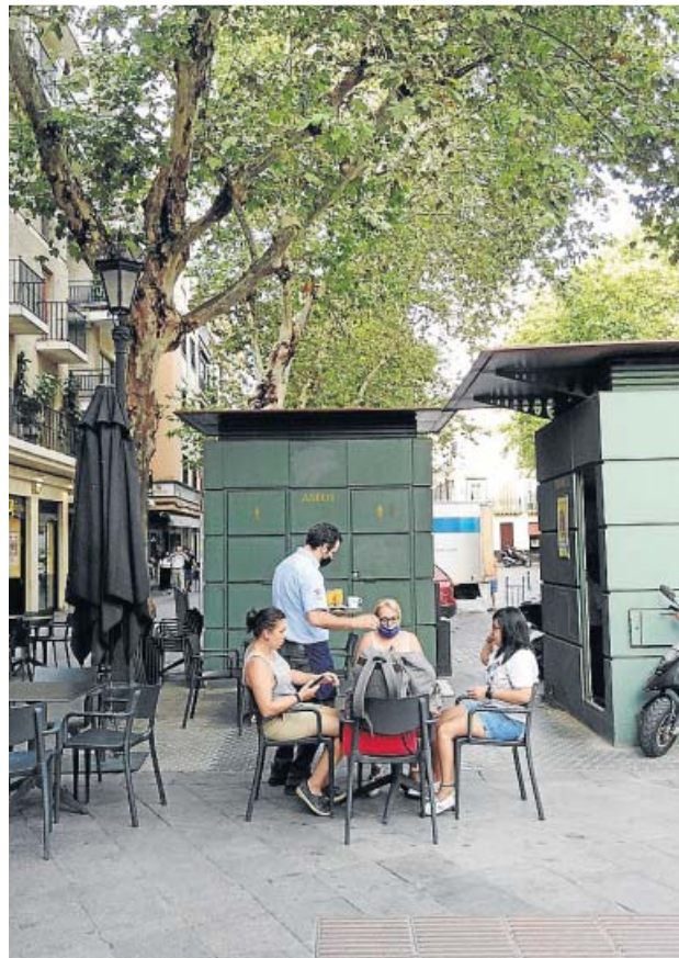
Velador de una cafetería en la calle San Pablo. B.R.

La ampliación de veladores, eso sí, estará sujeta a una serie de requisitos, priorizando siempre el derecho al descanso de los vecinos y respetando la ordenanza de contaminación acústica y todas las me-