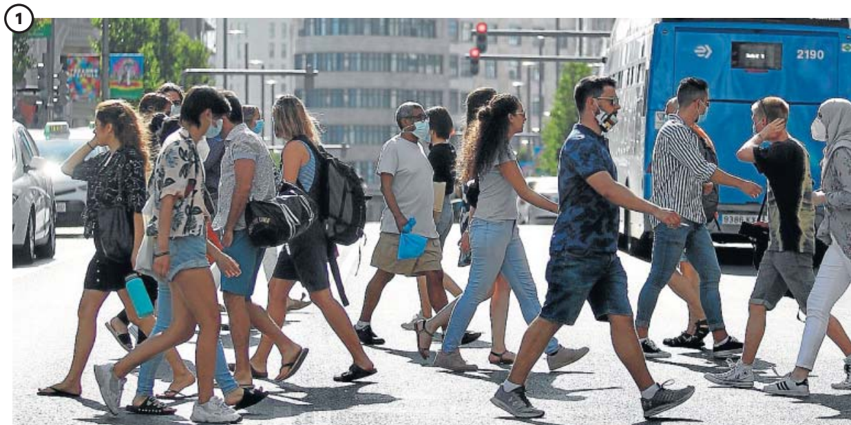
1 La mascarilla, un complemento habitual en las calles de Madrid

Pese a que Ayuso no la ha hecho obligatoria aún, es alto el grado de utilización de la misma por parte de los ciudadanos. Al menos así lo muestran los datos: la Consejería de Sanidad asegura que hasta un 98% de personas la llevan, una cifra muy parecida a la dada por una encuesta del Instituto Carlos III, que calculaba que el porcentaje alcanzaba el 95%.