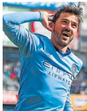
David Villa, durante su época en el New York City.

La información se hizo pública ayer: una exempleada del New York City de fútbol denunció por acoso sexual a David Vi-