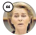
URSULA VON DER LEYEN Presidenta de la Comisión Europea

«El acuerdo proporcionó luz al final del túnel, pero la sombra tiene forma de un presupuesto de la UE muy ajustado»