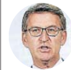
ALBERTO NÚÑEZ FEIJÓO Presidente gallego, sobre el reparto de fondos post-Covid.

«No podemos aceptar este reparto porque no se deriva de un acuerdo sanitario, sino de un acuerdo político»