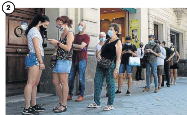
2 Un Sant Jordi peculiar

Pese a que Ayuso no la ha hecho obligatoria aún, es alto el grado de utilización de la misma por parte de los ciudadanos. Al menos así lo muestran los datos: la Consejería de Sanidad asegura que hasta un 98% de personas la llevan, una cifra muy parecida a la dada por una encuesta del Instituto Carlos III, que calculaba que el porcentaje alcanzaba el 95%.