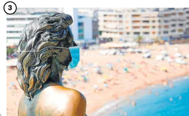
3 Playas con baja capacidad

Barcelona celebró ayer el día de su patrón de una forma diferente a como estaba acostumbrada. Los barceloneses (y sus mascarillas) se amontonaron a las puertas de las bibliotecas.