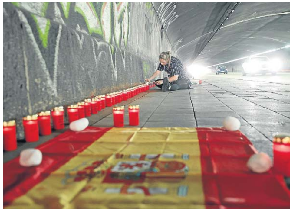
Velas y una bandera de España en el suelo, ayer, en el túnel donde se produjo la tragedia.

Gómez comparte la previsión de la Delegación del Gobierno y va más allá: «Por desgracia, viviremos un repunte de asesinatos» tras la pandemia, vaticina. «Cuando una mujer decide romper la relación o denuncia es el momento más peligroso para ella, porque ya no sabes cómo va a reaccionar él. Cuando él ve que se le escapa, no sabes hasta dónde puede llegar». ●