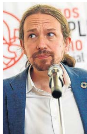
El vicepresidente Pablo Iglesias, hace unos días.

En dicho informe, la empresa se responsabiliza de parte de los daños que presenta la tarjeta, pese a que tampoco pudo acceder a su contenido con los métodos que probó. Cuando recibió el dispositivo, señala la compañía, éste «no tenía cor-