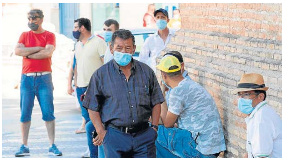
Los habitantes de Totana (Murcia) no podrán salir de su municipio.