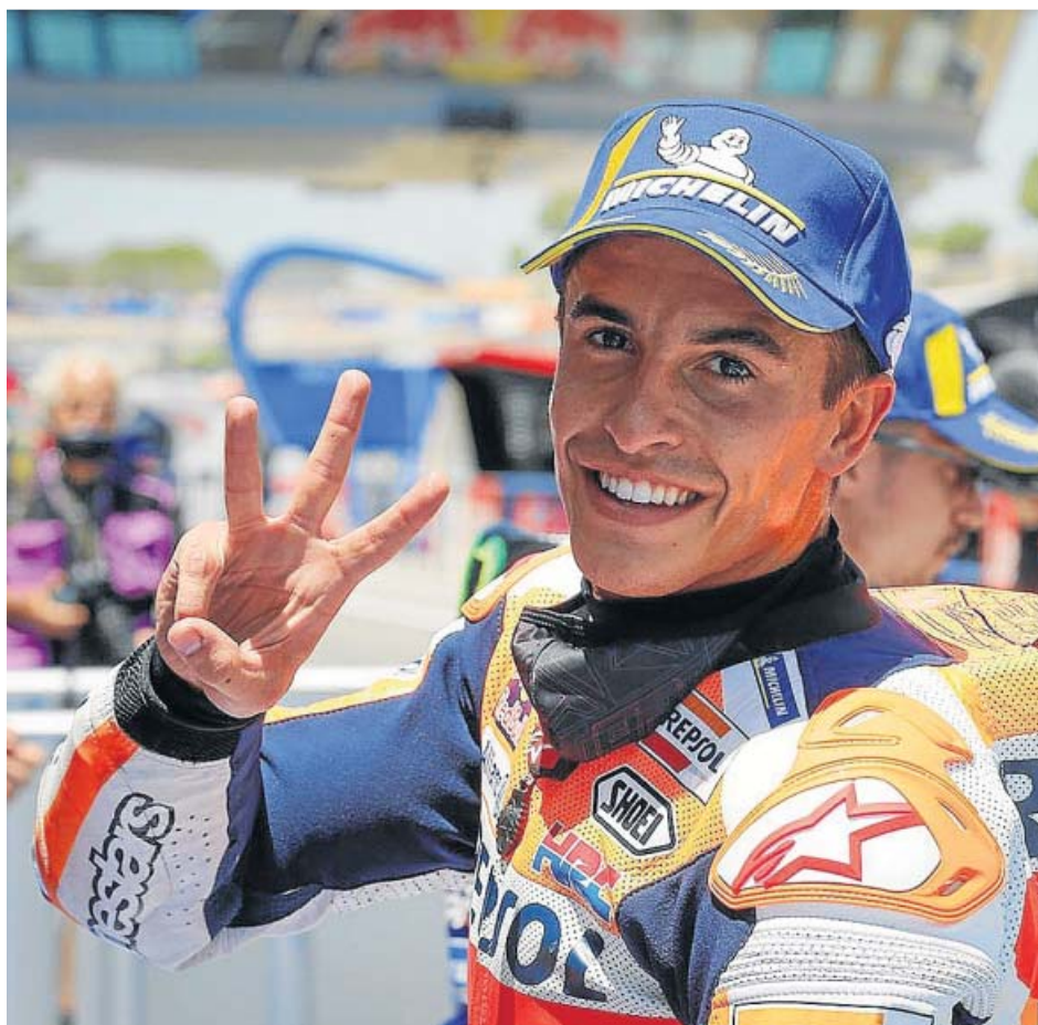
Marc Márquez se probará mañana y, si está listo, pilotará el domingo.

Todo apunta a que disputará la carrera, pero Alberto Puig advierte de que irán despacio. «Originalmente, claramente, la posición de Honda era no correr esta carrera e intentarlo en Brno. Pero, después de lo que vimos y lo que oímos de Marc y los doctores, que le han declarado apto, hemos llegado a un acuerdo. Lo intentará el sábado y dependiendo de cómo se sienta, tratará de correr, pero le hemos pedido que se pruebe el sábado primero para ver si realmente es capaz de hacer la distancia. Desde el pasado domingo a hoy las cosas han ido muy deprisa y francamente estamos sorprendidos», admitió el jefe del Repsol Honda.