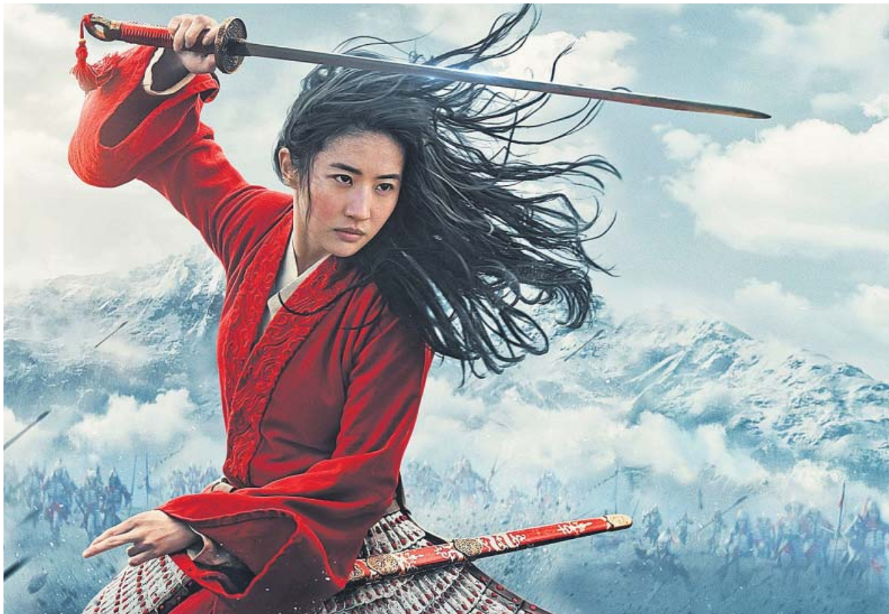
Disney ha optado por estrenar la nueva versión de Mulan en su plataforma digital en vez de en salas.