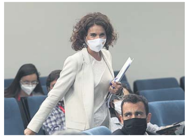
La portavoz del Gobierno, ayer, tras el Consejo de Ministros.

Esta idea se acerca al permiso retribuido al que se refirió la ministra de Educación, Isabel Celaá, hace unos días. La ministra de Trabajo, Yolanda Díaz, rechazó tal posibilidad y Sánchez no la mencionó ayer. ●