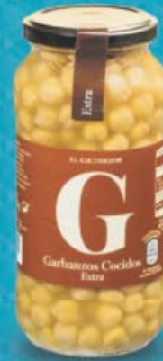
EL CULTIVADOR® Garbanzos cocidos extra Peso esc. 400 g (1,23 €/kg)