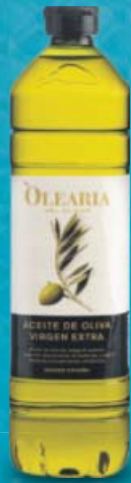
OLEARIA DEL OLIVAR® Aceite de oliva virgen extra Obtenido mediante procedimientos mecánicos. 1 l