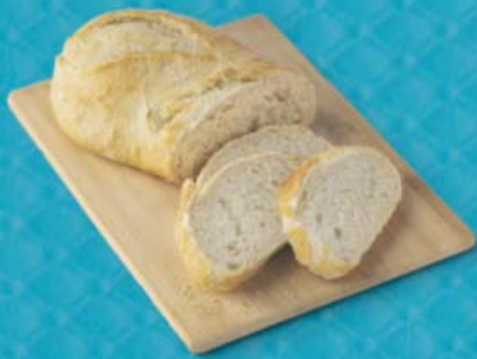
Pan hogaza Gran Reserva Peso aprox. 360 g (1,64 €/kg)