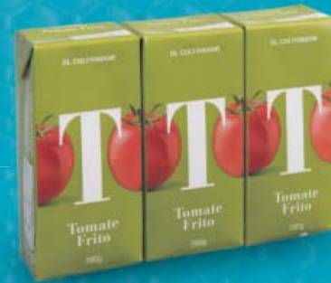
EL CULTIVADOR® Tomate frito Receta tradicional. 3 x 390 g (0,64 €/kg)