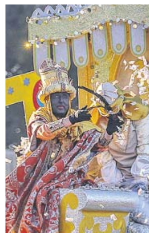
El rey Baltasar en la Cabalgata de Sevilla.

«No tenemos prisa y seguimos adelante, como cada año por estas fechas, con el operativo y el calendario previsto, pero estamos muy pendientes de lo que nos digan las autoridades sanitarias, en concreto la Consejería de Salud, y el propio Ayuntamiento», afirmó Pérez Calero. «Si al final no podemos salir, guardaremos las carrozas para el año que viene», concluyó. No sin antes recordar que el Ateneo no puede tomar una decisión