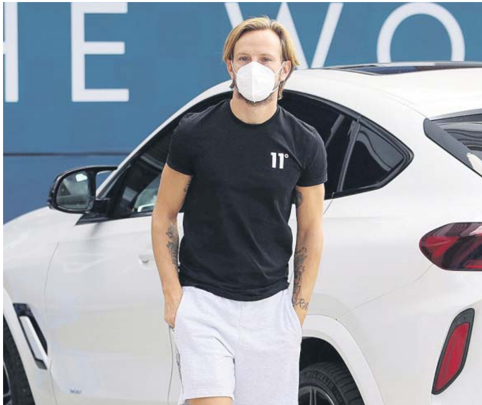
Ivan Rakitic, este domingo, tras pasar las pruebas PCR con el FC Barcelona.

Rakitic firmó por las cuatro próximas temporadas, hasta el 30 de junio de 2024, según informó el club presidido por José Castro en un comunicado. «El Sevilla FC y el FC Barcelona han alcanzado un acuerdo para el traspaso del centrocampista Iván Rakitic, que de esta forma vivirá su se-