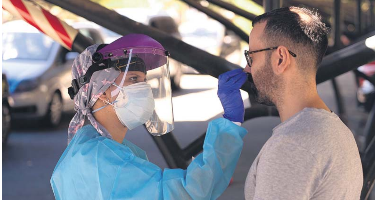
Una profesional realiza un test para detectar la Covid-19 en el aparcamiento del Hospital Militar de Sevilla.

Además, el responsable del ramo anunció que, como la Junta sabía que las vacunas «no van a venir en monodosis», han adquirido ya «25 mi-