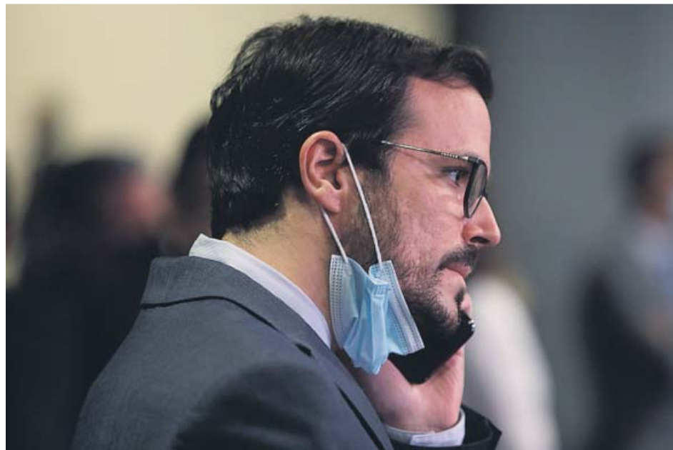
El ministro de Consumo, Alberto Garzón, habla por teléfono.

En su momento, un número 902 podía incluso ser beneficioso para el usuario. De hecho, se estableció para que si un consumidor llamaba a un servicio de atención al cliente localizado fuera de su provincia pagase algo más que por una llamada provincial, pero le saliera más barato que una llamada nacional. No obstante, hoy en día todos los grandes operadores ofrecen tarifas planas de llamadas desde fijos y móviles a toda España, por lo que la distinción entre lla-