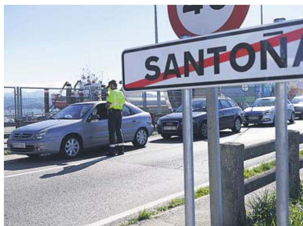
La Policía controla la entrada y salida de Santoña.

Limitación del movimiento y de la hostelería son algunas de las medidas más usadas por las comunidades para paliar el virus en algunas de sus localidades. A la lista que había, ayer se sumó Castilla-La Mancha con el confinamiento del municipio ciudadrealeño de Bolaños de Calatrava, de unos 12.000 habitantes; también lo hizo, pero por voluntad propia, Albolote (Granada), cuyo alcalde solicitó a sus más de 18.000 vecinos que reduzcan su movilidad durante los próximos 14 días para impedir el avance del coronavirus, y Murcia devuelve a fase 1 a la pedanía de Archivel y anunció que los bares y restaurantes de la región deberán restringir el servicio en barra y ventana.