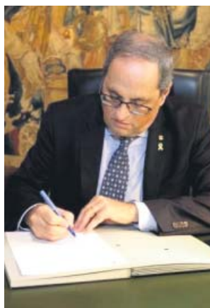
El presidente de la Generalitat, Quim Torra.