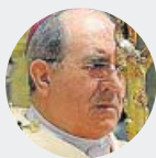
JUAN JOSÉ ASEÑO Arzobispo de Sevilla