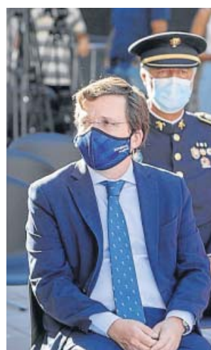
José Luis Martínez-Almeida, hace unos días, en un acto.

Consulta la última hora de todas las noticias relacionadas con el virus en nuestro país en la web 20minutos.es