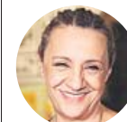
BLANCA PORTILLO Actriz

«Puedes ir en un AVE o un metro abarrotado, pero hay que reducir el aforo de los teatros, lo cual es un error»