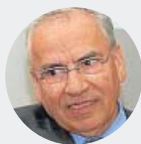
ALFONSO GUERRA Exvicepresidente del Gobierno