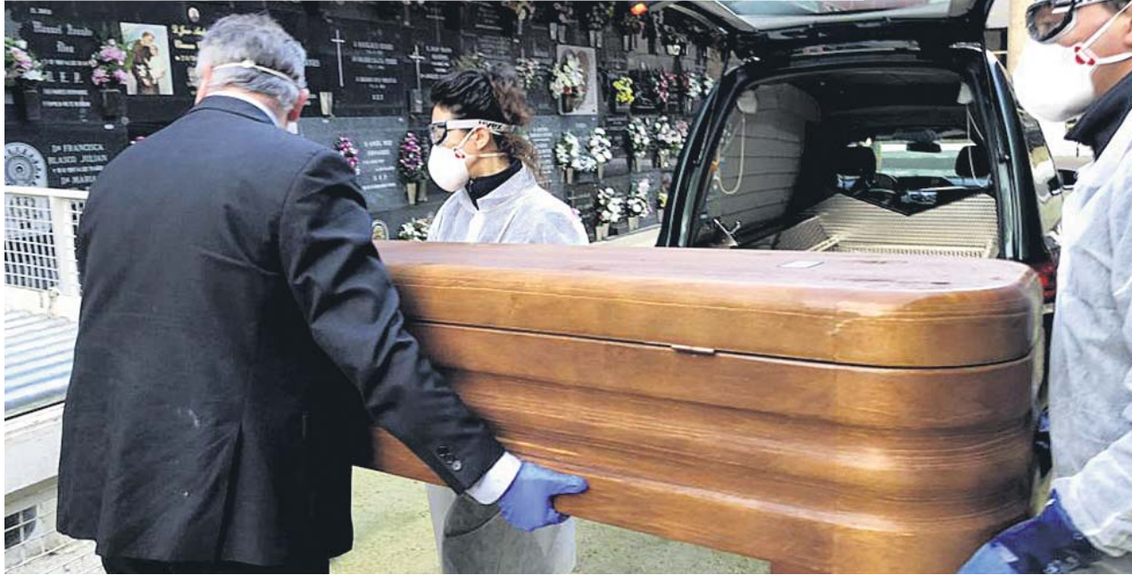
Trabajadores de una funeraria de Zaragoza trasladan el ataúd de un fallecido por coronavirus hasta el nicho.

El gasto medio de un entierro sencillo en España ronda los 3.500 euros, pero si es por Covid-19 supone unos 500 euros más