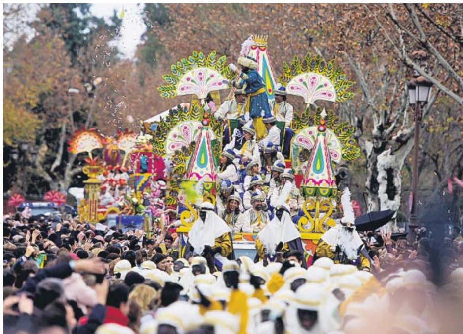
El Rey Baltasar recorre las calles de Sevilla durante la Cabalgata del año 2018.