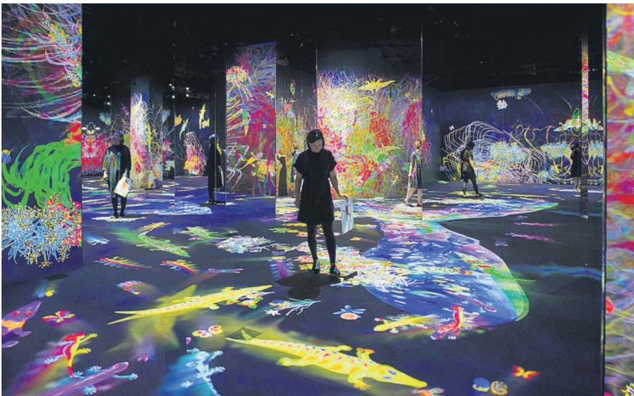
Imagen de uno de los proyectos del colectivo nacido en Japón teamLab. CAIXAFORUM