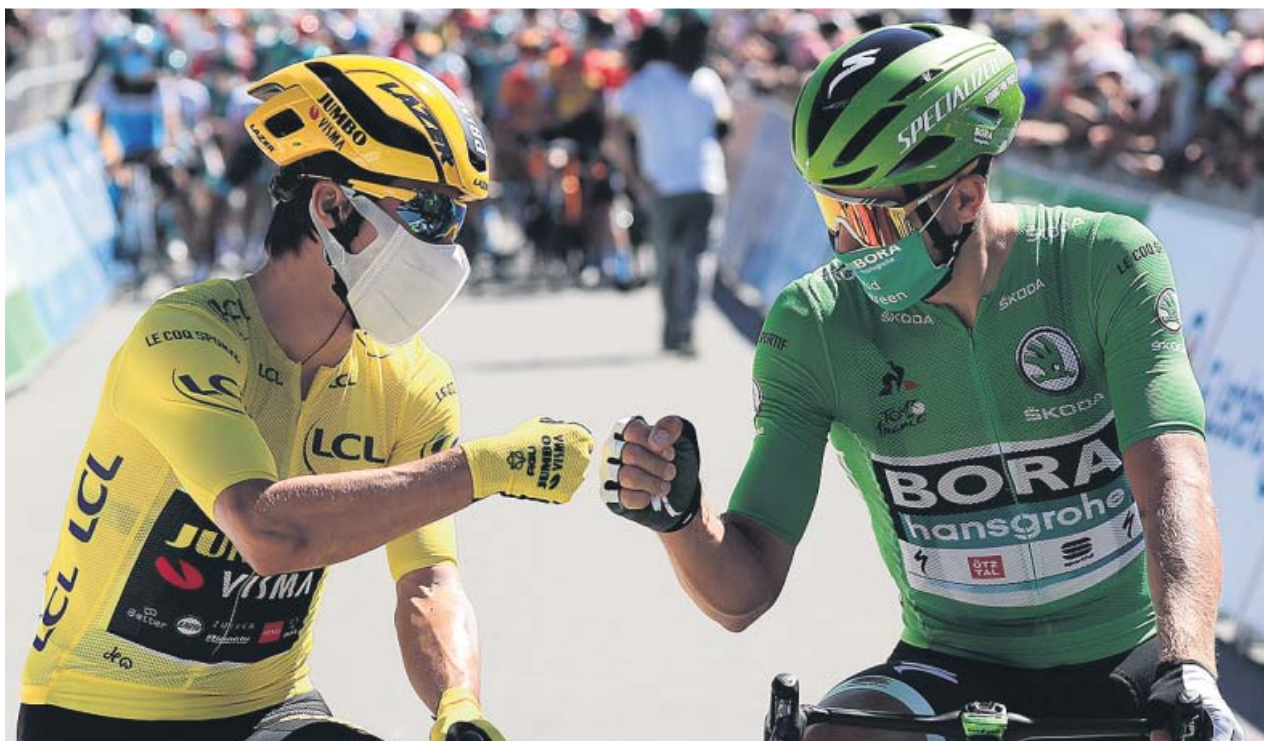
Roglič (izq.) y Sagan (dcha.) se saludan al comienzo de la etapa.