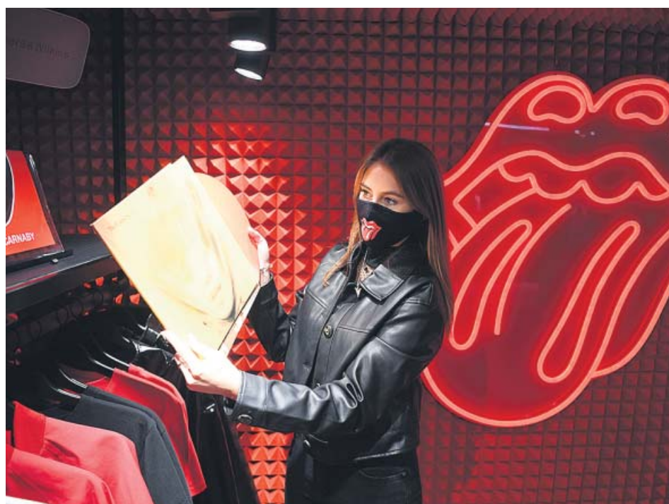
Interior de la tienda RS No. 9 Carnaby, en la ciudad de Londres.

El grupo británico de rock The Rolling Stones cuenta desde hoy con una tienda temática en la emblemática calle Carnaby de Londres. Entre los productos de merchandising hay camisetas, cazadoras, paraguas, agendas y hasta mascarillas contra la Covid-19 con la icónica lengua de la banda; estas últimas se pueden adquirir por 15 libras (16,8 euros). También se vende por casi 2.000 libras (2.240 euros) un dibujo de la misma lengua firmado por su creador, John Pascher. ● R. C.