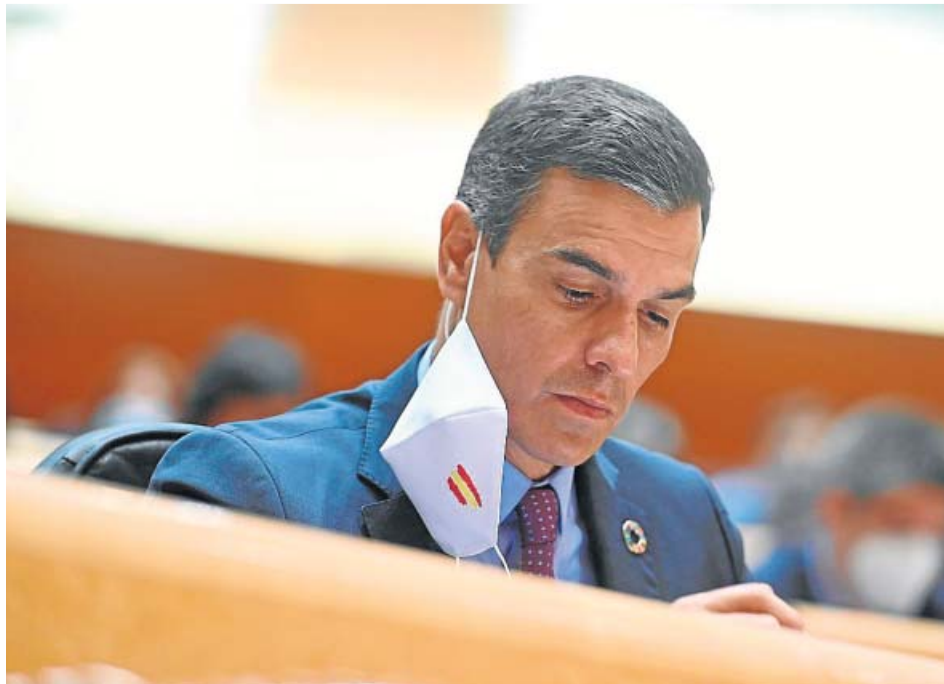
El presidente del Gobierno, Pedro Sánchez, ayer en el Senado.

Tras la ronda de contactos de la semana pasada, el presidente tiene el compromiso de Cs, del PNV o de Más País de que negociará las cuentas. ERC ex-