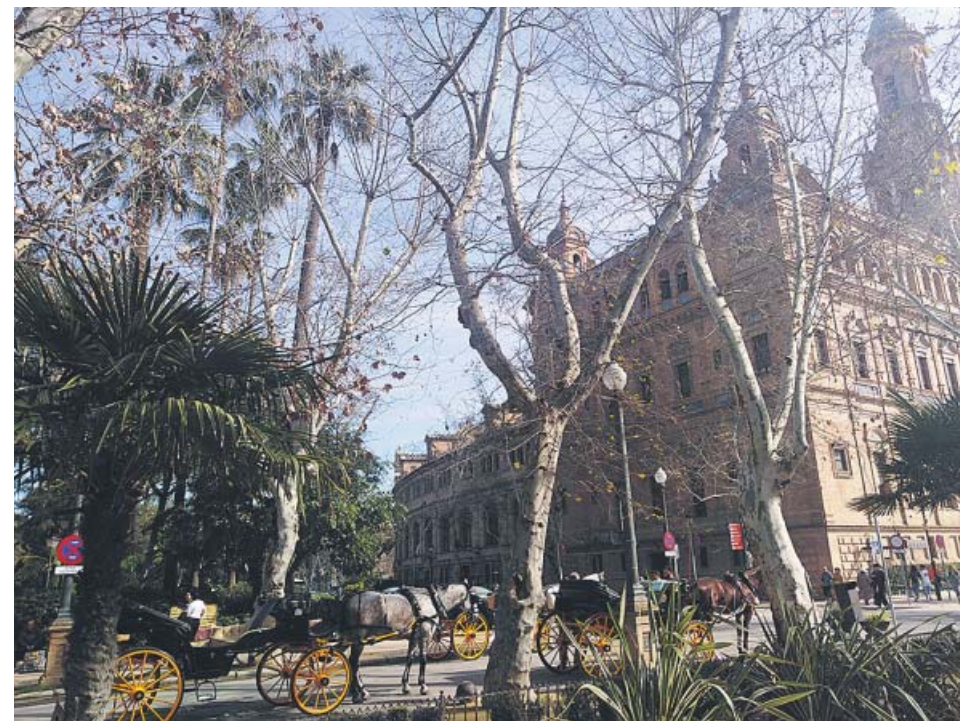
Parada de coches de caballo junto a la Plaza de España. B. R.

Ayer se publicó en el Boletín Oficial de la Junta la convocatoria del programa de ayudas al alquiler a víctimas del machismo, personas sin hogar y en situación vulnerable. Las solicitudes ya se pueden mandar. El máximo será de 500 €/mes más 200, como mucho, para gastos.