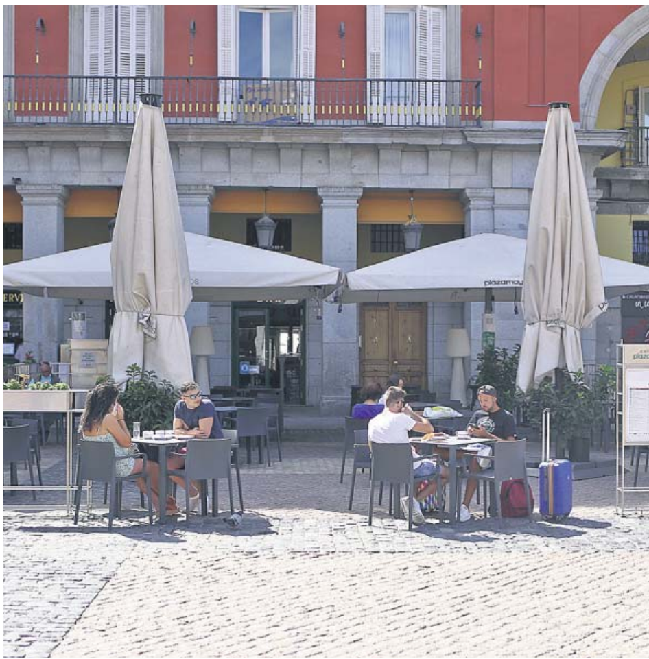
Turistas desayunan en una de las terrazas de la Plaza Mayor de Madrid. JORGE PARIS

3 ¿Qué medidas reales piden? Prorrogar los ERTE y modificarlos, medidas fiscales, vales para que los ciudadanos gasten, menos restricciones y ayudas directas. ● J. L. MACÍAS