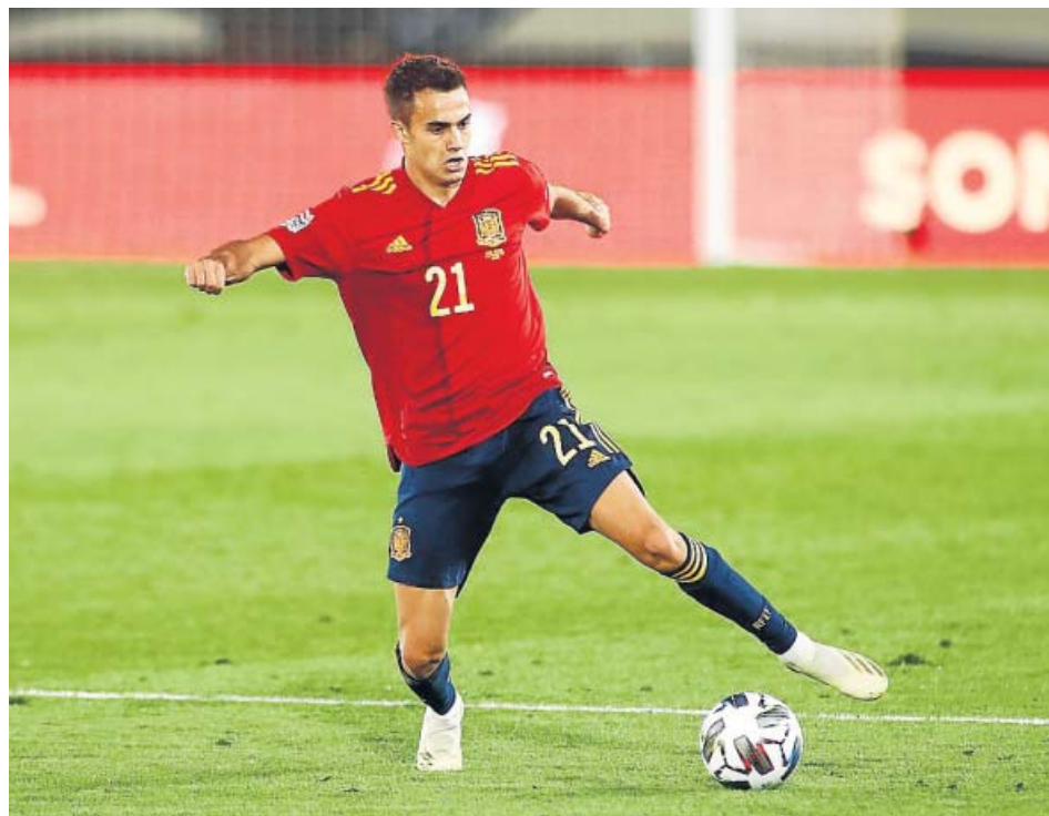
Sergio Reguilón en el partido de España ante Ucrania el pasado domingo.

El galo es, por lo tanto, totalmente indiscutible, mientras que el otro puesto es a priori para Marcelo Vieira. El brasileño es una leyenda del conjunto madridista al que le queda una temporada de contra-