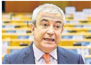
Luis Garicano (Cs).

Luis Garicano sostuvo que «debemos estar orgullosos de la respuesta» de la UE ante esta crisis. «Transmitimos un mensaje a los ciudadanos para salir de esto juntos», pero no todo está resuelto, pues el dinero «hay que gastarlo bien». Insistió que el Parlamento Europeo asegurará que los fondos «se usen para favorecer a las familias» porque Europa «no es un cajero automático». Para el portavoz de Ciudadanos en la Eurocámara y vicepresidente de Renew Europe lo importante es el cómo a partir de ahora. Y repitió una idea: «El reto ahora es gastar bien el dinero del plan de recuperación: para mejorar en empleo, sanidad, educación, no para convertir a los amigos de algunos en élite empresarial», en una crítica a Pablo Iglesias. ●