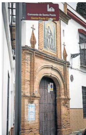
Fachada del convento de Santa Paula, en Sevilla.

Y es que las monjas han quedado confinadas después de detectarse un caso positivo en una de ellas, lo que ha obligado al resto a aislarse, más si cabe, hasta tener los resultados de las pruebas PCR que se van a realizar hoy mismo, tal y como confirmó ayer la Archidiócesis de Sevilla a la agencia Europa Press, ya que se considera a las religiosas contactos estrechos de la persona contagiada.