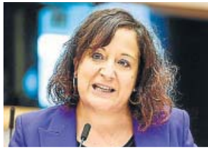
Iratxe García (PSOE).

Tras el discurso de Ursula von der Leyen, algunos eurodiputados españoles tomaron la palabra. La portavoz de los socialdemócratas, Iratxe García, empezó hablando de Moria y el euro para explicar las prioridades. «La respuesta a esta crisis no va a ser la misma que en 2008, esta vez estará centrada en las personas y en la solidaridad». Solo tuvo cinco minutos para intervenir. «Es el momento de invertir en esa Europa resiliente», dijo García, que insta a la Comisión a cumplir con todos los retos que se plantean, en todas las esferas. Asimismo, se posicionó a favor de ese salario mínimo que puso sobre la mesa Von der Leyen y que, además, formaba parte del programa electoral de Josep Borrell en las elecciones europeas del año pasado. ●