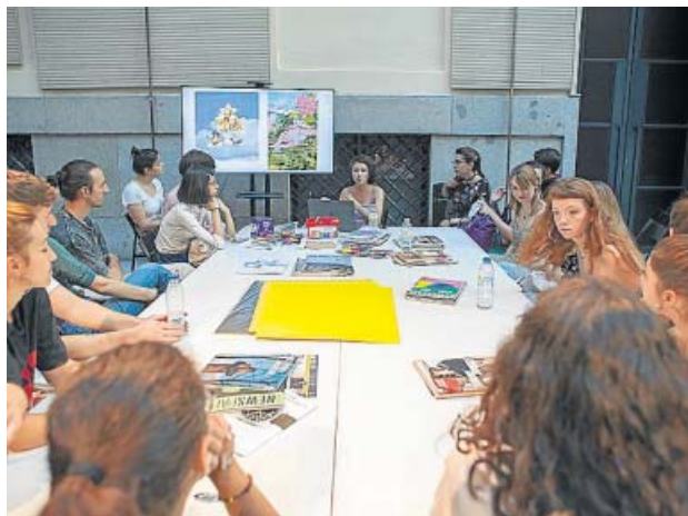
Taller Cómico Virtual de Puwerty 2019. PUWERTY