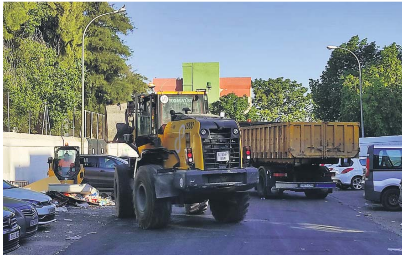
Labores de limpieza por parte de Lipasam en el Polígono Sur.