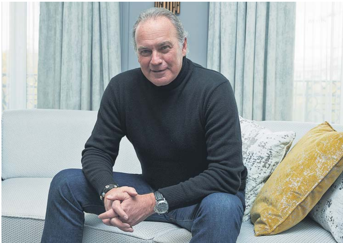
Bertín Osborne, presentador del programa Mi casa es la tuya , en una imagen de archivo.