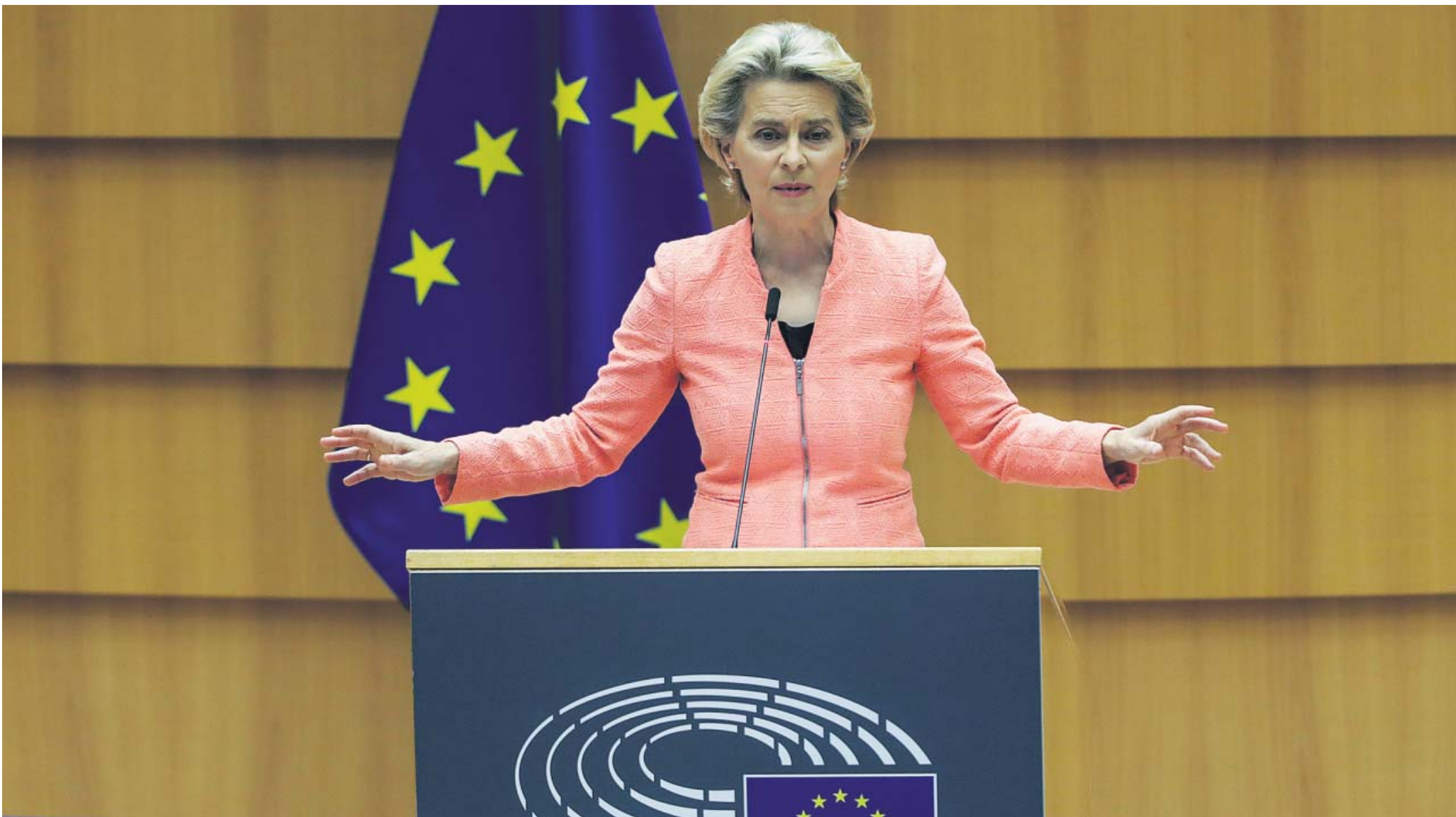
La presidenta de la Comisión Europea, Ursula von der Leyen, ayer en Bruselas durante su discurso ante el Parlamento Europeo con motivo del debate sobre el estado de la Unión.