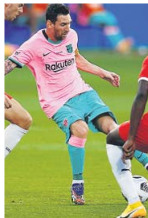
Messi durante el partido de ayer ante el Girona.

Pero Leo Messi, por mucho que haya querido irse este verano, prometió entrega y ya la da. Fue uno de los nueve sustituidos en el minuto 63, pero antes dejó grandes pases y dos goles. El primero, de bella factura para poner el 2-0 justo antes del descanso. Con la derecha, su pierna menos buena, ajustó el balón al palo y ce-