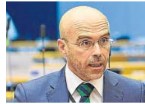
Jorge Buxadé (Vox). P. EUROPEO

En la ronda de respuestas por parte de los eurodiputados intervino también Jorge Buxadé. El eurodiputado de Vox comentó que el discurso de Von der Leyen estuvo completamente vacío. «¿En qué mundo viven?», se preguntó, y pidió olvidarse de las «agendas globales» porque «Bruselas hundirá a toda Europa» si no sale a la calle. «Toca la ley y el orden», expresó en uno de los mensajes más críticos con la presidenta Ursula von der Leyen. «Bla, bla, bla», ironizó, criticando además el beneplácito de «populares, socialistas y liberales» a la presidenta de la Comisión. «Es, además, un discurso peligroso», expresó el portavoz de Vox, que mencionó en el Hemiciclo «las colas del hambre» que «se están viendo en España» a causa de la crisis. ●