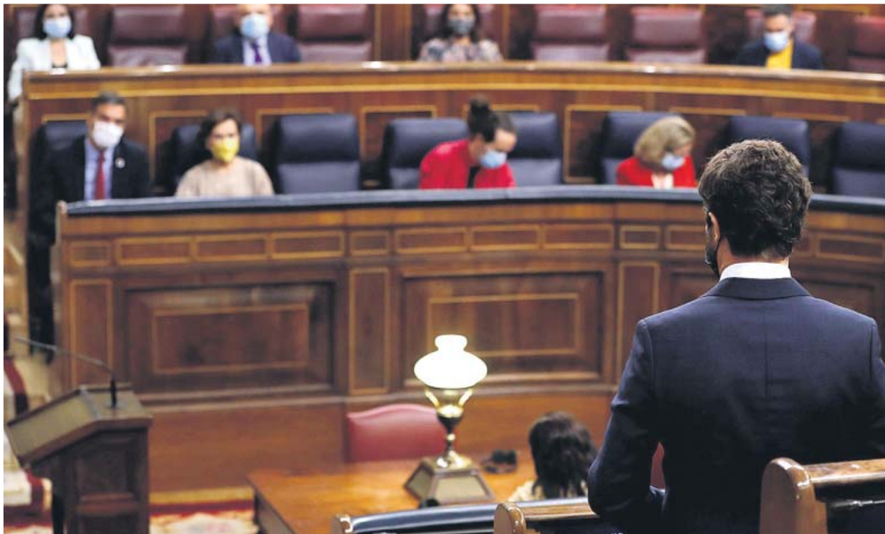
El líder del PP, Pablo Casado (en primer plano), se dirige a la bancada del Gobierno, ayer en la sesión de control en el Congreso.