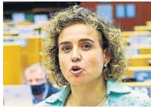
Dolors Montserrat (PP). P. E.

La portavoz del PP en el Parlamento Europeo, Dolors Montserrat, explicó que la pandemia es «el mayor desafío de nuestras vidas» y que la UE tiene que estar «al lado de quienes más lo necesitan» porque «Europa no puede permitirse una generación perdida». Según ella, «hay que tomar ya medidas urgentes» para recuperar la economía y el empleo. «Necesitamos que los gobiernos nacionales hagan sus deberes». Señaló que la pandemia ha causado «daños inimaginables porque miles de familias han perdido seres queridos y millones de personas han perdido su trabajo», y recordó que «también ha acelerado fenómenos que ya estaban produciéndose y que socavaban la fuerza de la UE y el futuro de los ciudadanos europeos». ●