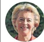
URSULA VON DER LEYEN Presidenta de la Comisión Europea

Los peritos médicos y de la Guardia Civil que declararon ayer en el juicio por el asesinato de la niña Naiara en Sabiñánigo (Huesca) descartaron cualquier posibilidad de que la muerte se produjera de forma accidental, pues la causa de la muerte fue un traumatismo «brutal».