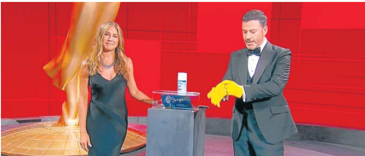
Jennifer Aniston y el presentador de la ceremonia de los Premios Emmy, Jimmy Kimmel.