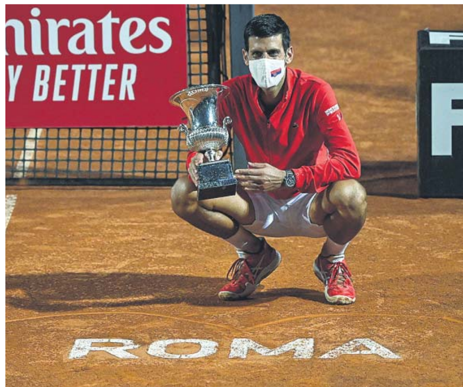
Djokovic posa ayer en la pista romana con su trofeo.

En la final femenina ganó la rumana Simona Halep, número 2 del ranking mundial, tras la retirada por lesión de la checa Karolina Pliskova. ●