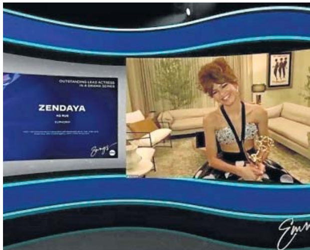
La actriz Zendaya agradece su galardón.