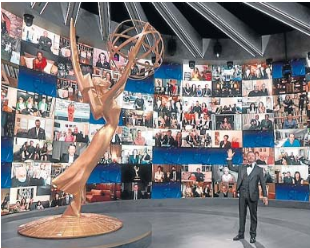
Los invitados se conectaron a la gala desde sus casas.