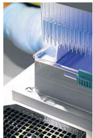
Vista de un análisis en un laboratorio.

Según indican, la transmisión aérea es una de las formas más comunes de contagiarse de coronavirus por el contacto con otra persona que esté infectada. Ese contacto, además, no tiene por qué ser únicamente fí-