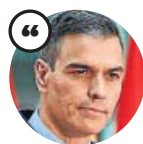
PEDRO SÁNCHEZ Presidente del Gobierno

«No es tiempo de reproches, sino de unidad. La respuesta que demos solo tiene el objetivo de salvar vidas»