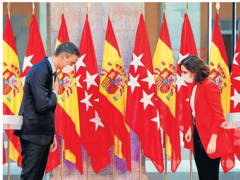
Pedro Sánchez y Díaz Ayuso se saludan antes de su comparecencia conjunta.

des autónomas, con unas «normas básicas» para que los ciudadanos «sepan a qué atenerse».