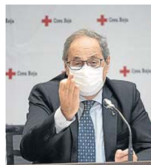
Quim Torra, ayer, durante un acto de Cruz Roja.

madrileña, Isabel Díaz Ayuso, pero también le reclamó que establezca «medidas más estrictas», en concreto, «que no se permita a nadie salir ni viajar a Madrid si no se tiene la certeza de que es negativo» en un test PCR. «Para mí, no es