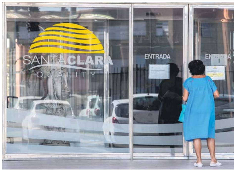
Una mujer lee los carteles informativos de una residencia del Puerto de Santa María.

20M.ES/CORONAVIRUS Consulta en nuestra web toda la información sobre la evolución de la pandemia de Covid-19.