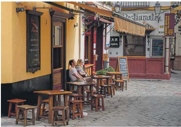
Reapertura del bar Casa Román, en el barrio de Santa Cruz.

El Ayuntamiento da luz verde a una medida a la que podrán acogerse en unos días unos 60 locales de la capital