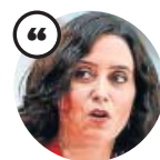
ISABEL DÍAZ AYUSO Presidenta de la Comunidad de Madrid

«Necesitamos más recursos y estrategias para no llegar a un estado de alarma, que sería la muerte para Madrid»