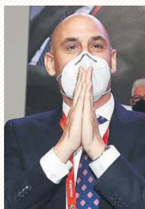
Rubiales, en la Asamblea celebrada ayer.

equivocó gravemente sacando a Lopetegui a dos días del Mundial de Rusia. Esperemos que haya aprendido todas las duras lecciones de estos dos años largos. Con Luis Enrique sí ha sabido estar a la altura de las duras circunstancias, por malas que fueran las formas con Robert Moreno. Después del paseo militar en la Asamblea, ahora tiene una gran misión que cumplir: intentar acabar con el clima bélico que rodea a las instituciones del fútbol. Lo que menos necesita este país, en este momento, son más trincheras. Las están dibujando entre colores políticos, entre autonomías y ahora entre barrios. La proyección del fútbol es tan profunda que la manera de gestionar tiene mucha más importancia de lo que