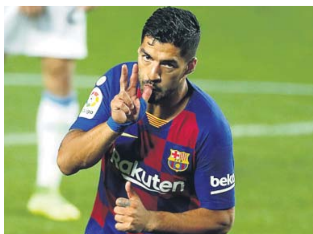
Luis Suárez celebra un gol con el FC Barcelona.

Ya el domingo por la noche, la Juve confirmó que el pasaporte italiano de Suárez no llegaría a tiempo, requisito indispensable para que el charrúa fuera bianconero , lo que llevó el futuro de Suárez a otro destino. El Atlético estaba esperando su oportunidad y esta llegó. Las negociaciones entre el FC Barcelona y el delantero uruguayo culminaron por fin en un acuerdo en el que la entidad culé le paga como finiquitó la mitad de su ficha, una cantidad cercana a los 15 millones de euros brutos.