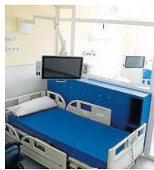
Una de las habitaciones nuevas del Macarena. HVM

Según un comunicado del centro sanitario, el equipamiento de las nuevas habitaciones se adapta a las necesidades de seguridad sanitaria