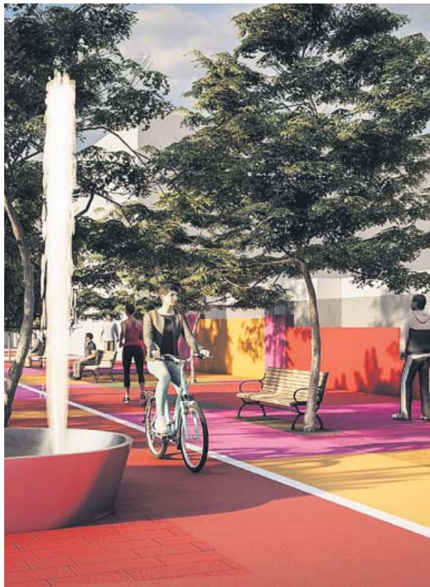
Recreación de la futura avenida de la Cruz Roja.

Todo ello, explica el Ayuntamiento, servirá para ganar un «gran eje peatonal» en la Macarena que conectará con el Casco Antiguo de la ciudad, para mejorar la movilidad en estos distritos y, especialmente, para reducir el tráfico rodado en la Ronda Histórica. No en vano, el cambio en la Carretera de Carmona eliminará el giro a la izquierda desde la ronda, que es utilizado por unos 7.500 coches al día que habitualmente acceden a es-