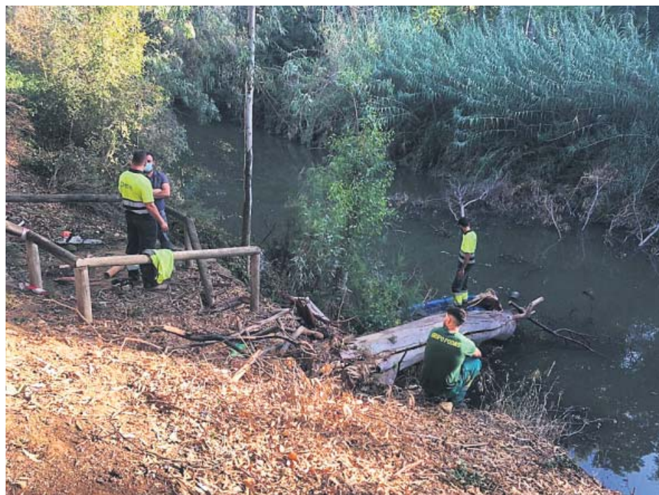
Recogida de los árboles que habían caído al río.

Los tres grandes eucaliptos que durante el último temporal se precipitaron sobre la cuenca del Guadaíra ya no entorpecen el cauce del río, puesto que han sido retirados. Muchos de ellos fueron plantados en 1929 con motivo de la Exposición Universal de Sevilla. Ahora, el Ayuntamiento alcalaño plantará en las márgenes especies autóctonas de olmo común, álamo blanco, sauces y fresnos. La idea es reforzar el bosque para proteger la cuenca, la humedad y la vida en el parque de Alcalá. ●