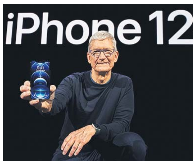
Tim Cook presenta el iPhone 12.

Aunque de momento la velocidad que alcancen estos dispositivos dependerá de cada región, ya que el 5G no está todavía a disposición de los