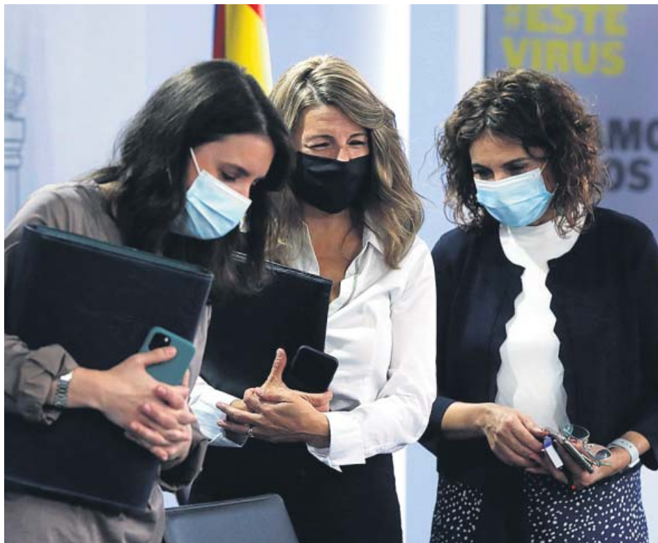
Las ministras Irene Montero, Yolanda Díaz y María Jesús Montero.

«A partir de hoy, se acabó que hombres y mujeres puedan percibir retribuciones diferentes», aseveró la ministra de Trabajo, Yolanda Díaz, al término de la reunión del Gobierno en la que se dio luz verde a los dos reales decretos. Estos se han negociado con los agentes so-