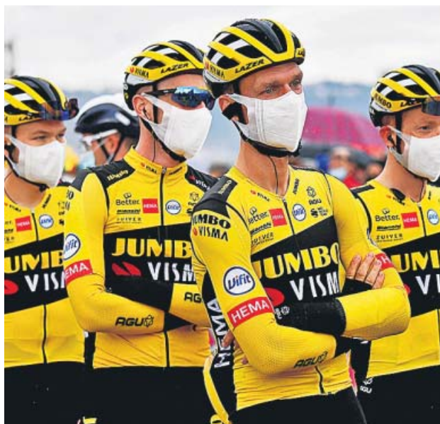
El equipo Jumbo se retiró ayer del Giro.

Además, no quedó ahí la cosa: también dieron positivo seis miembros del personal de los equipos técnicos, cuatro del Mitchelton-Scott, uno del AG2R-La Mondiale y uno del Ineos Grenadiers.