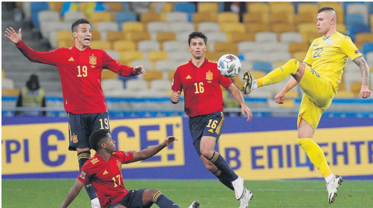
Zubkov ante Rodri, Ansu Fati y Rodrigo Moreno en el Ucrania-España.