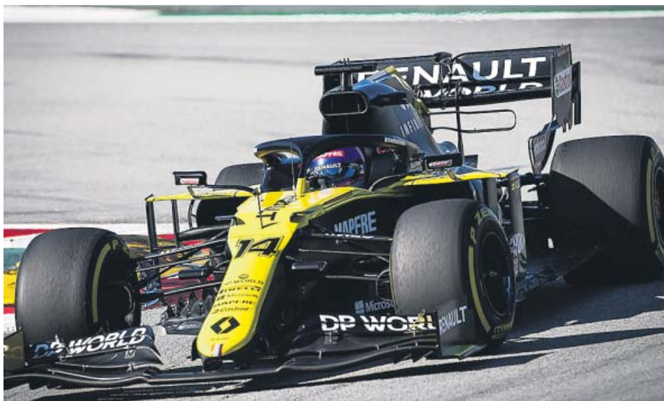
Fernando Alonso durante la jornada de rodaje de ayer con el Renault.