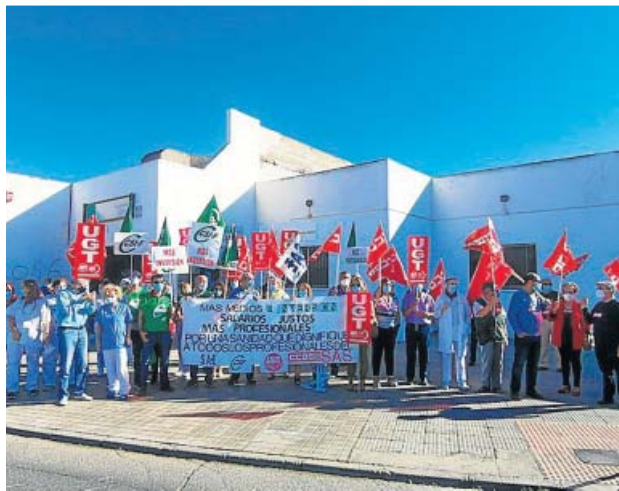
Protesta a las puertas de un centro en Almería.

Ante esta situación, reclaman «recuperar el diálogo social para facilitar acuerdos» y una reforma de la Atención Primaria que «recupere su esencia original, dé protagonismo en lo asistencial y en la gestión a sus trabajadores y se sustente en una financiación adecuada». En este sentido, los sindicatos