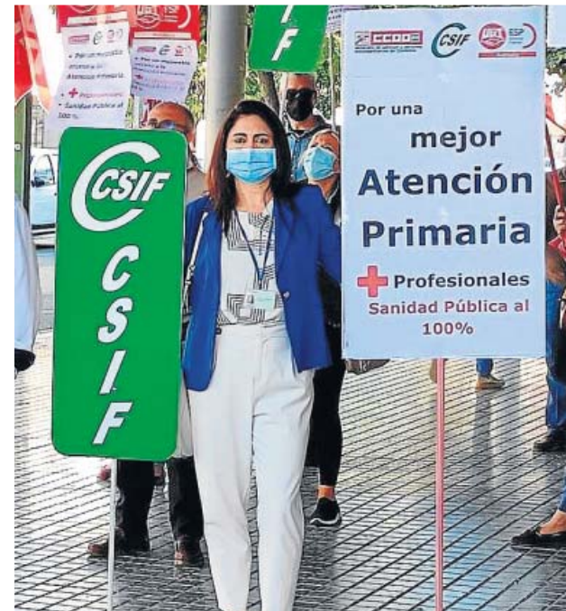
Los sindicatos piden la contratación de más personal. CSIF

daños de los centros de salud se repetirán el día 20 de este mes en los hospitales y el día 29 ante la sede del Servicio Andaluz de Salud (SAS), en Sevilla. ● R. S.