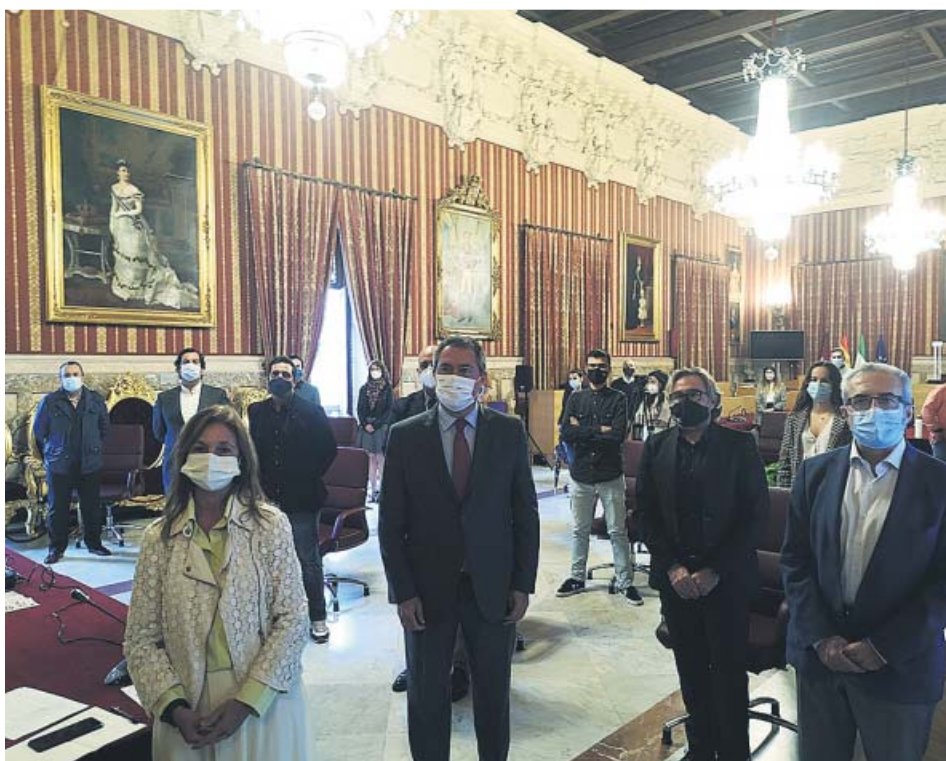
El alcalde de Sevilla, Juan Espadas (2i), en la presentación del programa Redes+.

EL AYUNTAMIENTO ha lanzado este mes otra convocatoria del plan Redes+ para 270 beneficiarios