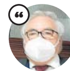
MANUEL CASTELLS Ministro de Universidades

«Algunas universidades han tenido que cerrar facultades y en cambio no se han cerrado los bares que había a lado»