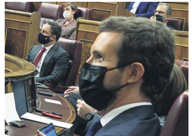
Pablo Casado, con Abascal de fondo, en la sesión de ayer.

El PP mantendrá la incógnita hasta el final. Ya con la moción en marcha, el voto de los populares sigue siendo, quizás, la gran duda de la moción de censura. De las tres opciones, una ya está descartada —ya lo estaba, de hecho— y así lo repitió ayer el secretario general del partido, Teodoro García Egea. «No la apoyaremos», sentenció, pero fue más allá. «Es una pérdida de tiempo», sostuvo un Egea especialmente duro con Abascal y su discurso. «Es importante saber sumar», y en cambio no aclaró si los suyos se posicionarán en contra u optarán por la abstención.