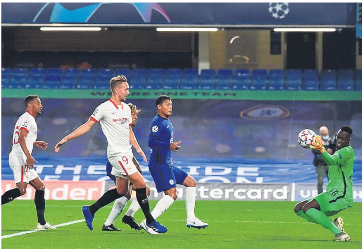
De Jong busca el gol en el partido ante el Chelsea ante la oposición del portero, Edouard Mendy.