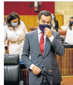
Juanma Moreno, ayer en el Parlamento andaluz.

Por último, el presidente andaluz aprovechó para pedir al Ejecutivo central la apertura de los Centros de Internamiento de Extranjeros (CIE) para poder aislar en los mismos a los inmigrantes en situación irregular que den positivo. ●