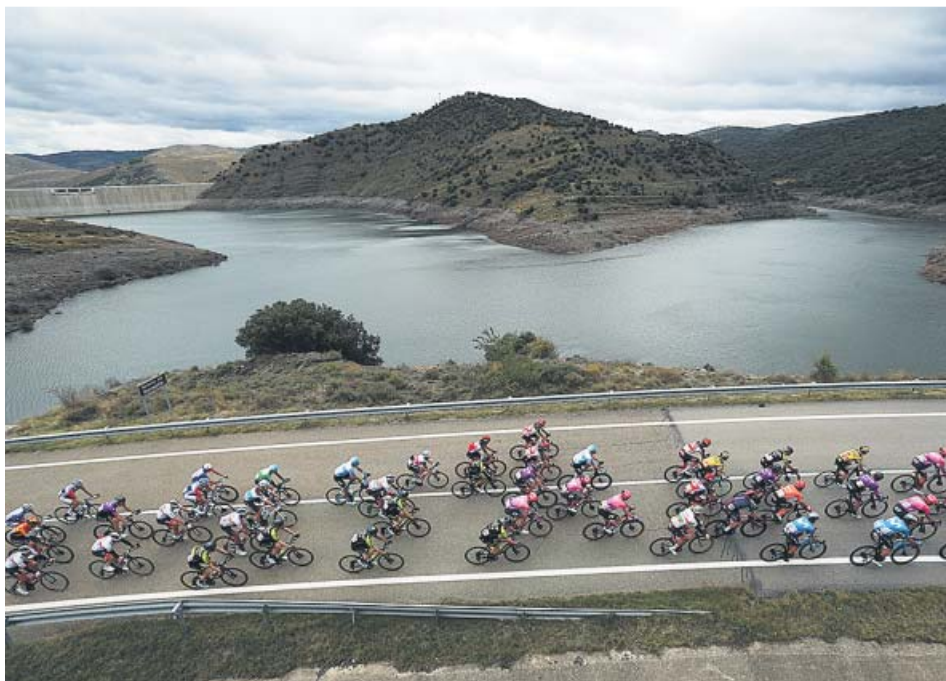
El pelotón, durante un tramo de la etapa de ayer.