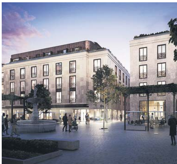
Recreación de la futura plaza, totalmente peatonalizada.

Mientras, el acceso de vehículos quedará restringido tanto en San Pablo, desde la calle Bailén, como en la calle Murillo, además de en la propia plaza, permitiendo so-