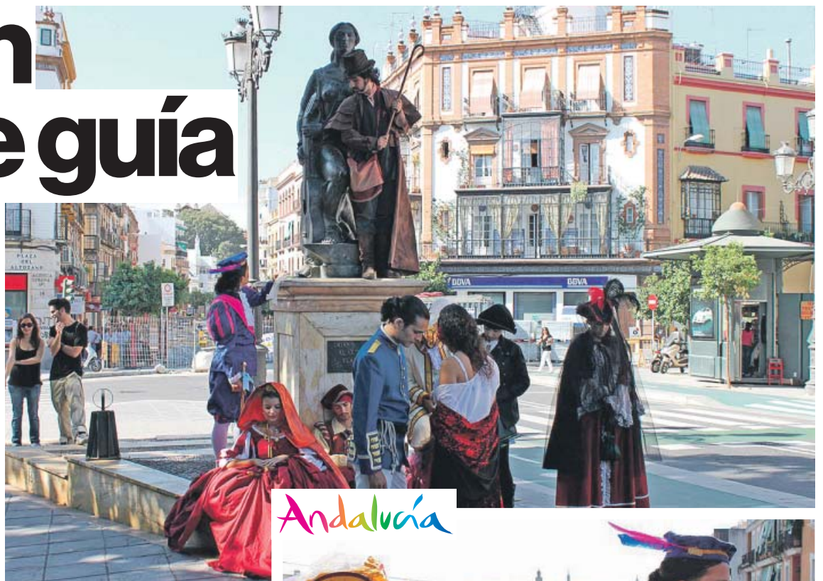
Cada 31 de octubre se representa la obra de José Zorrilla en la ciudad.

En la Calle de Calatrava se encuentra el convento donde Inés estaba internada y su rapto ocurre en la plaza de Santa Marta. En el mismo barrio se puede visitar la casa de su padre.