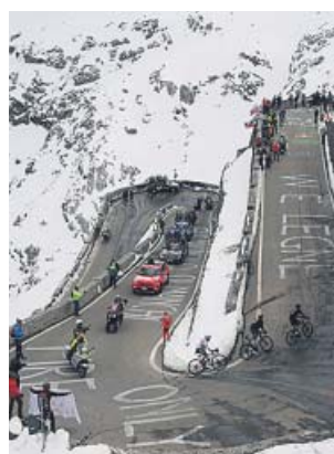
La impresionante y nevada subida al Stelvio.

Los continuos intentos de ataque en ese grupo cristalizaron después en otra fuga más selectiva, de diez corredores, en la