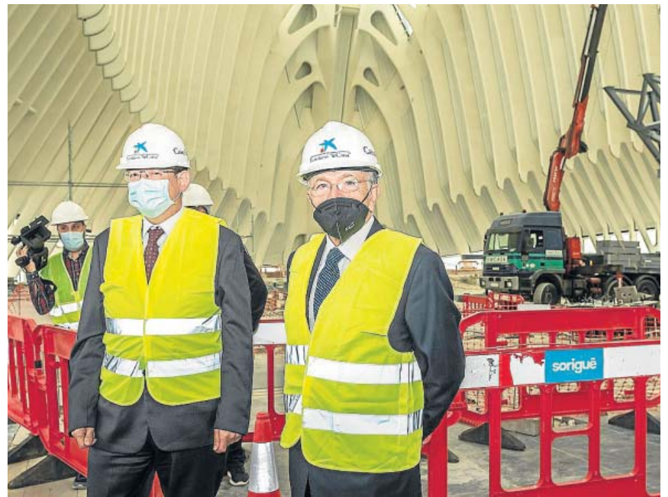
El presidente valenciano, Ximo Puig, y el de la Fundación La Caixa, Isidro Fainé.

las víctimas, el objetivo de Igualdad incluye equiparar a los huérfanos por un feminicidio sexual, es decir, a los hijos de mujeres asesinadas tras una agresión sexual, con aquellos que pierden a su progenitora en casos de violencia de género. De esta forma, la ley prevé incorporar una prestación de orfandad para estos menores.