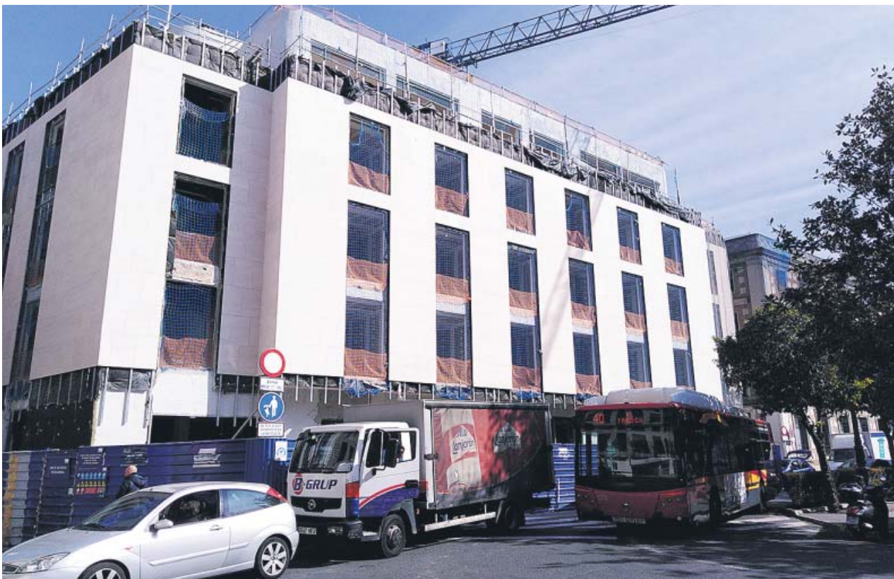
Estado actual de la plaza de la Magdalena, donde se construye un nuevo hotel de cinco estrellas. B.R.