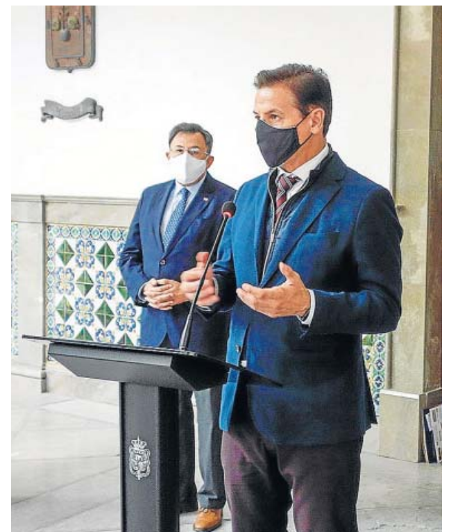
El alcalde de Granada, Luis Salvador, ayer.

El alcalde de Granada, Luis Salvador, valoró por su parte como lógico que la Junta haya optado por prorrogar diez días más la suspensión de las clases teóricas presenciales de la Universidad, así como el toque de queda en la ciudad a fin de «reducir la movilidad» y así contribuir a «acabar con la propagación del virus». Asimismo, hizo hincapié en que los ciudadanos han de dar «un paso adelante» para reforzar la observación de las medidas de seguridad estipuladas contra el coronavirus.