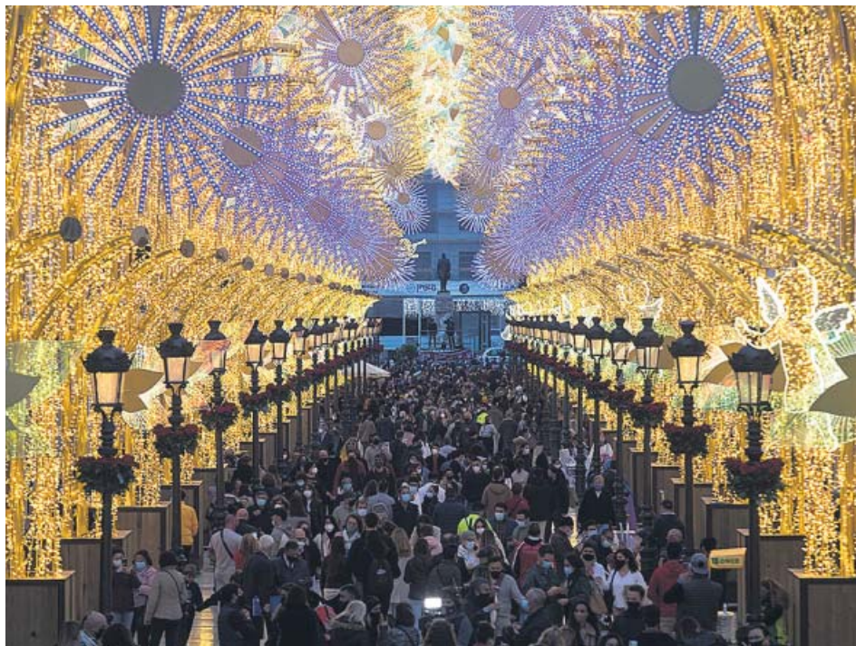
Aspecto que presentaba el viernes la calle Larios de Málaga con motivo del encendido de las luces.

LA NAVIDAD preocupa por una posible relajación social como la vivida este pasado fin de semana. LAS MEDIDAS deben seguir para evitar un repunte, según los expertos, que prevén que llegue una 3.ª ola. LA VACUNACIÓN de la mayor parte de la población se hará en verano, cuando se relajarían restricciones.