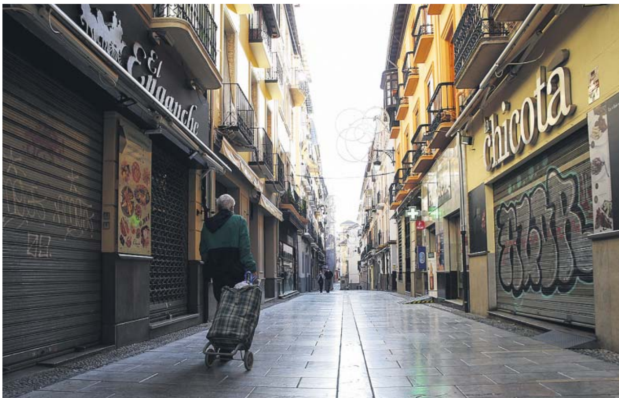
Comercios cerrados en una céntrica calle de Granada.