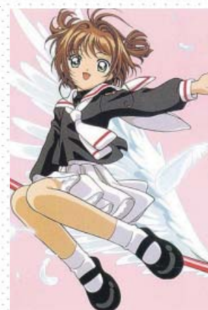
Sakura Kinomoto es la protagonista del anime.

franquicia, es parte de su encanto), sino por la guerra que enfrenta a los fans ya veinteañeros de show contra los viejales que aún juramos por Sailor Moon . Pese a ello, y aunque servidor quiere a Usagi Tsukino como a una hermana, tiene que admitirlo: con su mezcla de drama, fantasía y jovialidad, esta serie es una introducción perfecta para que hijos, sobrinos o hermanos pequeños (o uno mismo, qué diantre) descubran los placeres de la animación japonesa.