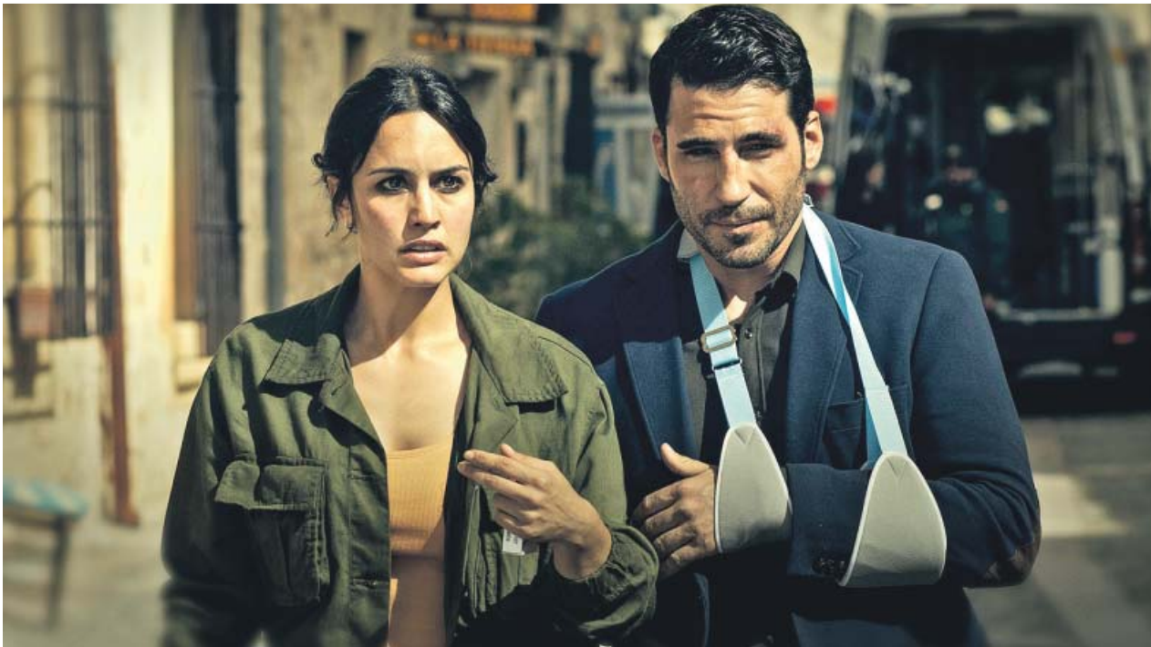
Los actores Megan Montaner y Miguel Ángel Silvestre.