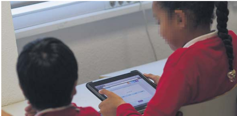
Una profesora da clases a alumnos de Primaria en un colegio.

LOS ALUMNOS de 4.º sacan una puntuación de 511, once puntos inferior a la media de la UE UN ESTUDIO internacional también los sitúa por debajo de la media europea en Ciencias