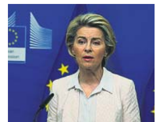
Ursula von der Leyen.

El anuncio de Von der Leyen llegó después de nuevos días de «complicadas negociaciones» de un pacto sobre la pesca o pa-