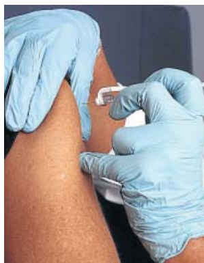
Una persona recibe una vacuna en el hombro. EP

el plazo de un mes, que los datos provisionales muestran hasta un 97% de eficacia», aseguró el portavoz de Bio Farma, Iwan Setiawan. No obstante, no aportó información sobre exactamente cuántos participantes se infectaron durante el ensayo, que involucra a 1.600 personas. Esperan que la agencia de alimentos y medicamentos de Indonesia emita una autorización de uso de emergencia a finales de enero antes de comenzar la vacunación masiva.