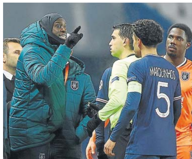
Webbo discute con el árbitro durante el incidente de ayer.

Su explicación no convenció a los jugadores del conjunto turco que, liderados por un miembro de su cuerpo técnico, reprocharon al