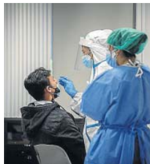
Un joven se somete a una prueba.

siendo elevada, con 33, once más que el día anterior. También aumentó el número de ingresados en las plantas de los hospitales andaluces, con 1.546 (14 más que el lunes); pero se redujo el de hospitalizados con Covid en unidades de cuidados intensivos y 340 (13 menos).