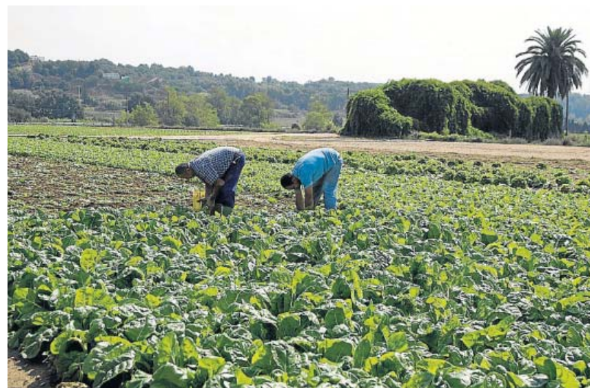
Dos agricultores de origen extranjero que trabajan en España.