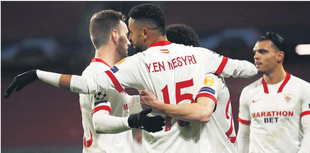
Los jugadores sevillistas se abrazan tras uno de los goles marcados ayer.