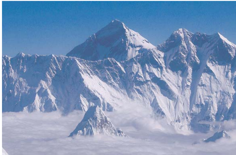
Imagen de la cumbre del Everest nevada, en la cordillera del Himalaya.

Desde Katmandú llegaron a denunciar presiones de su gigantesco vecino del norte para aceptar la altura china, pero después de más de una década de polémica, el año pasado sellaron la paz y acordaron