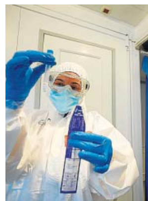
Cribado en la localidad cordobesa de La Carlota.

En lo que respecta a la evolución de la pandemia por la región, la Consejería de Salud y Familias informó ayer de que en Andalucía se contabilizaron