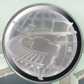
MEDALLA CONMEMORATIVA DE PLATA