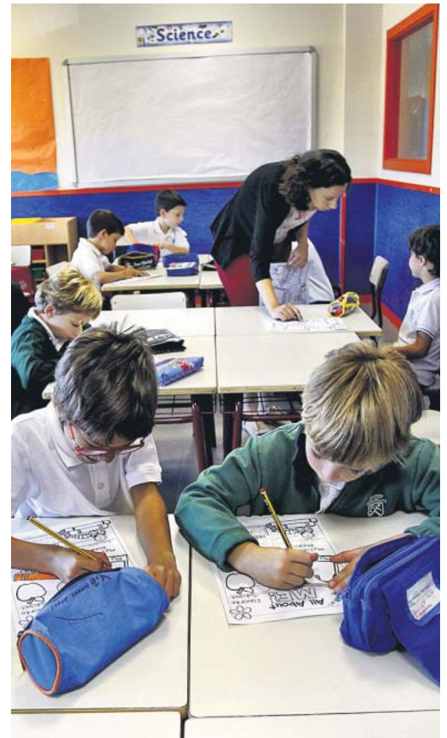
Imagen de archivo de una clase de Primaria.

Otra de las comunidades gobernadas por los populares es Andalucía. Allí, solo se pronunció ayer al respecto la secretaria general de PSOE-A, Susana Díaz, que confía en que su presidente, Juanma Moreno, no cometa la «aberración de vender» la educación pública de la comunidad a Pablo Casado con el fin de «confrontar». Lo hizo a través de Twitter, donde además dijo que para ella el presidente de la Junta de Andalucía «ya ha dado sobradas muestras de no creer en la escuela pública, pero aún puede superarse» si hace lo mismo que Ayuso. ●