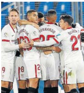
Los jugadores del Sevilla celebran un gol.

Los condicionantes del sorteo evitarán enfrentamientos entre clubes de la misma federación y entre los que hayan coincidido ya en la fase de grupos. Así, Barça, Atlético de Madrid y Sevilla se enfrenta-