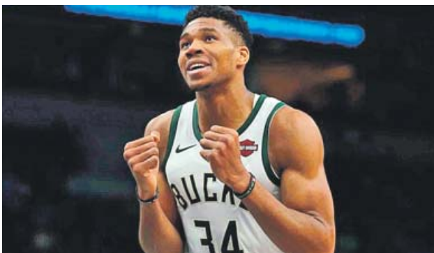
Giannis Antetokounmpo El mayor contrato NBA de la historia