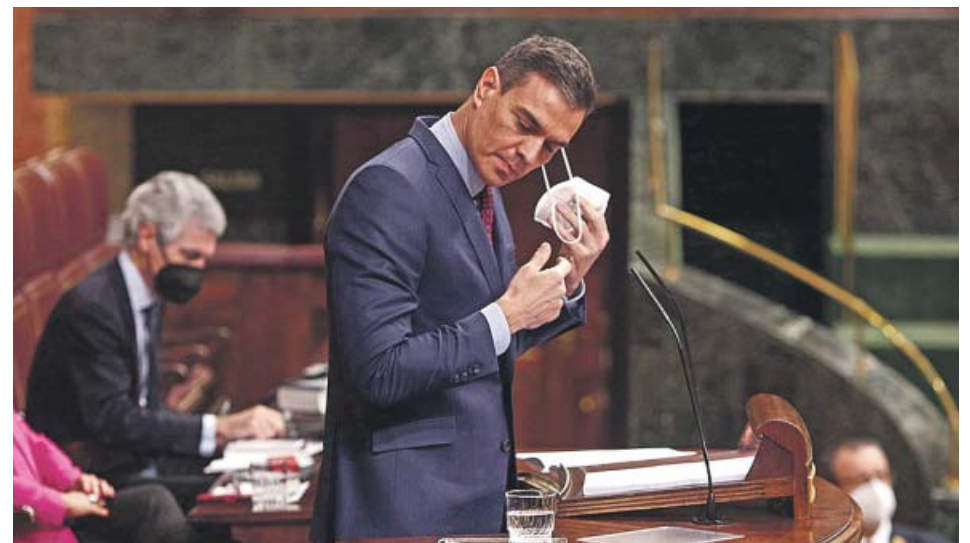
El presidente del Gobierno, ayer en el Congreso.

«Disfrutemos la Navidad en casa», sugirió ante unas fiestas en las que «se decide» si España evita la tercera ola. ● C. P.