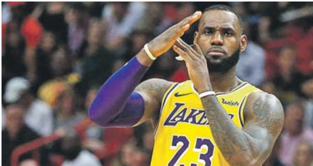
LeBron James El Rey seguirá al menos hasta los 37 años