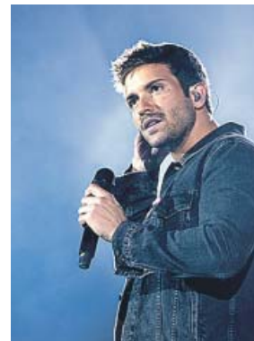
Pablo Alborán, en una imagen de archivo.

Romántico y natural, Pablo tenía ganas de vivir libremente y sin preocupaciones. Harto de justifica-