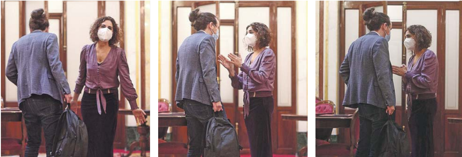
El vicepresidente segundo, Pablo Iglesias, y la ministra de Hacienda, María Jesús Montero, discuten en el Congreso. «No seas cabezón», le llegó a decir ella.