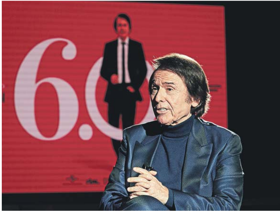
Raphael, durante la entrevista con 20minutos. EDUARDO MÉNDEZ

Él, está claro, ni ha pensado en eso. Ha grabado más de 50 álbumes solo en español. Ha tocado en el Madison Square Garden de Nueva York y en el Teatro Opera de Tokio. Tiene el famoso disco de Uranio –vendió más de 50 millones de copias hasta 1980–. Ha hecho musicales, películas... No se pone límites: «Naturalmente, llegará un día en el que me levantaré y diré: hasta aquí. Pero, tal y como estoy y tal y como van las cosas, eso es muy lejano». La prueba es 6.0, su último álbum, para el que ha rescatado unas cuantas