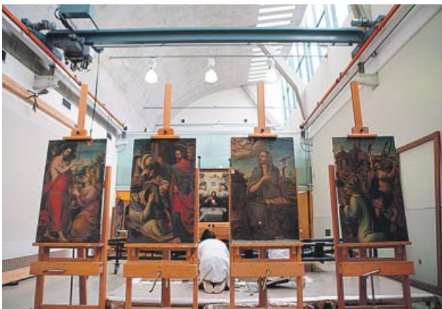
Cuatro de las tablas que se van a restaurar.

Dos esculturas, seis tablas y el zócalo de azulejos han puesto rumbo a los talleres del IAPH, encargado del proyecto