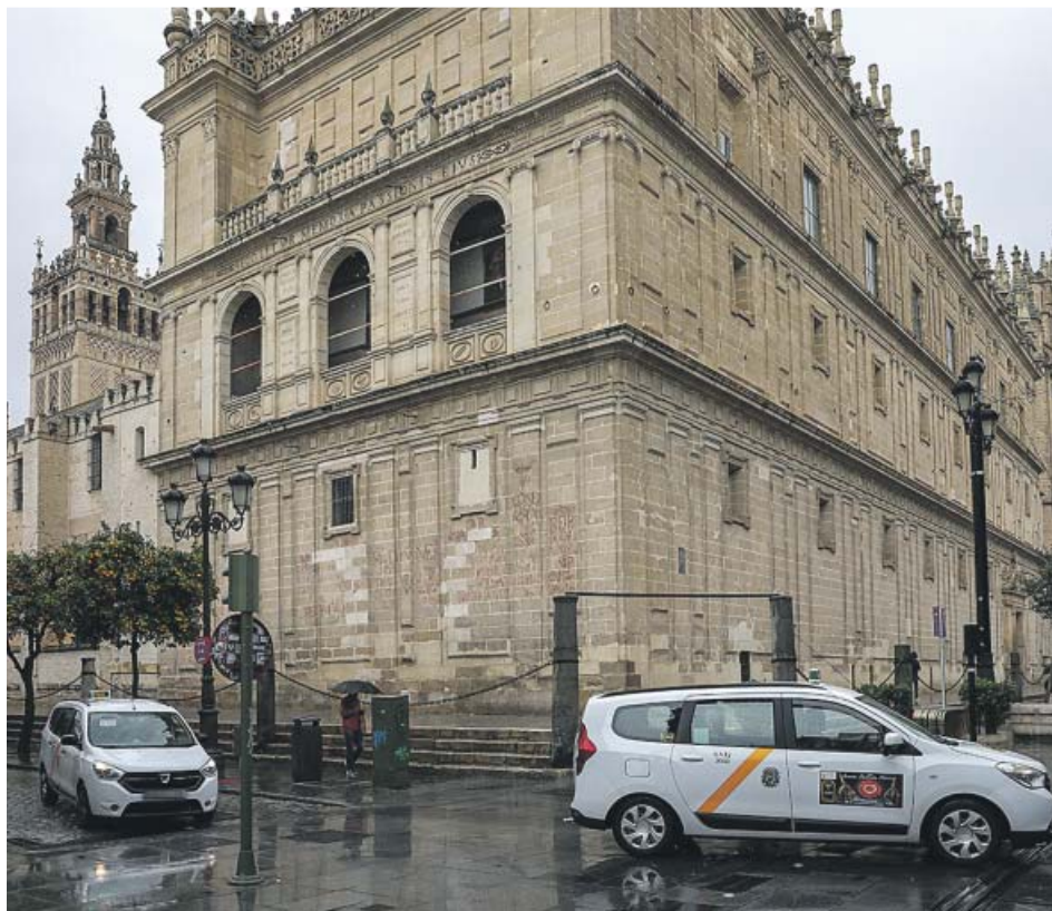
Dos taxis circulan junto a la Catedral de Sevilla.

En el caso de los cocheros, golpeados duramente por la crisis debido a la caída del turismo, el Consistorio va a suprimir la tasa por la utilización privativa, el aprovechamiento especial del dominio público local y la prestación de servicios de las cocheras municipales de caballo. Por esta tasa, los titulares de las licencias de coches de caballos abonaban anualmente cerca de 1.000 euros por conceptos como suministro de energía eléctrica,