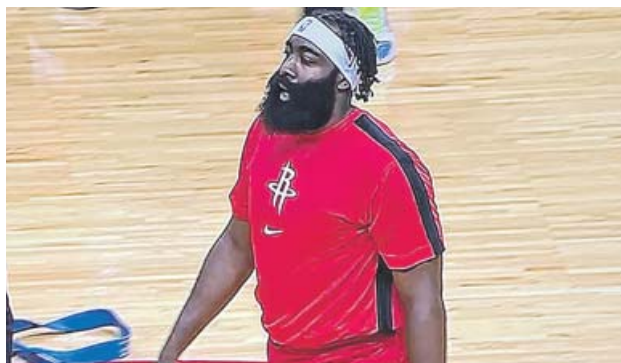
James Harden Quiere un traspaso. Ayer apareció pasado de peso