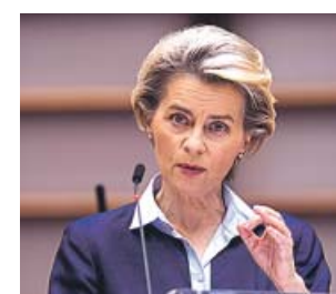
Ursula von der Leyen.

Al mismo tiempo, dio por hecho que la Agencia Europea del Medicamento autorizará el lunes la vacuna de Pfizer y que los países podrán empezar a vacu-