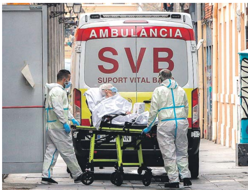
Dos trabajadores sanitarios trasladan en camilla a una mujer en Valencia.

MIR de Medicina Preventiva y Salud Pública