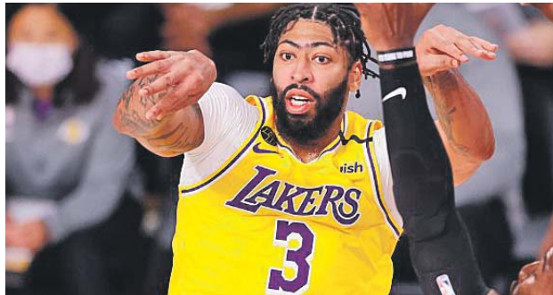
Anthony Davis 190 millones ganará en los cinco próximos años