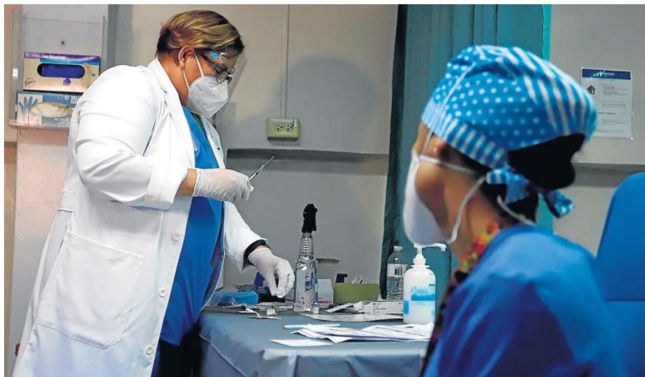
Una sanitaria se dispone a administrar la vacuna de Pfizer a una mujer.

LAS PRIMERAS se repartirán en base a la población mayor que vive en residencias y grandes dependientes SE DESCONOCE cuántas dosis llegarán en la primera remesa, a 50 puntos secretos y con escolta de Interior SANIDAD duda aún de si inocularlas todas o guardar la mitad para asegurar la dosis doble