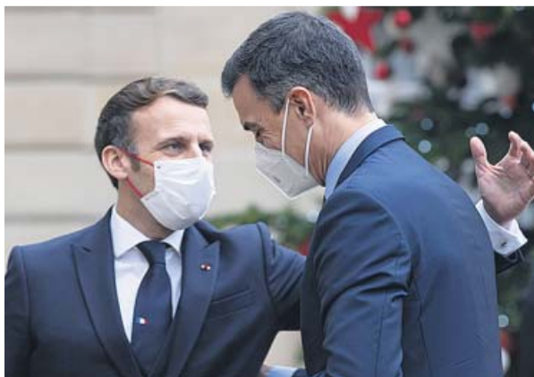
Macron recibe a Sánchez el lunes pasado en el Elíseo.

sos. Desde el día de la comida en París -el 14 de diciembre- hasta el día de Nochebuena. Solo él tendrá que permanecer aislado porque, según indicó el Gobierno, se determinó que Sánchez fue el único «contacto estrecho» de la delegación española que viajó a París.