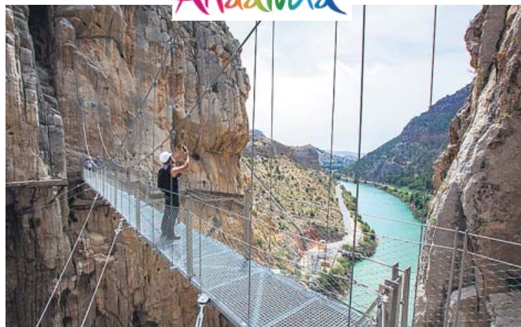
El Caminito del Rey permite travesar el Desfiladero de los Gaitanes por sus impresionantes pasarelas en una experiencia irrepetible en el corazón de Málaga. TURISMO DE ANDALUCÍA