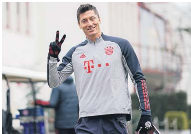
Robert Lewandowski, en una foto con el Bayern.

Ayer lo ganó Robert Lewandowski, el voraz delantero del Bayern Munich, el equipo del año. Era de ley y los gerifaltes alemanes, por si acaso, ya habían hecho lobby durante los últimos días avisando de su total indignación en caso de que el premio no fuera para este hombre de 32 años que vive por y para el gol. Pero no hizo falta, era lógico que el