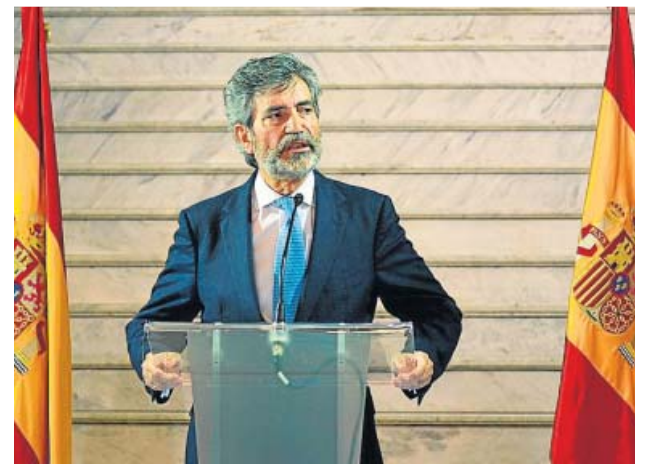
El presidente del Supremo y del CGPJ, Carlos Lesmes.

Señaló, por último, el CGPJ que Europa estará alerta, como lo ha estado hasta ahora. Cabe recordar que el Grupo de Estados contra la Corrupción y la Asociación Europea de Jueces ya protestó contra la propuesta de reforma primitiva presentada por Unidas Podemos y los socialistas, que pretendían rebajar la mayoría reforzada de las cámaras legislativas para renovar el CGPJ sin el acuerdo con el PP, que sigue pareciendo difícil. ●