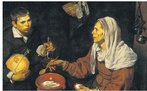
Vieja friendo huevos , de Diego Velázquez. SCOTTISH NATIONAL GALLERY

Así escuchamos la voz de una anciana ciega, Sofonisba An-