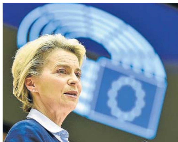
Ursula von der Leyen, en el Europarlamento.

Sin embargo, en la rueda de prensa diaria de la Comisión de ayer, el portavoz jefe del Ejecuti-