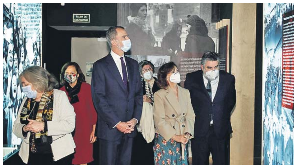
El rey, junto a Calvo en la inauguración de la exposición sobre Azaña.

El rey Felipe VI expresó ayer su reconocimiento a la figura y el legado del que fuera presidente de la II República Manuel Azaña en la inauguración de una exposición en la