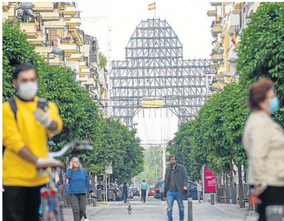
Portada de la Feria a medio construir de la edición de este año.

La decisión fue comunicada ayer mismo al resto de los portavoces de los grupos políticos, según afirmó el Consistorio. A partir de ahora, tanto