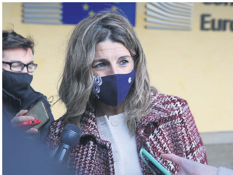
La ministra de Trabajo, Yolanda Díaz, atiende ayer a los medios en Bruselas.

La alcaldesa de Barcelona, Ada Colau, también defendió la inmersión lingüística e insistió en que se ha demostrado que «es un éxito de todos los catalanes para garantizar el bilingüismo y la cohesión social». ●