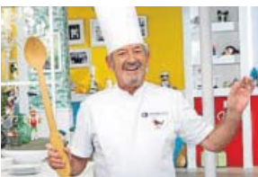
GASTRONOMÍA Cocina abierta ANTENA 3. 13.20 H

Ariel Rot recorre a modo de road movie distintos puntos de la geografía española para encontrarse con sus músicos más representativos. Un viaje musical por todo el país con muchas sorpresas escondidas.