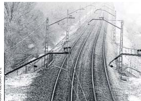
EDUARDO PARRA / EFE