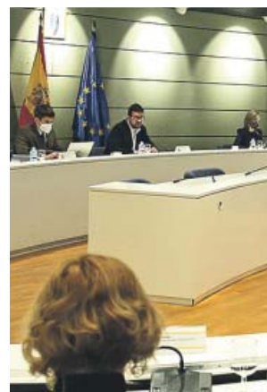
El pasado viernes se produjo la primera reunión. EP

Entre los elementos que las centrales y Trabajo pretenden que se mantengan en los mismos términos se encuen-