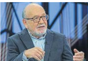
DIVULGATIVO La aventura del saber LA 2. 09.55 H

Destinado a ampliar conocimientos entre los ciudadanos sobre materias dispares como cultura, ciencia, tecnología o medio ambiente, combina la emisión de reportajes con entrevistas y tertulias en plató.