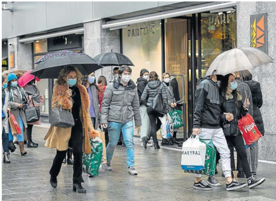
Los comercios, en plena campaña de rebajas, estarán abiertos hasta las 20.00 horas.

UNIVERSIDAD Los estudiantes de la US vuelven desde hoy progresivamente a dar clases presenciales