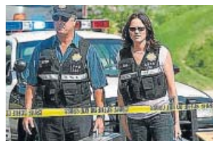
CSI Las Vegas ENERGY. 09.00 H

Un grupo de científicos forenses que trabaja en un laboratorio de criminalística de Las Vegas (Nevada, Estados Unidos) tiene que resolver los crímenes que van sucediendo en la ciudad, a cada cual más extraño.