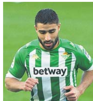
Nabil Fekir, en el derbi de la semana pasada.

El equipo de Manuel Pellegrini es el más goleado de la categoría y eso ha sido un lastre para conseguir enlazar triunfos y meterse en la pelea por los puestos europeos, algo que quedó de manifiesto en su último desplazamiento liguero, en el que