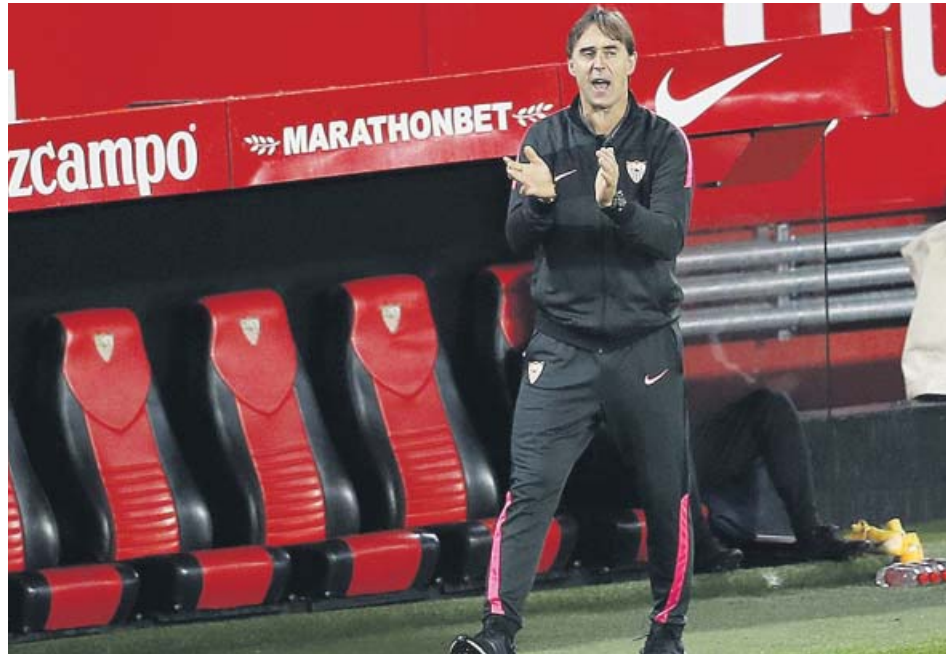
Julen Lopetegui en un partido de esta temporada.

El preparador vasco, que llegó al Sevilla en verano de 2019,