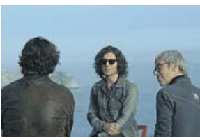
MÚSICA Un país para escucharlo LA 2. 22.55 H

Destinado a ampliar conocimientos entre los ciudadanos sobre materias dispares como cultura, ciencia, tecnología o medio ambiente, combina la emisión de reportajes con entrevistas y tertulias en plató.