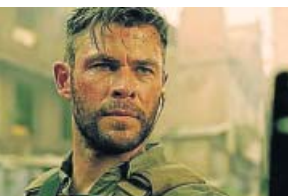
'Extraction' LA SEXTA. 22.30 H

Edward, un apuesto y rico hombre de negocios, contrata a una prostituta, Vivian, durante un viaje a Los Ángeles. Tras pasar con ella la primera noche, le ofrece pasar juntos toda la semana y que le acompañe a diversos actos sociales.