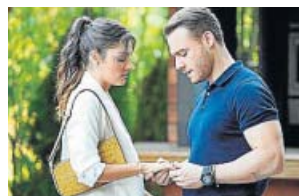
Love is in the air TELECINCO. 22.00 H

Un grupo de científicos forenses que trabaja en un laboratorio de criminalística de Las Vegas (Nevada, Estados Unidos) tiene que resolver los crímenes que van sucediendo en la ciudad, a cada cual más extraño.