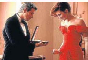
'Pretty Woman' TELECINCO. 23.00 H

Edward, un apuesto y rico hombre de negocios, contrata a una prostituta, Vivian, durante un viaje a Los Ángeles. Tras pasar con ella la primera noche, le ofrece pasar juntos toda la semana y que le acompañe a diversos actos sociales.