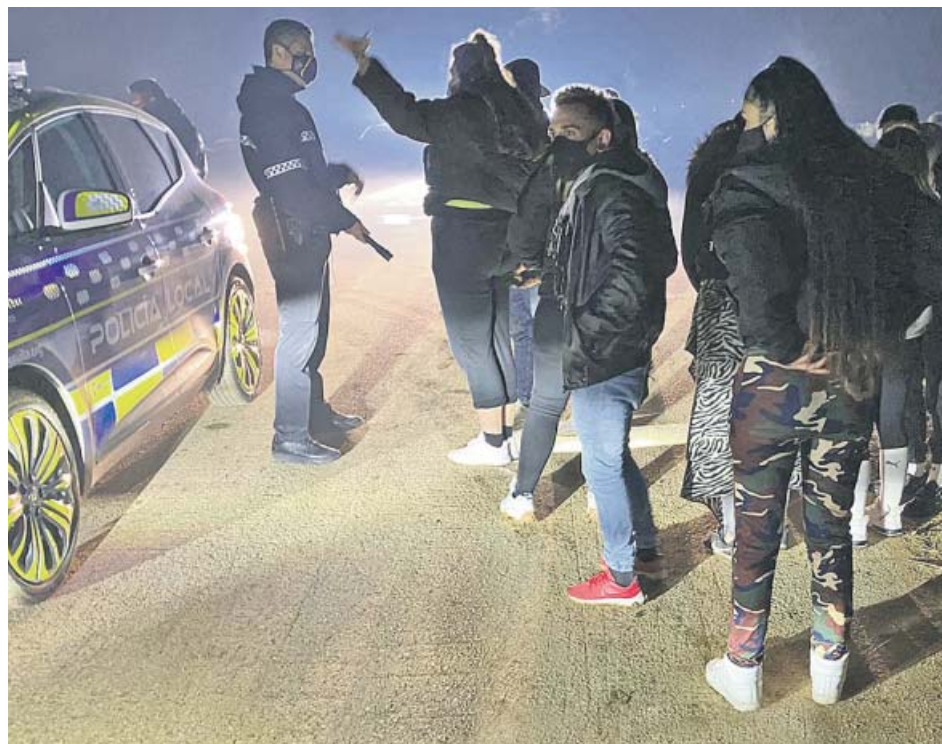
La Policía Local de Sevilla procede a desalojar a los jóvenes de la fiesta ilegal.

«El mismo que decía que el mando único central era un abuso y restaba autonomía y competencias a las comunidades ahora no ejerce las que tiene y pretende que el Estado lo haga por él», criticó.