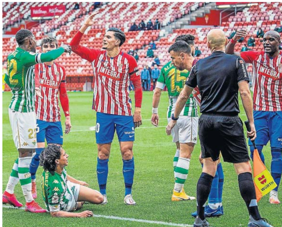
Los jugadores del Sporting protestan el penalti señalado sobre Lainez (en el suelo).

El Sporting se quedaba con un hombre menos, lo que obligó a Gallego a hacer un cambio dando entrada a otro central, Borja López, en lugar de un centrocampista,