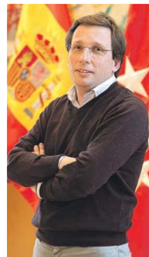
El alcalde de Madrid, José Luis Martínez-Almeida.

¿A usted le gustaría que de cara a las siguientes elecciones PP y Cs fuesen juntos?