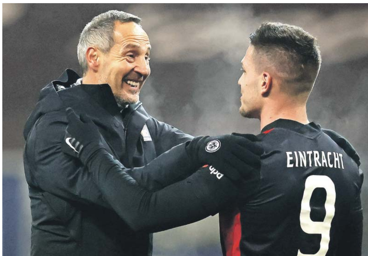
Luka Jovic celebra uno de sus goles con Adi Hütter, entrenador del Eintracht de Frankfurt.