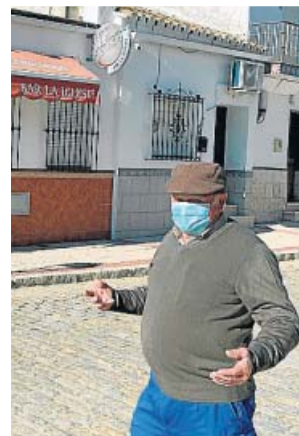
Vecino de El Garrobo (Sevilla), un municipio confinado.

Además de la excepción para esquiar, la Junta también permite la movilidad interprovincial para cazar, siempre que sean «actividades cinegéticas vinculadas al control de la so-