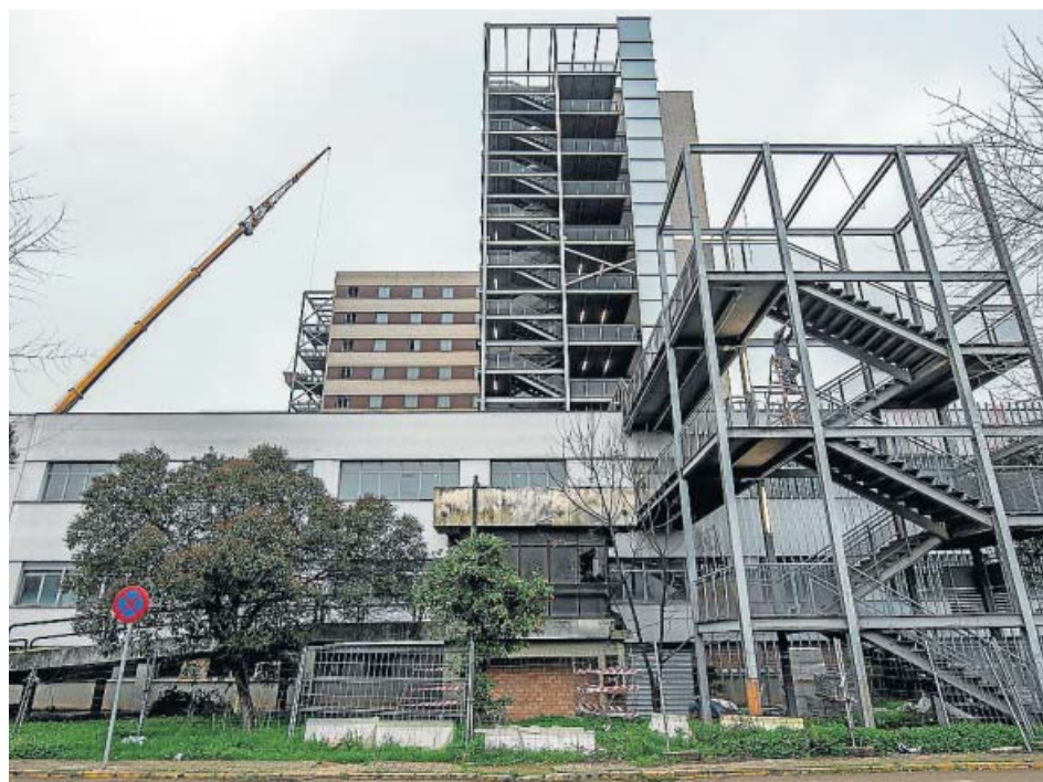
Los operarios de mantenimiento ultimaban ayer domingo los preparativos.

La provincia de Sevilla también alcanzó este fin de semana registros nunca antes observados desde marzo del año