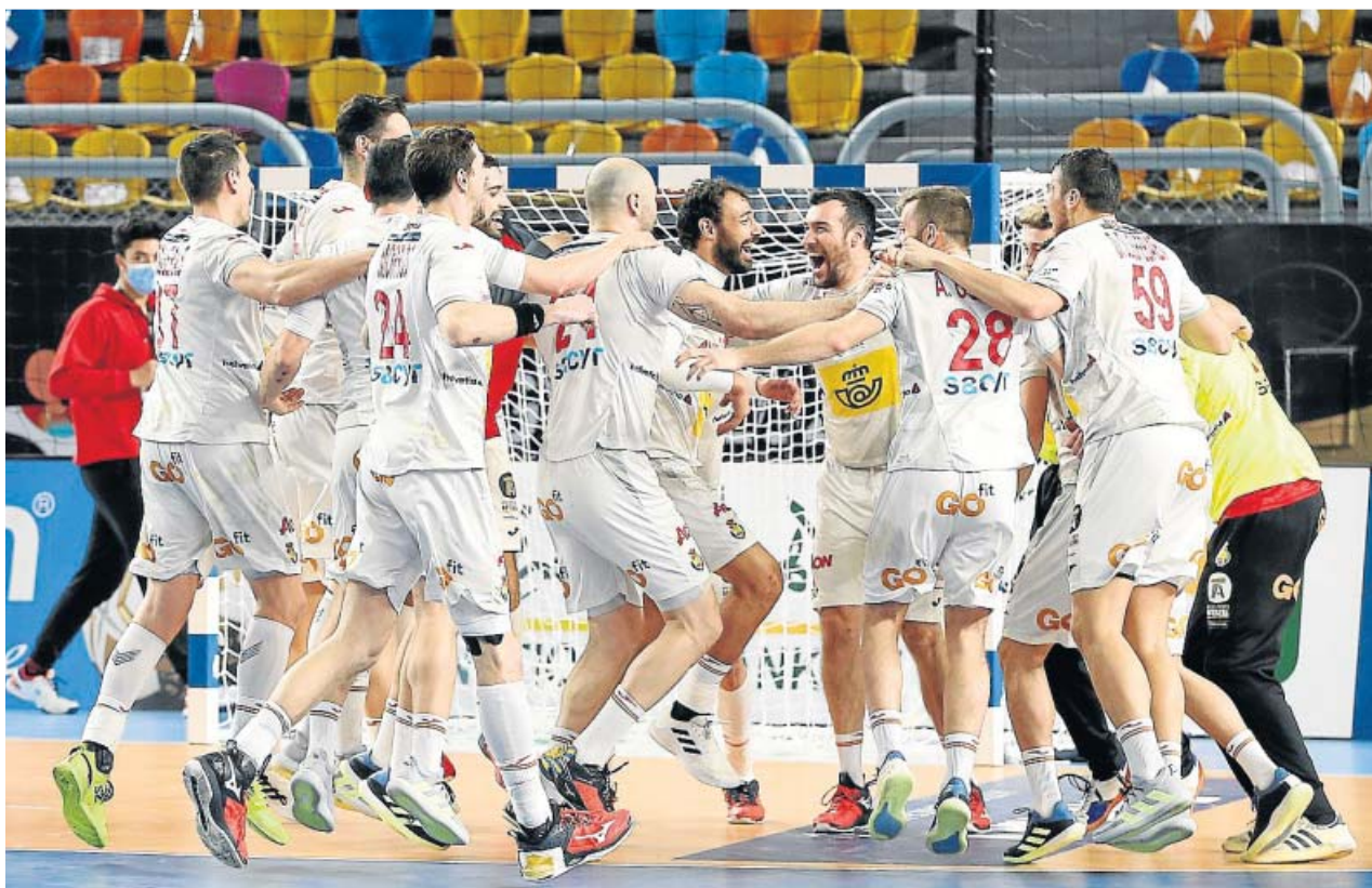
Los jugadores de la selección española celebran el bronce mundialista conseguido ante Francia en Egipto.