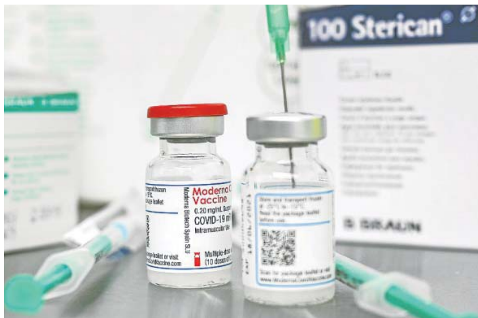
52.000 dosis de la vacuna de Moderna llegaron ayer a España.

Asimismo, el departamento que dirige Carolina Darias in-