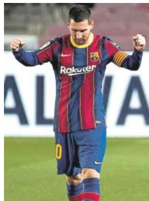
Leo Messi celebra el gol ante el Athletic.

El Barça ofreció su mejor versión en el primer tramo del choque. Con De Jong a los mandos, excelente en la distribución y en la conducción, el juego culé fluía y el que mejor lo aprovechó fue Messi. Otro aviso del argentino, en un remate con el pecho, fue el