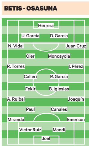
Benito Villamarín Hoy, 21 horas

La amplia competencia en el puesto de nueve ha provocado la salida de Sanabria. Tras una temporada en la que se ha repartido los minutos con Borja Iglesias y Loren Morón, el club ha decidido que el paraguayo saliera ante la buena oferta llegada desde Italia. Sanabria, de 24 años, que llegó al Betis en 2016, ha participado con el equipo verdiblanco es-