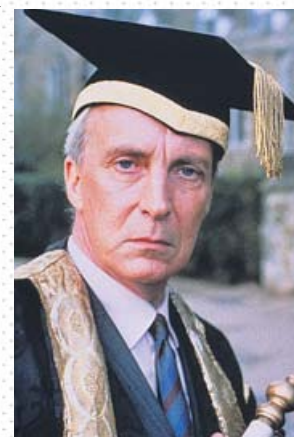
Ian Richardson es uno de los protagonistas. CHANNEL 4

El revolucionario de marras tiene el rostro de Ian Richardson, protagonista de la versión original de House of Cards y uno de esos actores ingleses a los