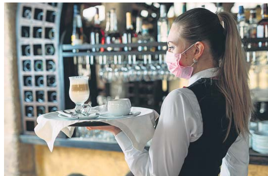
Una mujer acogida al programa Incorpora trabajando en el sector de la hostelería.

Un mitin convocado por Vox en Sabadell (Barcelona) derivó ayer en incidentes, pese al dispositivo policial, entre simpatizantes de esta formación y manifestantes antifascistas que protestaban por la celebración del acto. Los Mossos d'Esquadra investigan a una persona por daños a objetos a raíz de los incidentes, si bien no consta ningún detenido ni denuncia. Estos incidentes ocurrieron tras otros previos en Reus y un día después de que el líder de Vox, Santiago Abascal, fuera recibido en Girona con insultos y lanzamiento de grava por una cincuenta de manifestantes. ●