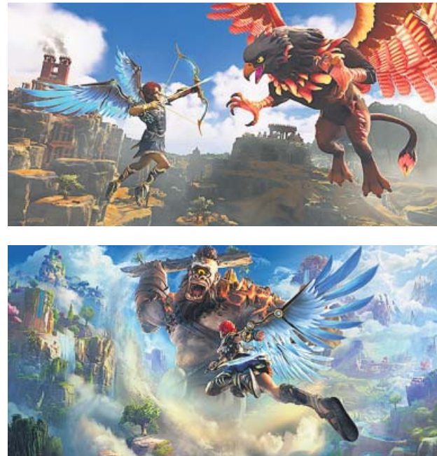
Immortals Fenyx Rising está disponible para PS4, PS5, Xbox One, Xbox Series X, Nintendo Switch, Google Stadia y PC. UBISOFT