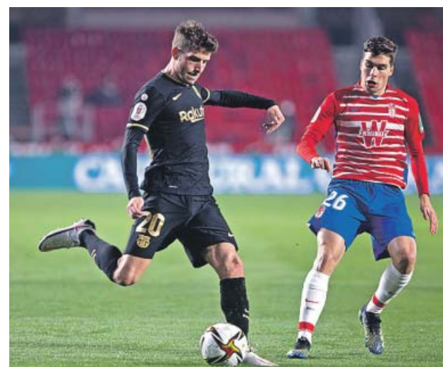
Sergi Roberto intenta un pase ante el Granada.

El Betis recibe esta noche al Athletic en el Benito Villamarín, con el objetivo de lograr el último billete para las semifinales