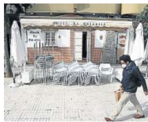
Un restaurante cerrado por culpa de la pandemia.

Sus declaraciones fueron la respuesta a la queja de los hosteleros y comerciantes, especialmente de las ciudades de Málaga y Almería, donde solo pueden abrir los establecimientos esenciales. En la capital de la Costa del Sol, concretamente, estos gremios han pedi-