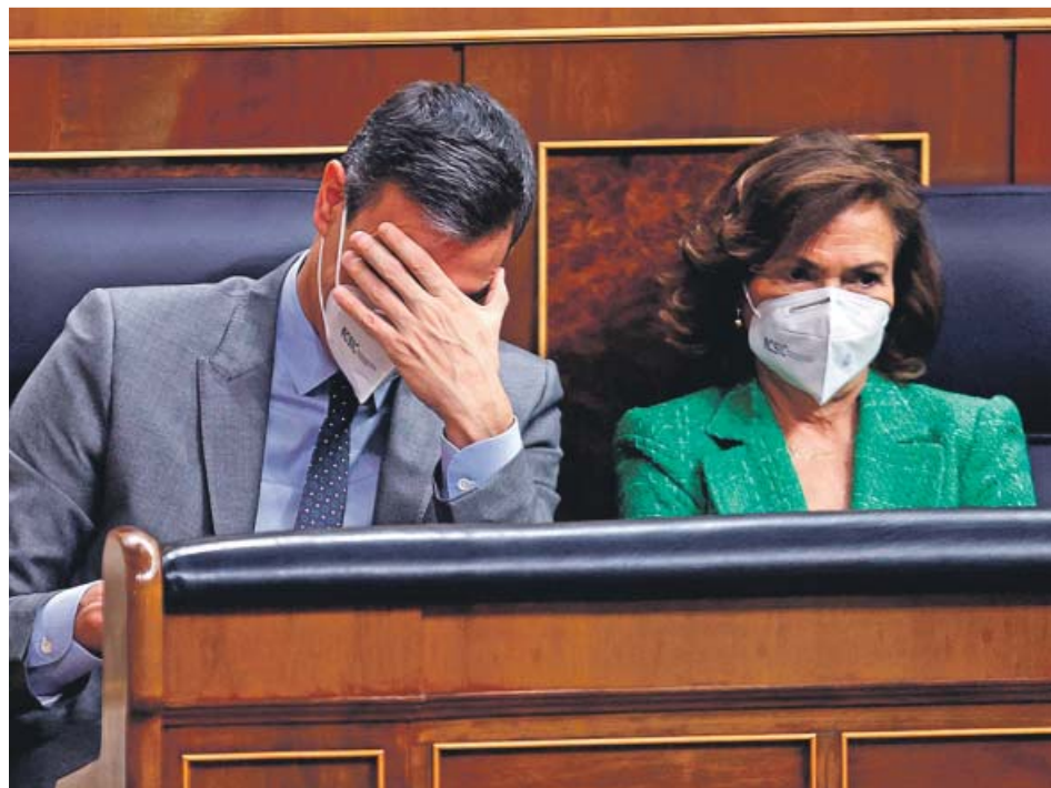
El presidente del Gobierno y la vicepresidenta primera, ayer, en el Congreso. EFE

Según ha podido saber este diario, el Consejo de Estado emitió un «largo» informe con unos comentarios «menores» y otros con «más sustancia». El Gobierno asegura que los atendió en su totalidad. Es decir, que incluyó los comentarios en la versión final del decreto que aprobó el Consejo de Ministros en diciembre y la semana pasada convalidó el Congreso. A pesar de ello, el Ejecutivo rechazó ayer darlo a conocer y, con ello,