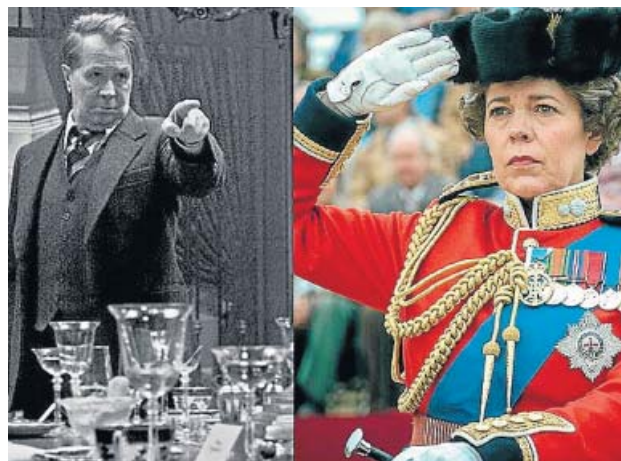
La película Mank y la serie The Crown son las favoritas.

Precisamente, estas dos últimas cintas, ambas de la plataforma Netflix, son las favoritas en esta edición, con seis y cinco nominaciones, respectivamente. Les siguen Nomadland , Una joven prometedor y El padre , con cuatro cada una. Estas cinco películas aspiran, además, a convertirse en la película dramática del año. El premio a mejor comedia o musical se dirimirá entre Borat , película film secue-