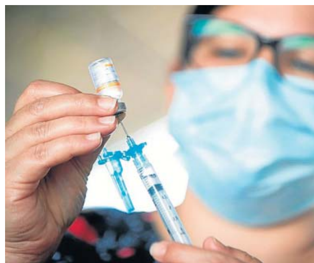
Una sanitaria prepara una dosis de la vacuna contra la Covid.

El estudio preliminar de la institución académica, publicado este martes, muestra que