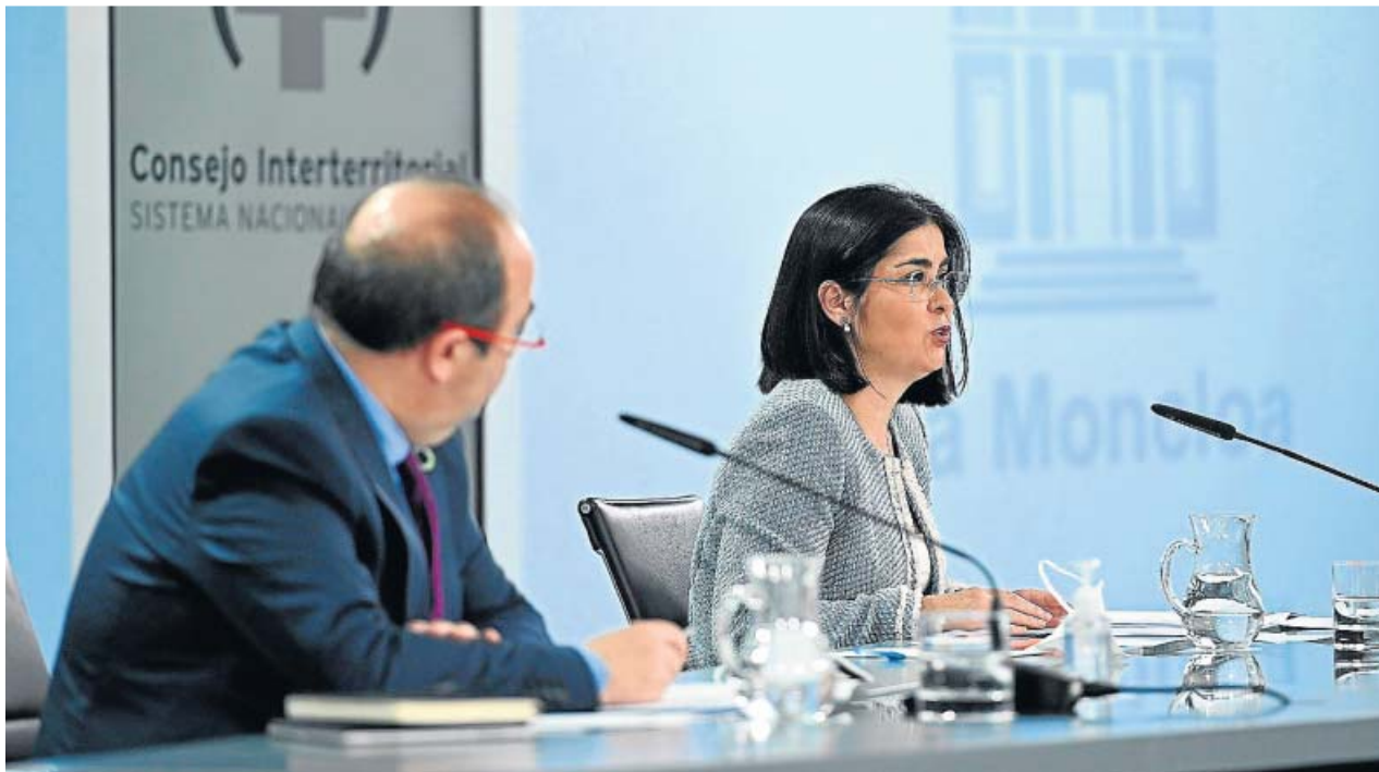
Los ministros de Política Territorial, Miquel Iceta, y de Sanidad, Carolina Darias, ayer tras el Consejo Interterritorial.