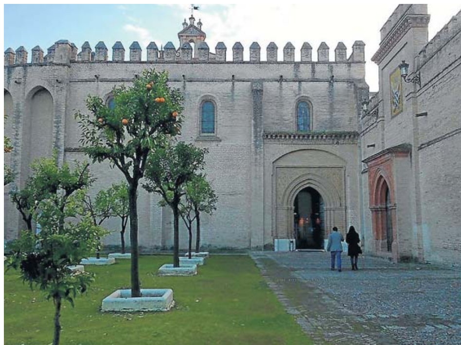
Patio del monasterio de San Isidoro del Campo.

«Tras 37 años de abandono y olvido», la Junta anunció ayer que «en breve» saldrá la nueva licitación para la redacción del proyecto de consolidación del monasterio de San Isidoro del Campo (Santiponce), un BIC que data del año 1301. Así lo afirmó la consejera de Cultura, Patricia del Pozo, que explicó que se destinarán 4,7 millones de euros a las obras de consolidación estructural, con un plazo de ejecución de 13 meses, y 540.000 euros a reparar el cerramiento exterior dañado. ●