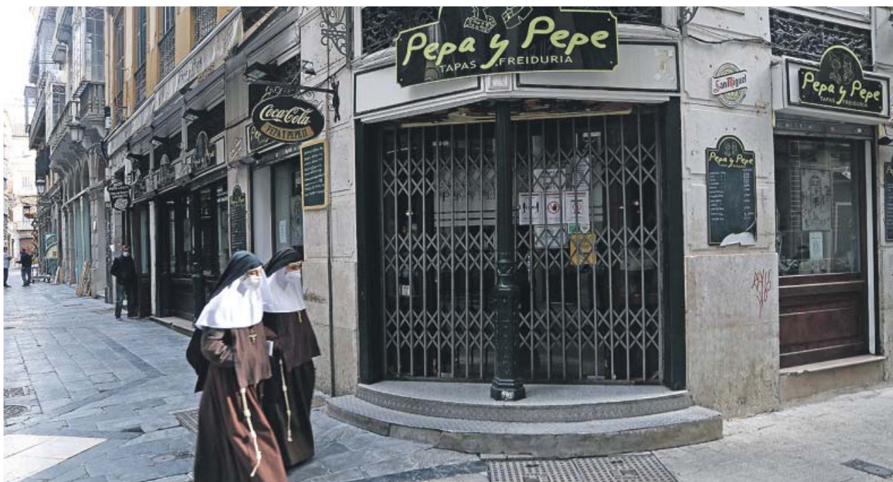
Dos religiosas caminan delante de un comercio cerrado en Málaga, donde no puede abrir la actividad no esencial.

OCHO DE CADA DIEZ dicen que se pondrán las dosis «en cuanto puedan», según una encuesta del Centra